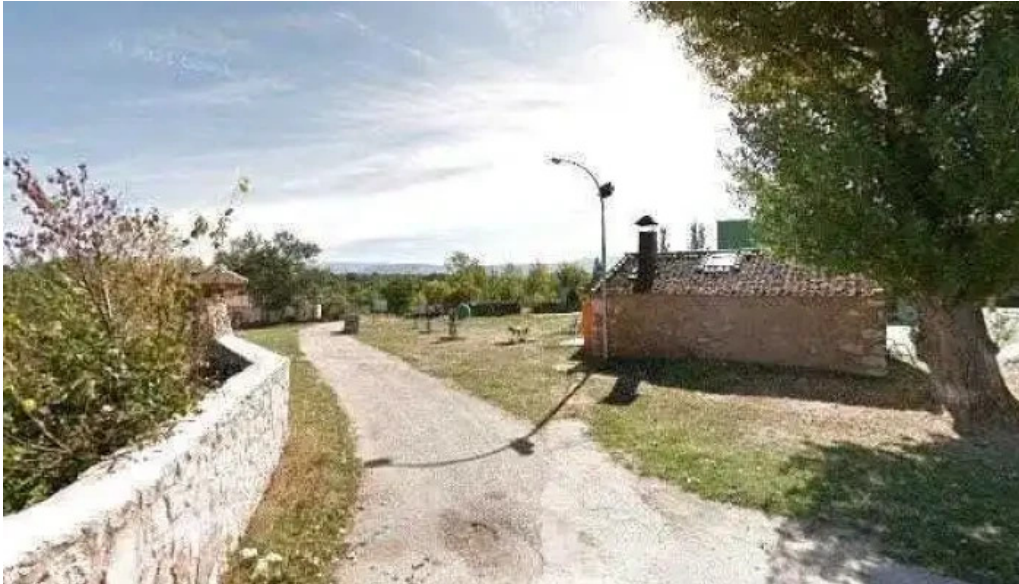
Iglesia de nuestra senora de tejadilla iglesia catolica