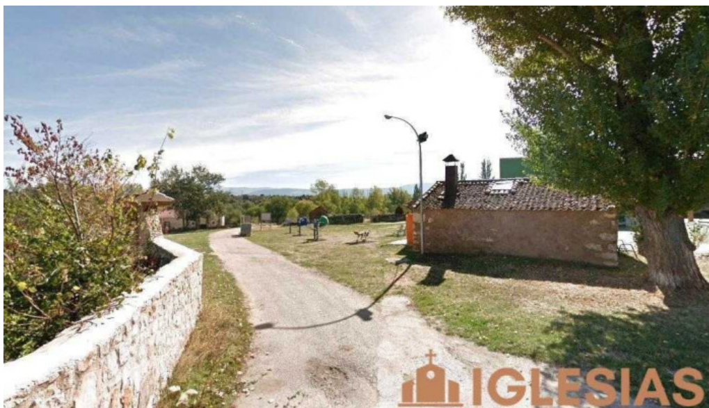
Iglesia de nuestra señora de tejadilla tejadilla