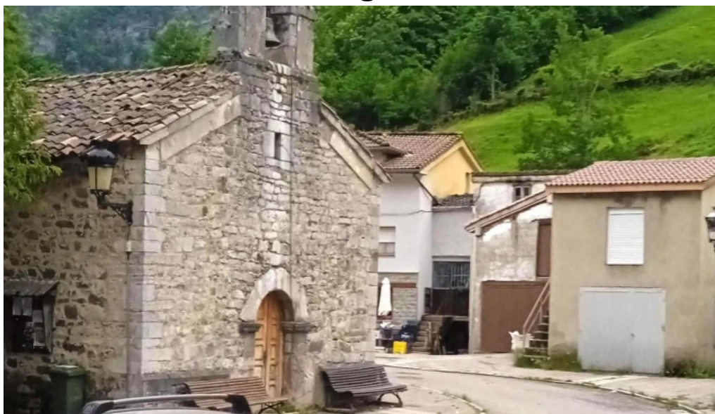
Iglesia de san pedro de tarna tarna