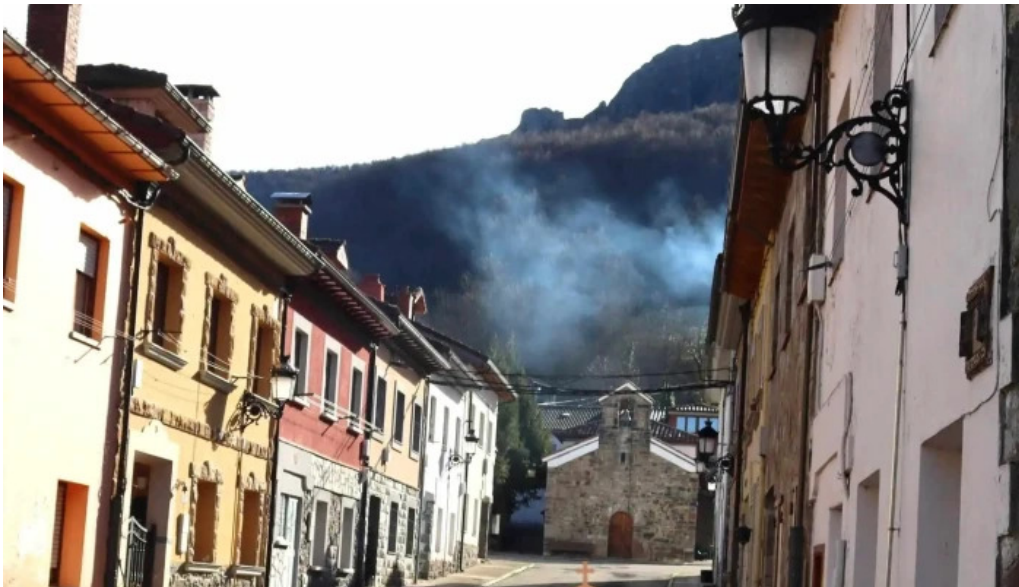
Iglesia de san pedro de tarna iglesia catolica