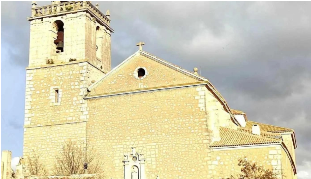
Iglesia de nuestra senora de la asuncion iglesia