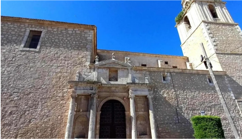
Iglesia de nuestra senora de la asuncion comentario 8