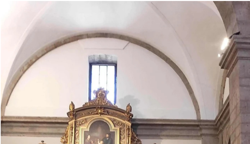
Iglesia de nuestra senora de la asuncion comentario 10