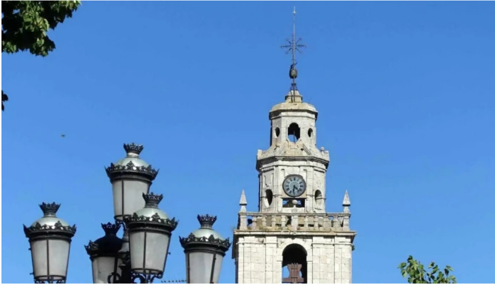
Iglesia de nuestra senora de la asuncion comentario 2