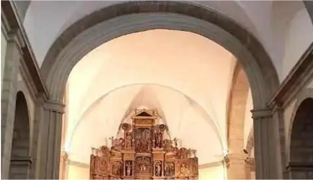
Iglesia de nuestra senora de la asuncion taracon