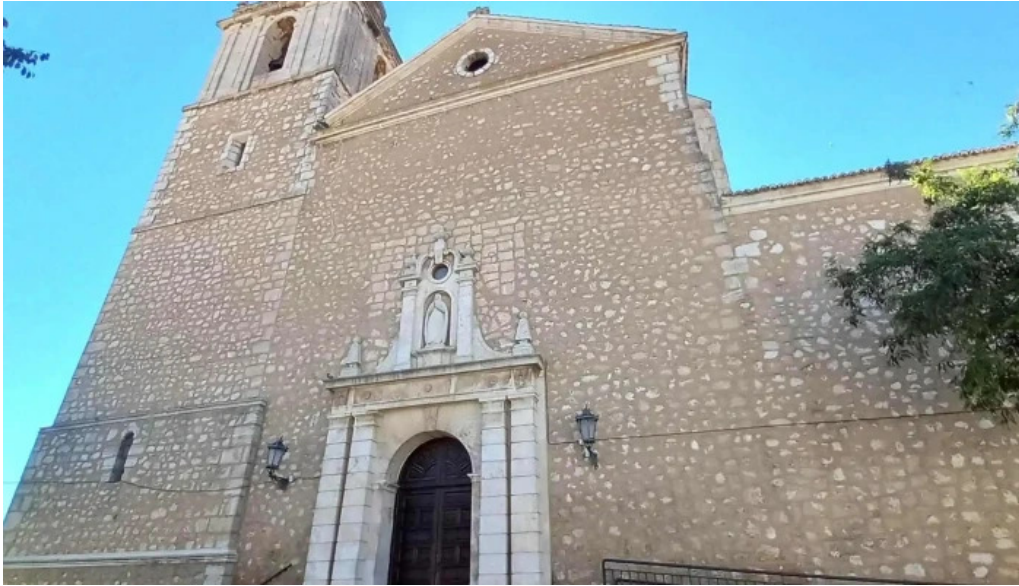
Iglesia de nuestra senora de la asuncion comentario 6