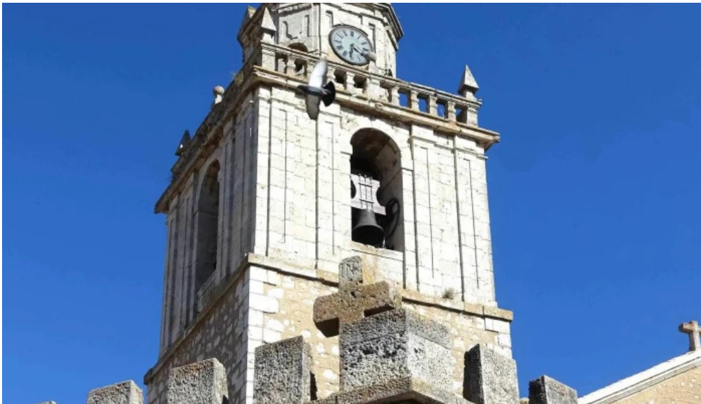
Iglesia de nuestra senora de la asuncion comentario 3