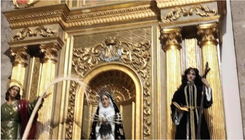
Iglesia de nuestra senora de la asuncion comentario 11