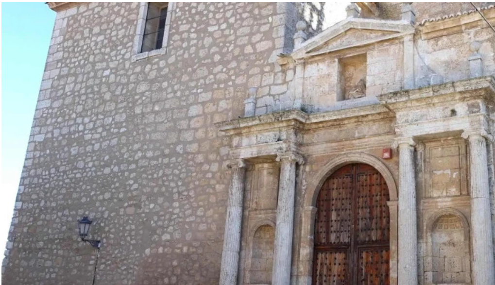
Iglesia de nuestra senora de la asuncion comentario 5