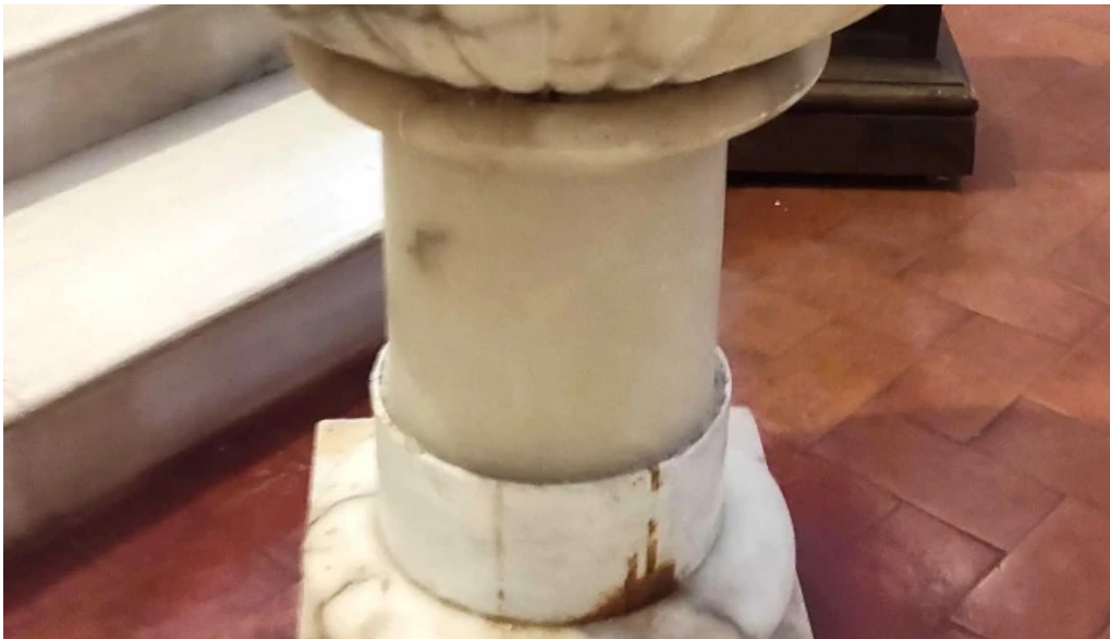
Iglesia de nuestra senora de la asuncion comentario 9