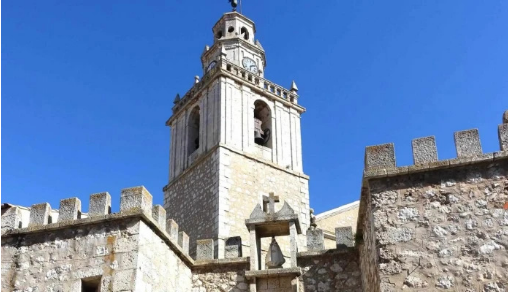
Iglesia de nuestra senora de la asuncion comentario 4