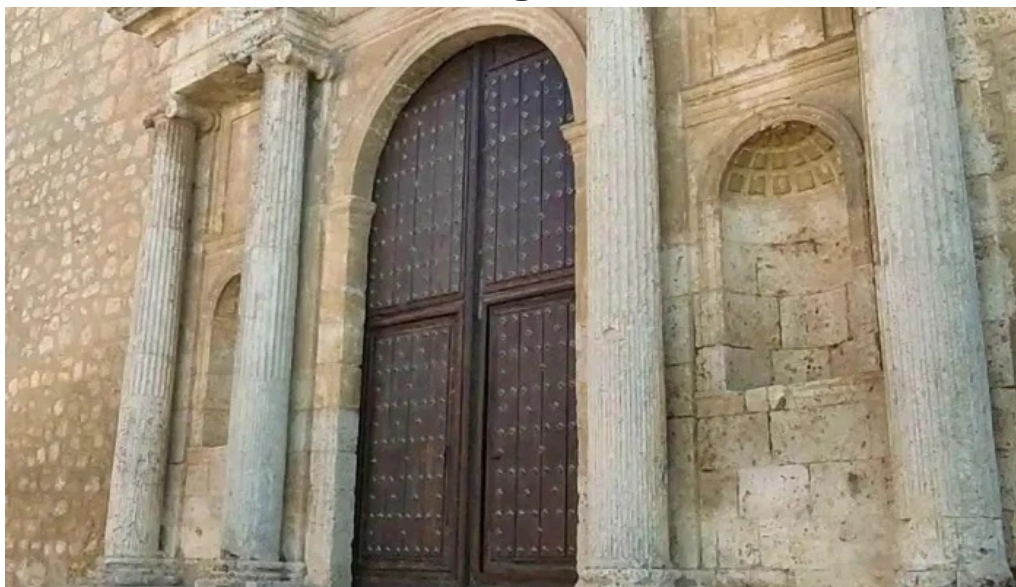
Iglesia de nuestra senora de la asuncion videos