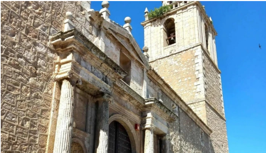
Iglesia de nuestra senora de la asuncion comentario 7