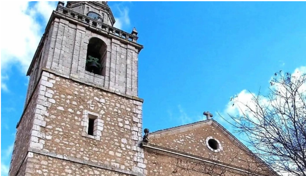
Iglesia de nuestra senora de la asuncion comentario 1