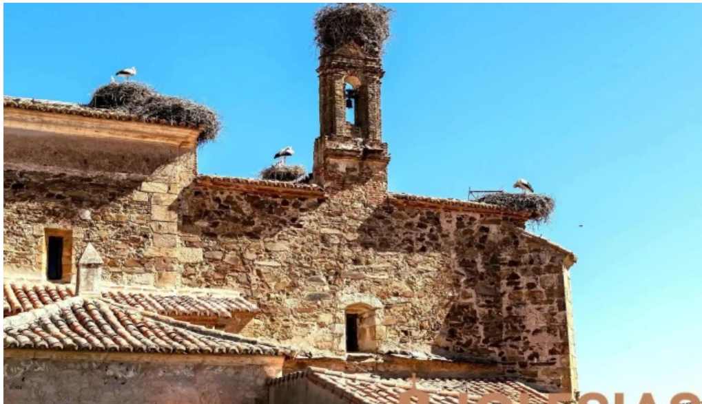
Iglesia de nuestra senora de la asuncion iglesia catolica