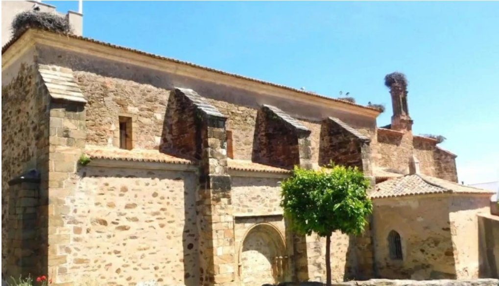
Iglesia de nuestra senora de la asuncion talavan