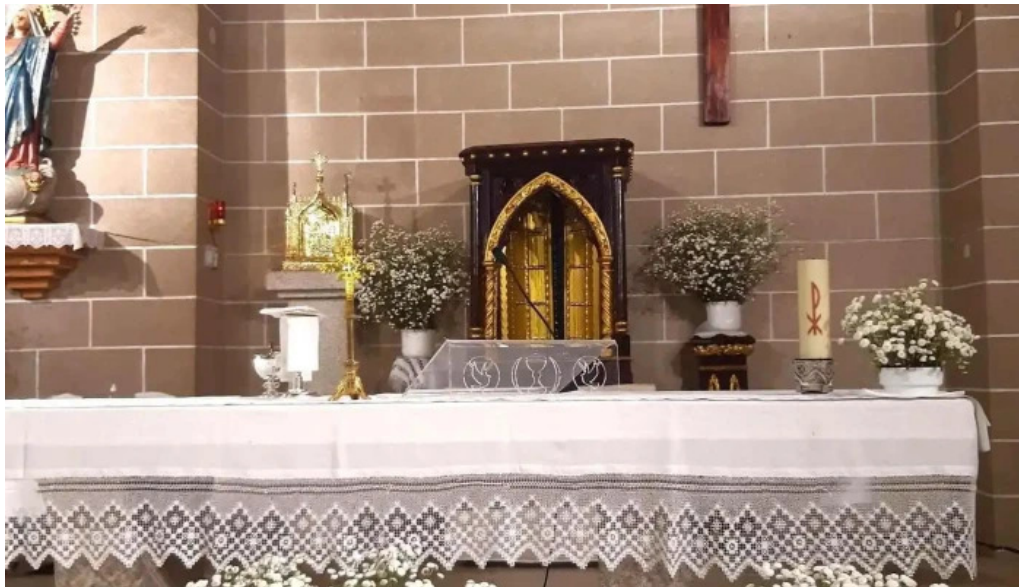
Iglesia de nuestra senora de la asuncion iglesia