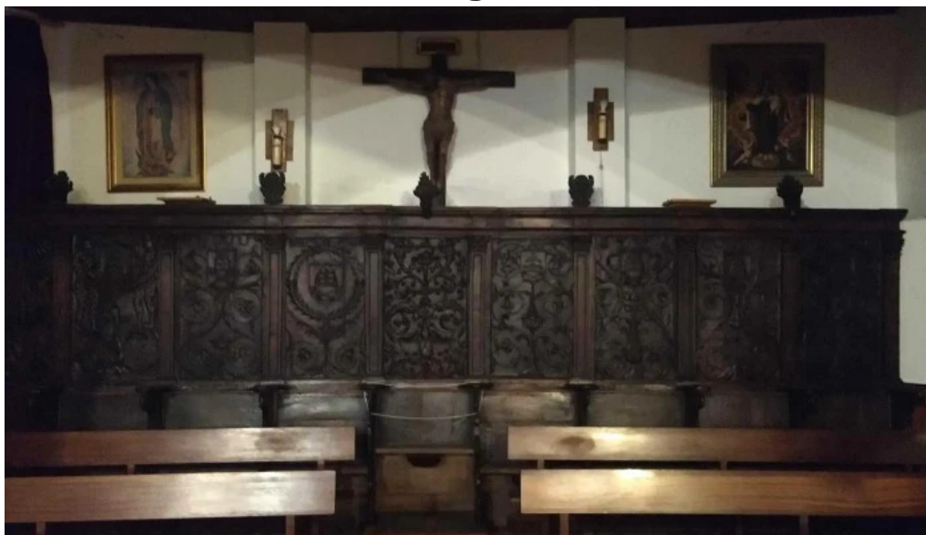
Iglesia de santa maria la mayor zona