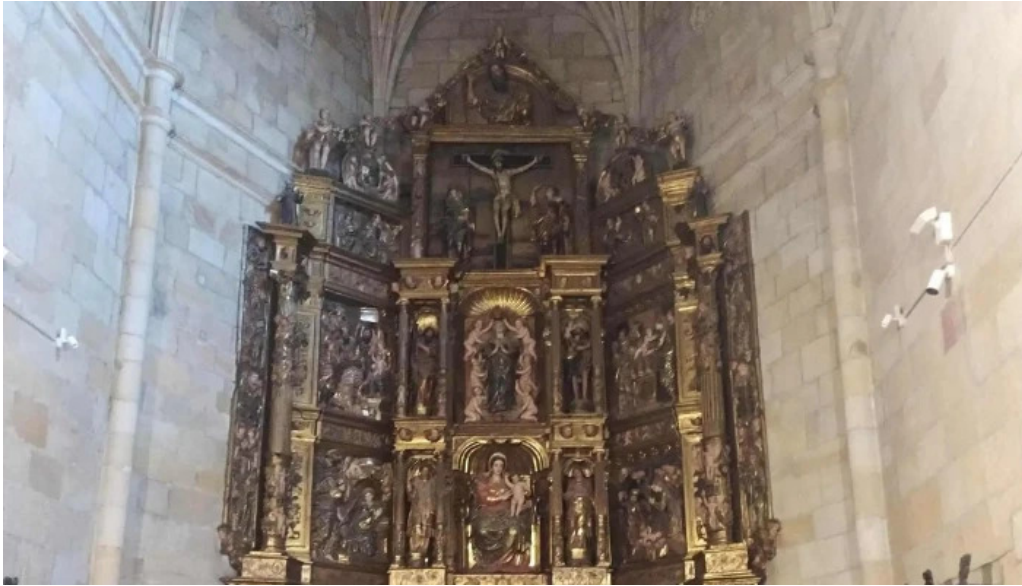
Iglesia de santa maria la mayor horario