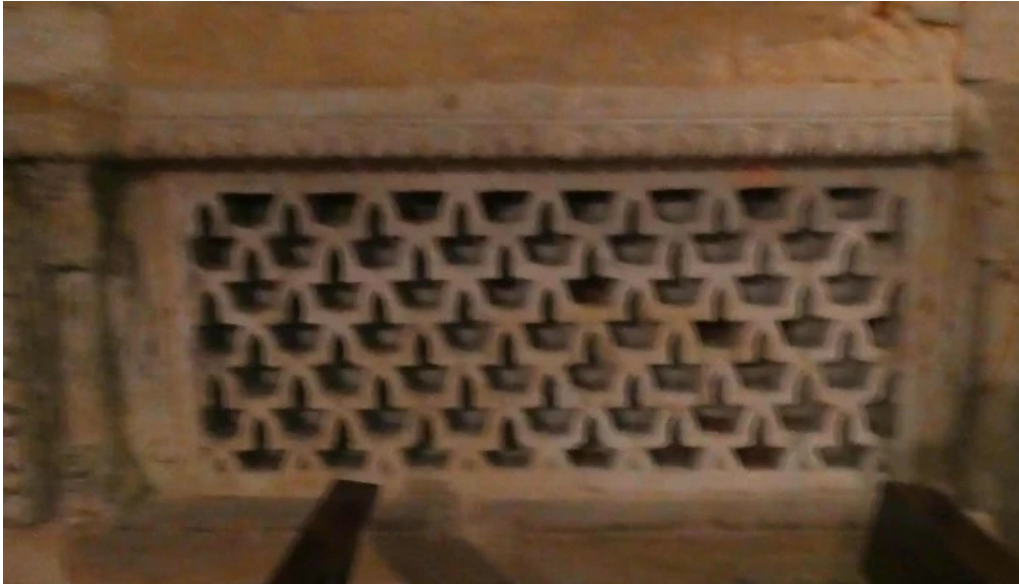
Iglesia de santa maria la mayor cerca de mi