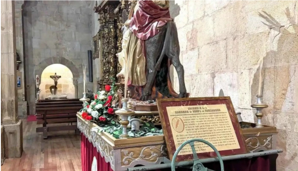
Iglesia de santa maria la mayor recientes