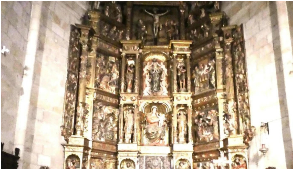
Iglesia de santa maria la mayor precios