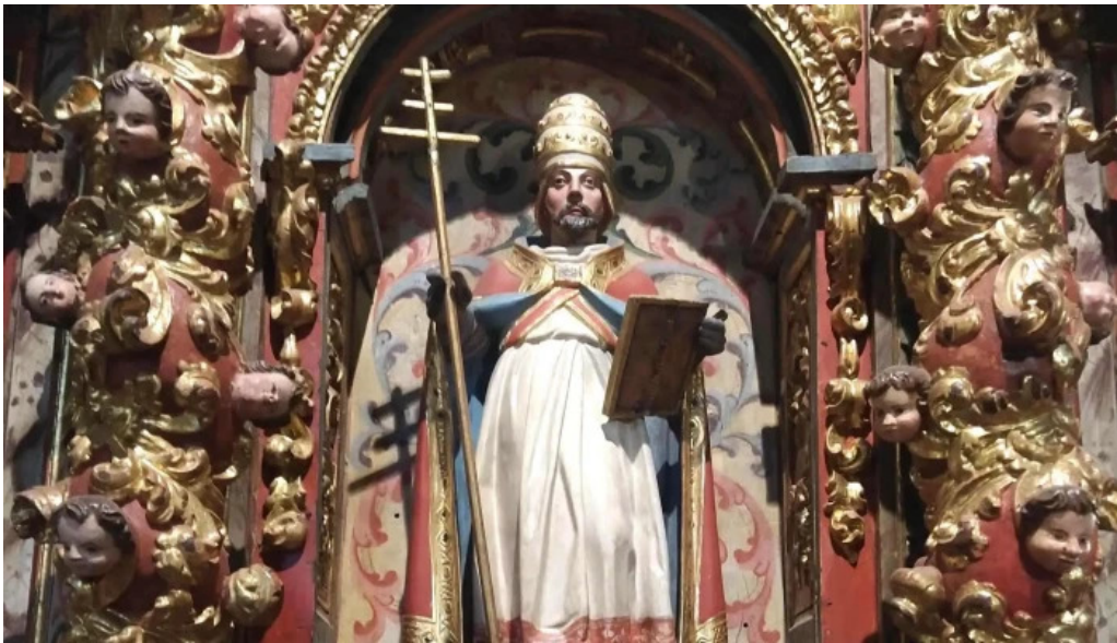
Iglesia de santa maria la mayor como llegar