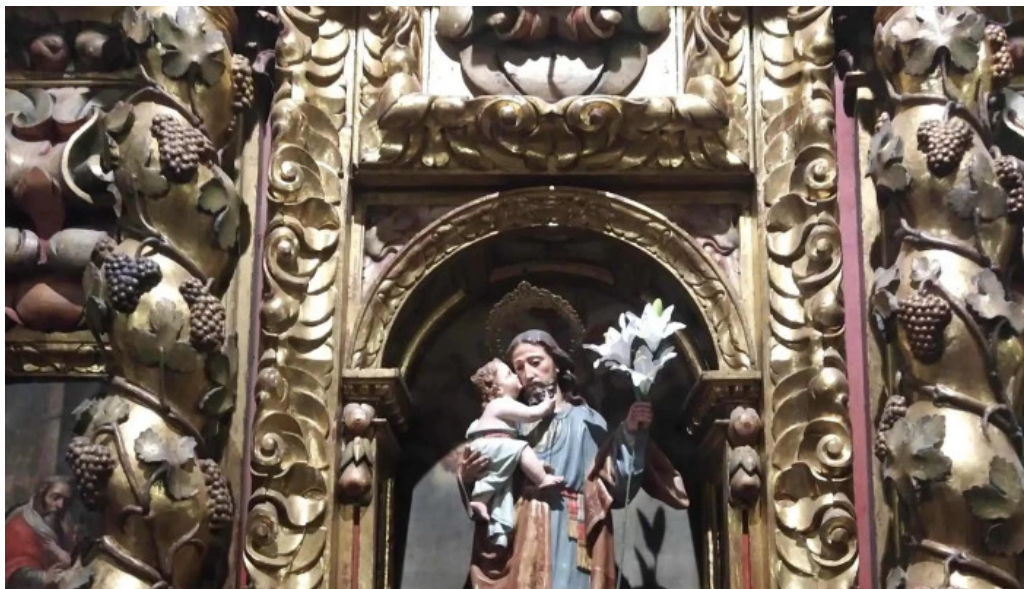
Iglesia de santa maria la mayor instagram