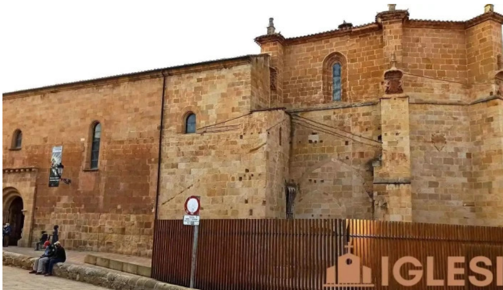
Iglesia de santa maria la mayor iglesia