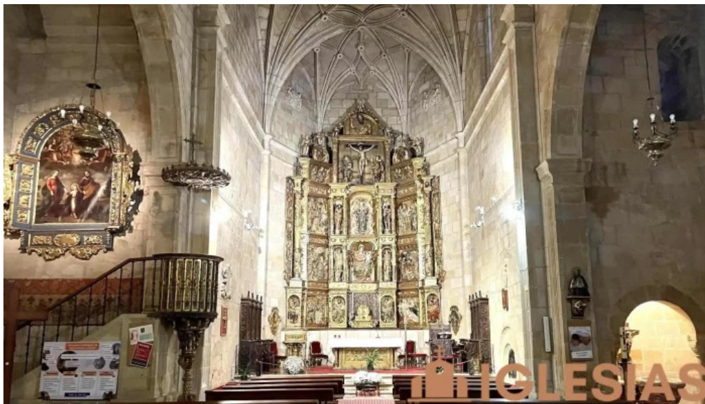
Iglesia de santa maria la mayor iglesia catolica