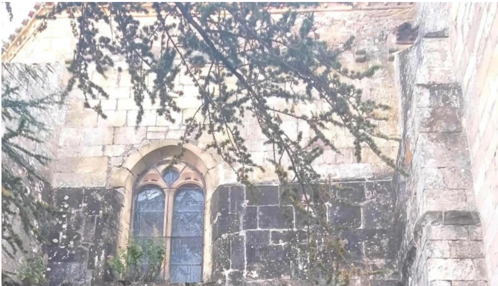
Iglesia de nuestra senora del espino cerca de mi