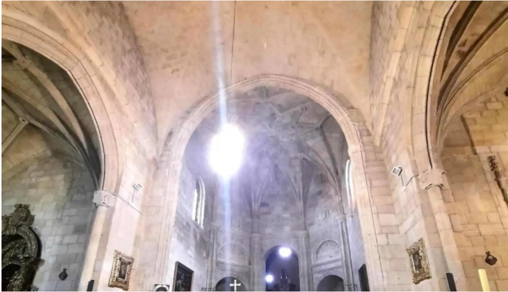
Iglesia de nuestra senora del espino opiniones