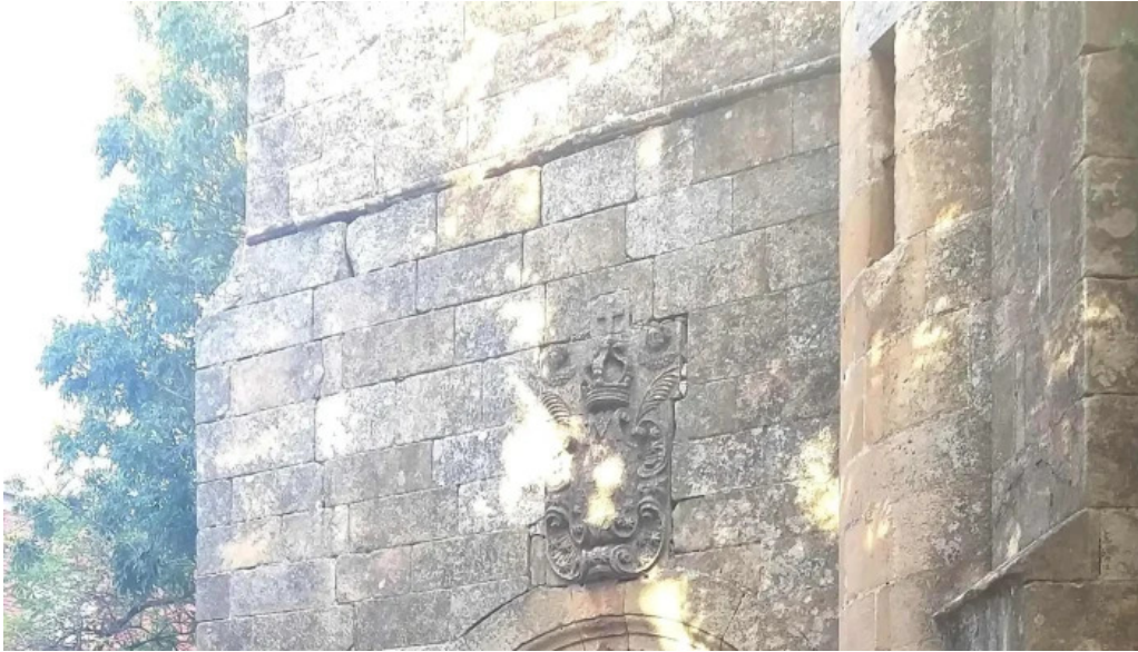
Iglesia de nuestra senora del espino horario