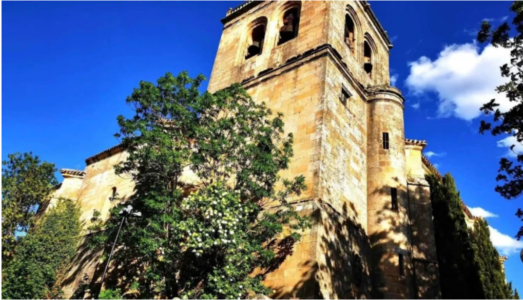
Iglesia de nuestra senora del espino iglesia