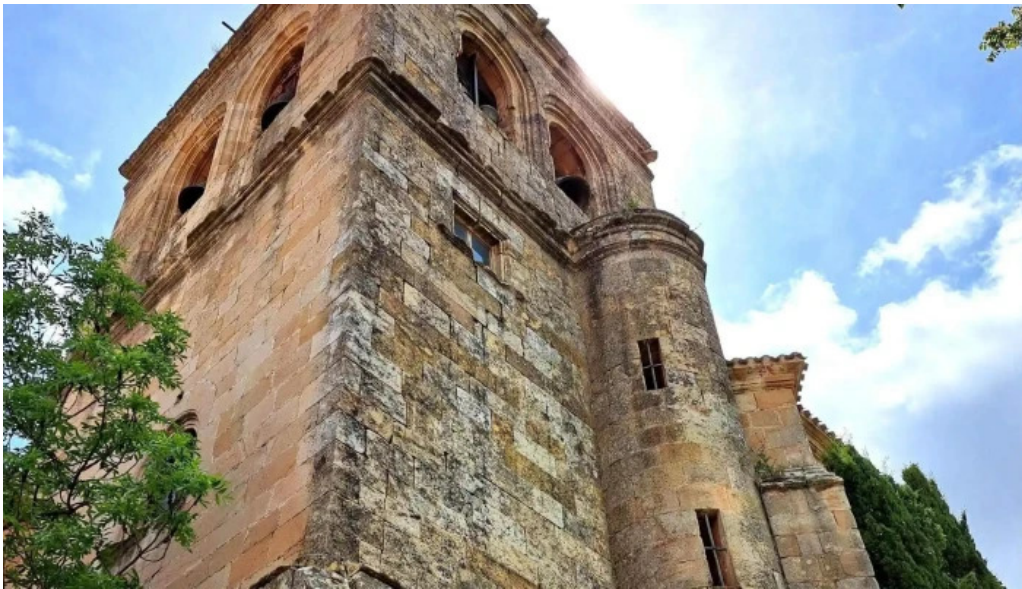
Iglesia de nuestra senora del espino direccion