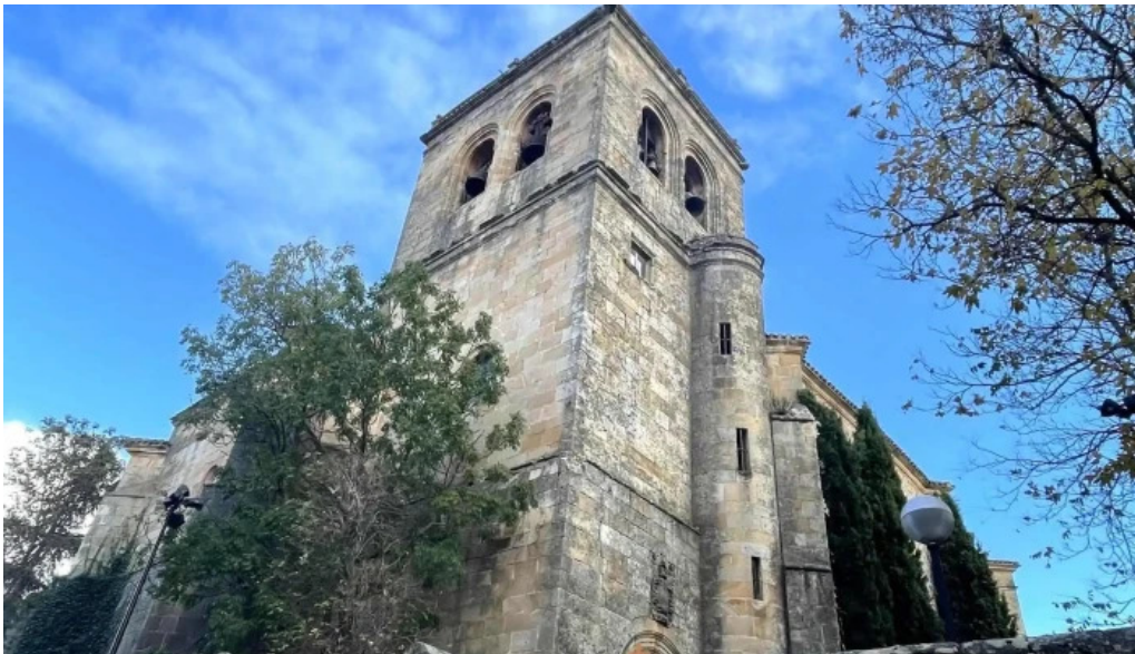
Iglesia de nuestra senora del espino iglesia catolica