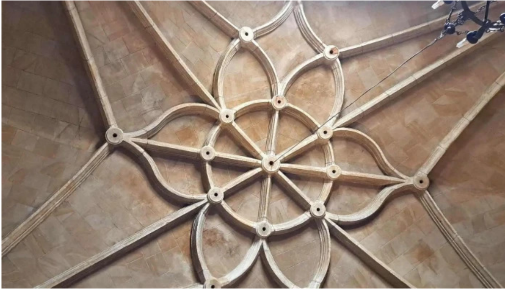
Iglesia de nuestra senora del espino donde