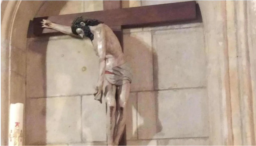
Iglesia de nuestra senora del espino sitio web