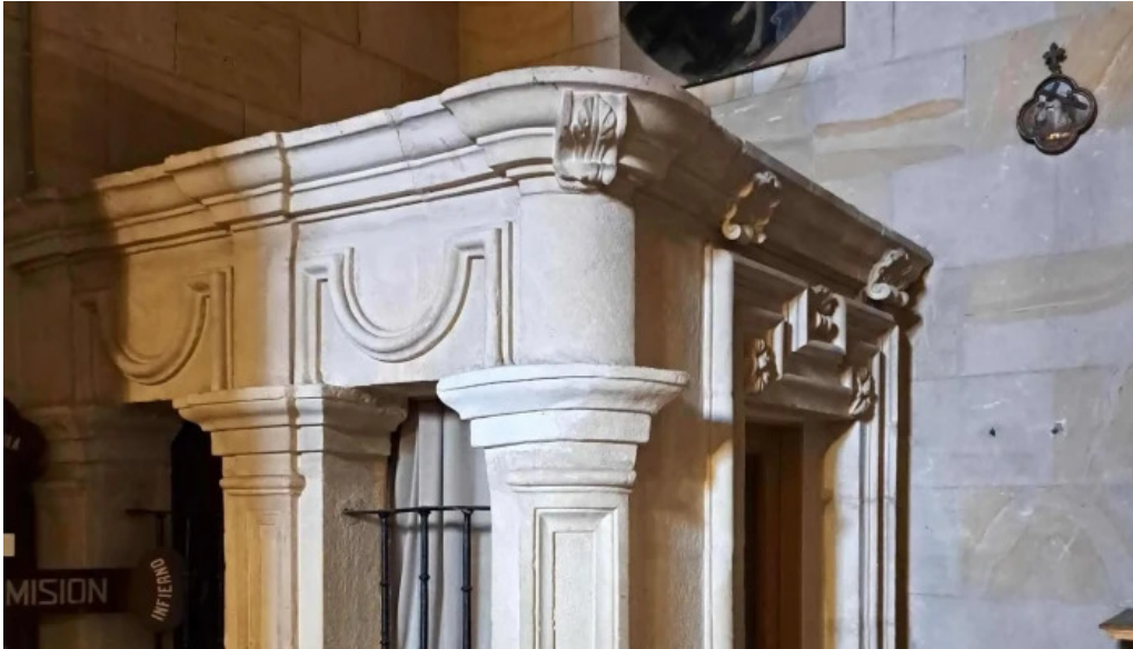
Iglesia de nuestra senora del espino como llegar