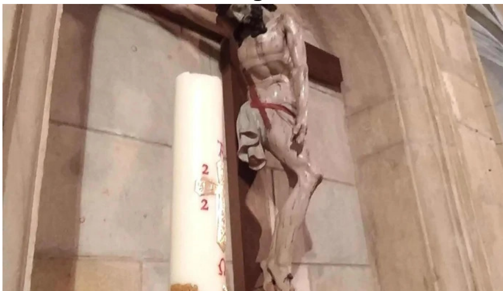
Iglesia de nuestra senora del espino videos