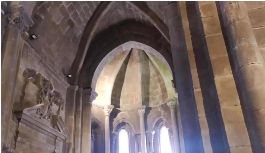
Iglesia de nuestra senora del espino fotos