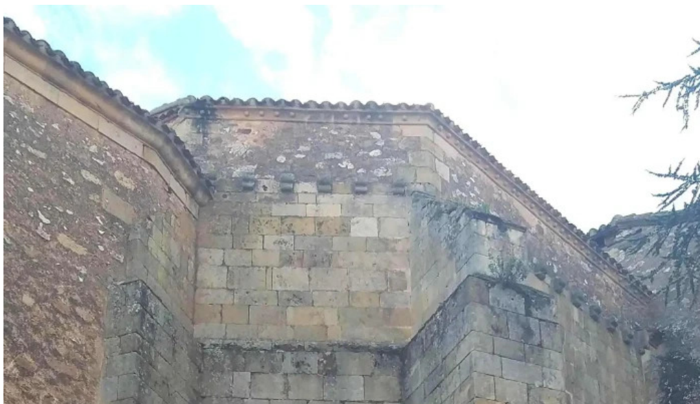
Iglesia de nuestra senora del espino soria