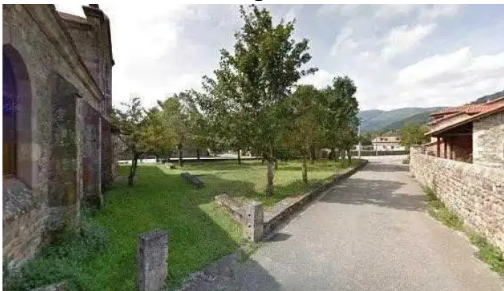
Parroquia de nuestra senora del carmen videos