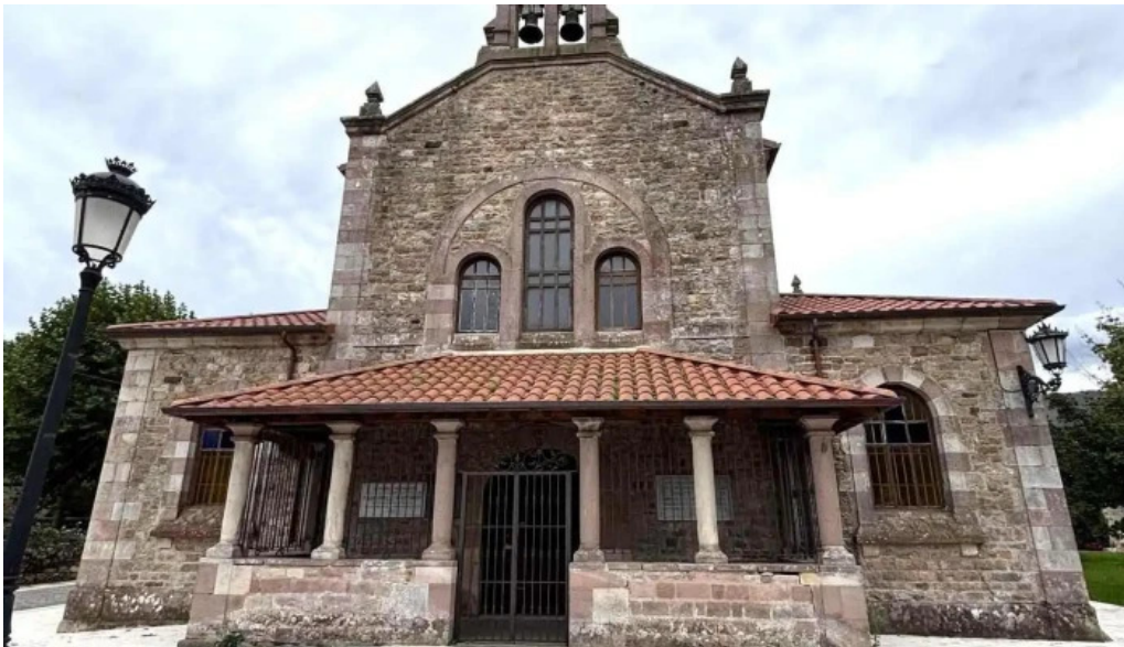
Parroquia de nuestra senora del carmen iglesia catolica