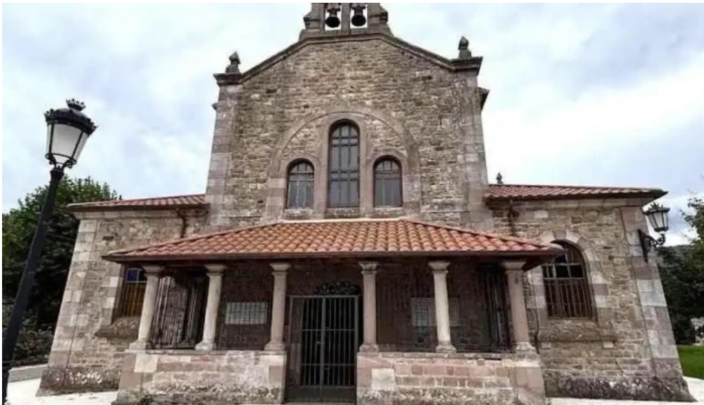
Parroquia de nuestra senora del carmen sopena