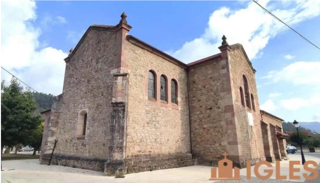
Parroquia de nuestra senora del carmen iglesia