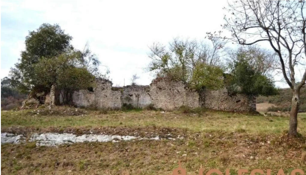
Ruinas de la iglesia de san julian serdio