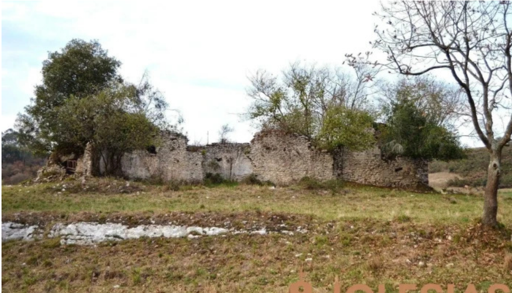
Ruinas de la iglesia de san julian iglesia catolica