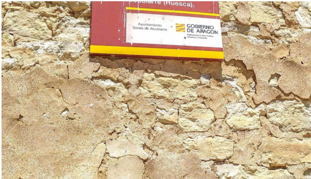
Iglesia de santa maria fotos