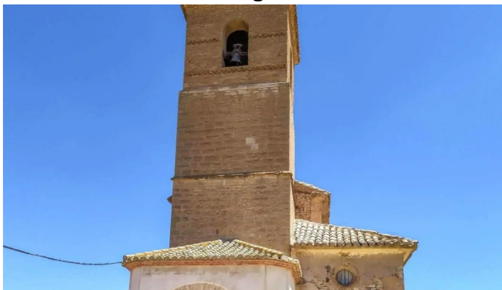
Iglesia de santa maria senes de alcubierre