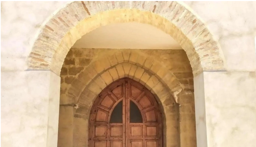
Iglesia de santa maria promocion