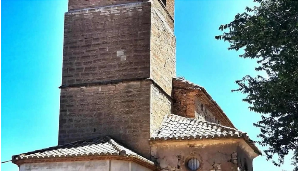
Iglesia de santa maria iglesia catolica