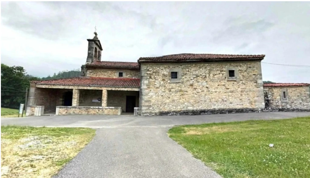
Iglesia de san pedro abierto ahora