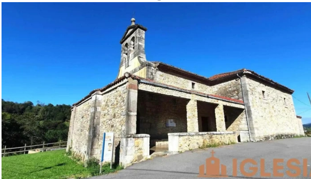
Iglesia de san pedro sebares