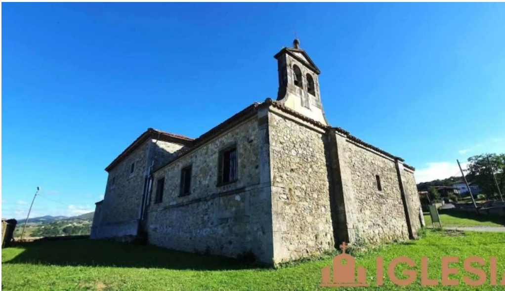
Iglesia de san pedro iglesia