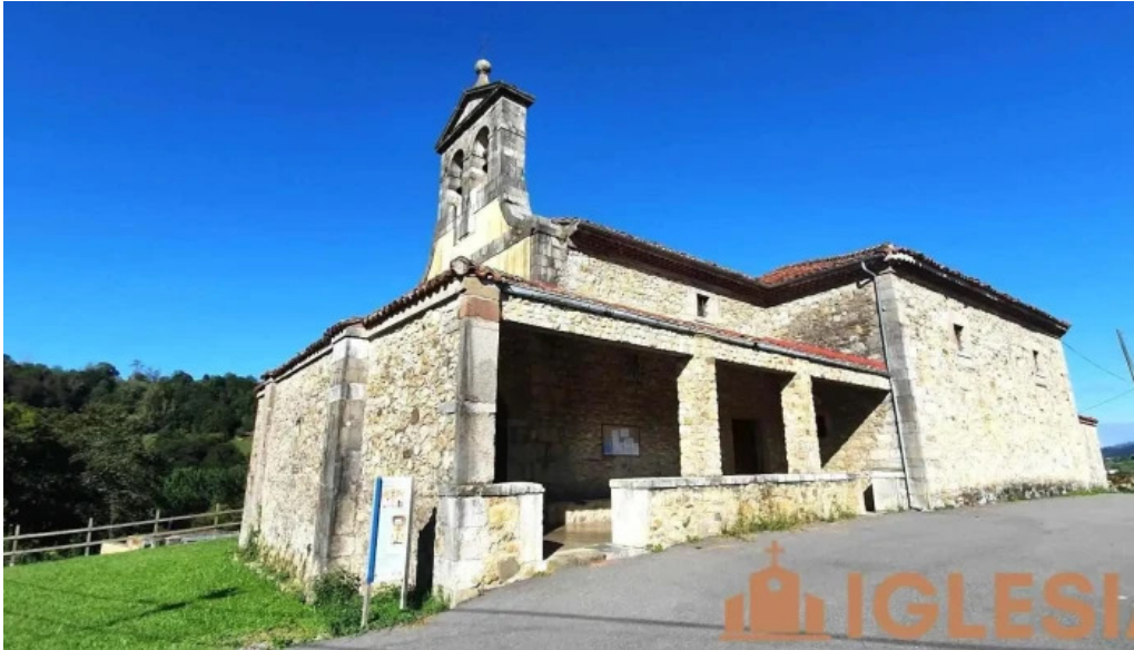
Iglesia de san pedro iglesia catolica