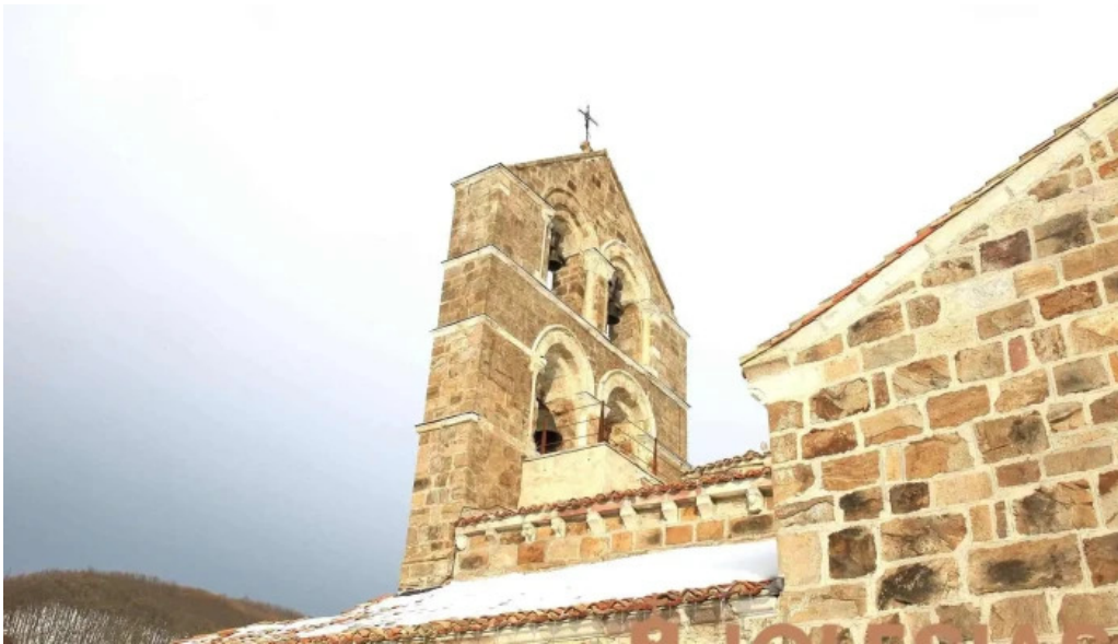
Iglesia de la asuncion iglesia catolica