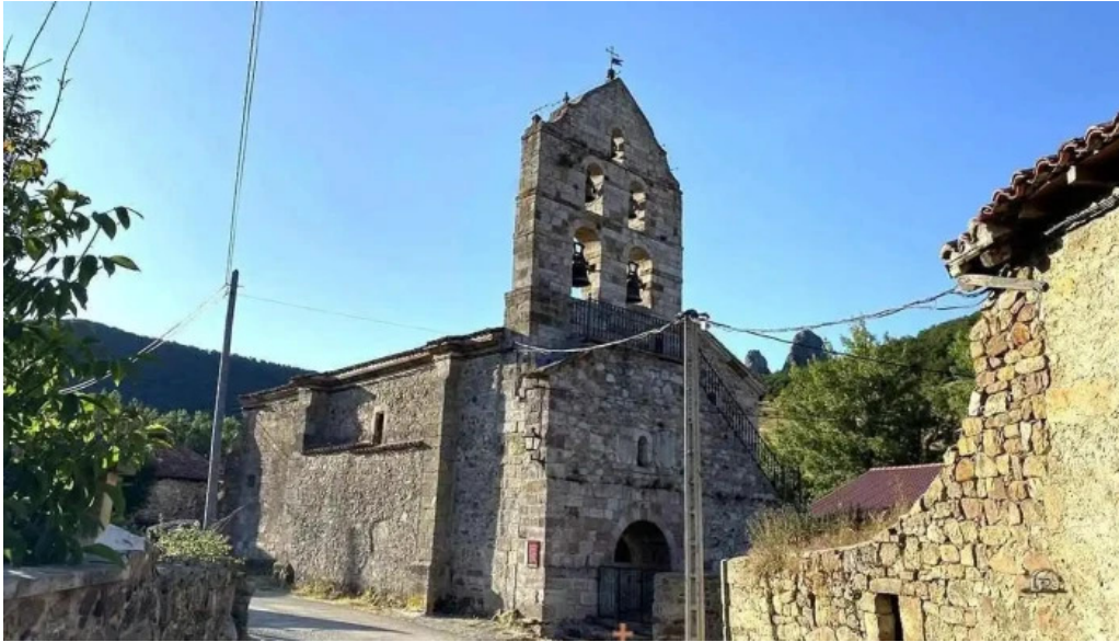
Iglesia de la asuncion iglesia