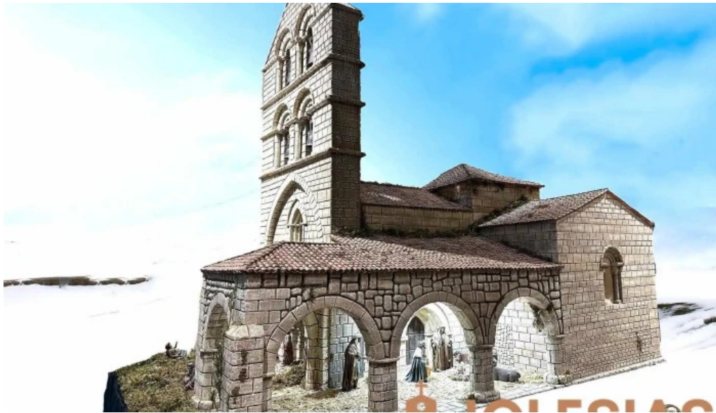
Iglesia de la asuncion san salvador de cantamuda