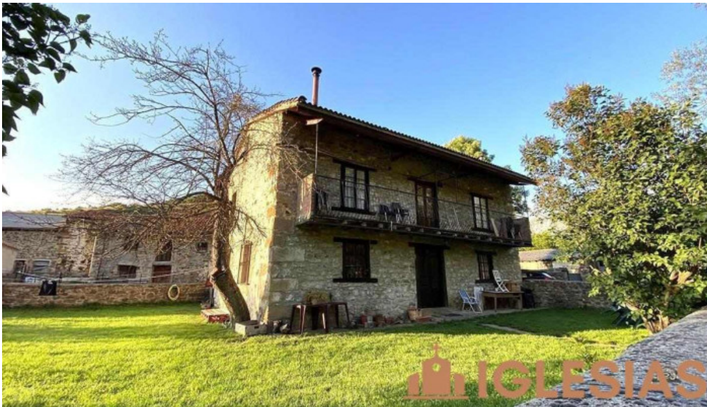
Iglesia de la asuncion casa rural el guaje