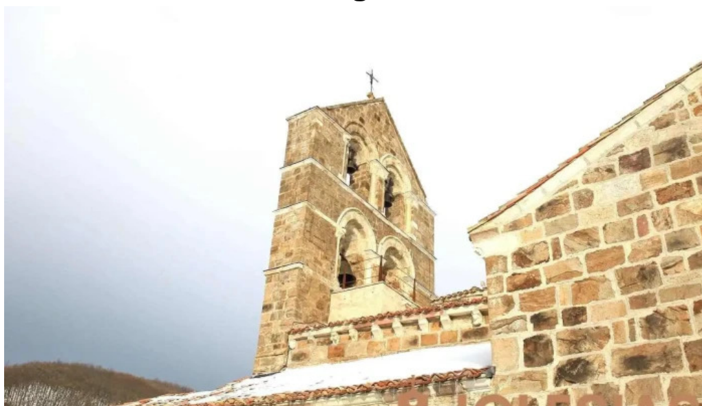
Iglesia de la asuncion santa maria de redondo