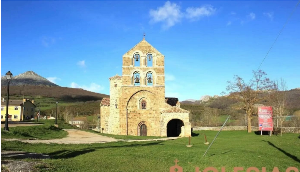
Iglesia de la asuncion colegiata de san salvador de cantamuda