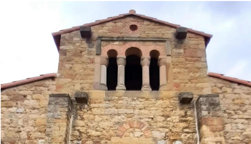
Iglesia de santa maria de bendones videos