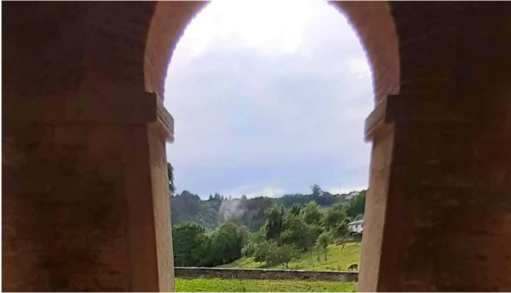
Iglesia de santa maria de bendones santa maria de bendones