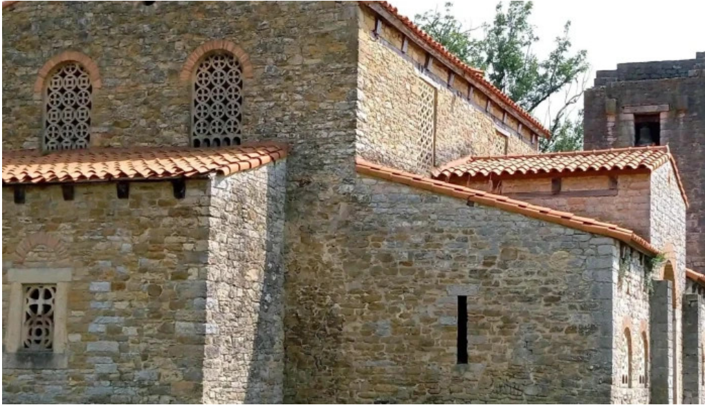
Iglesia de santa maria de bendones zona