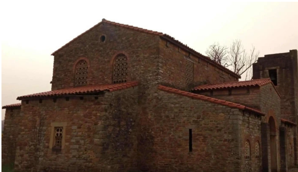
Iglesia de santa maria de bendones instagram