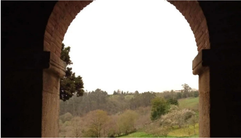
Iglesia de santa maria de bendones fotos