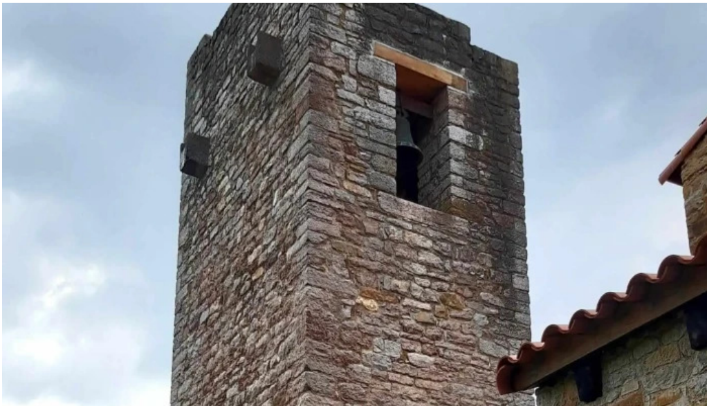
Iglesia de santa maria de bendones telefono