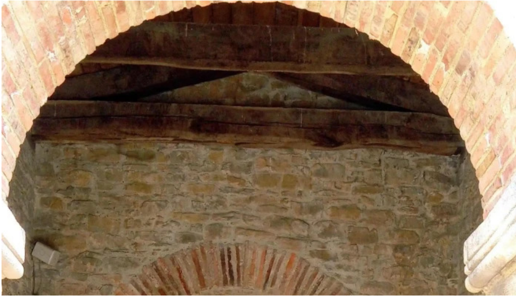
Iglesia de santa maria de bendones ubicacion