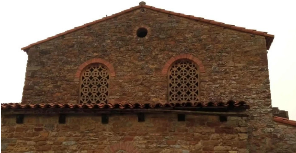
Iglesia de santa maria de bendones numero