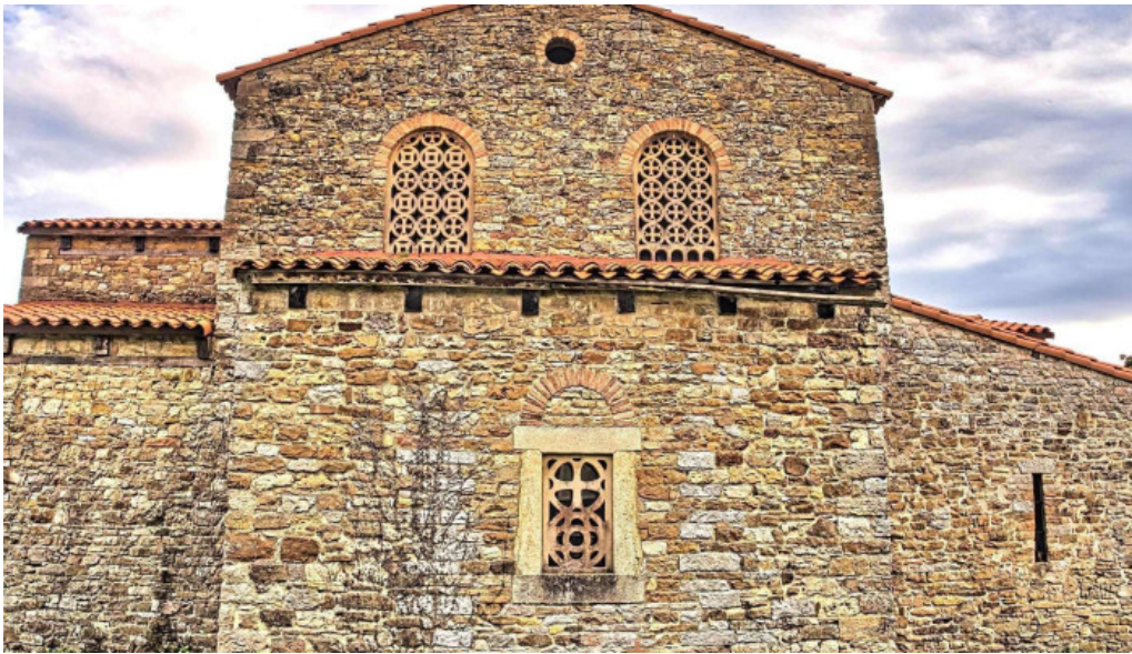
Iglesia de santa maria de bendones iglesia