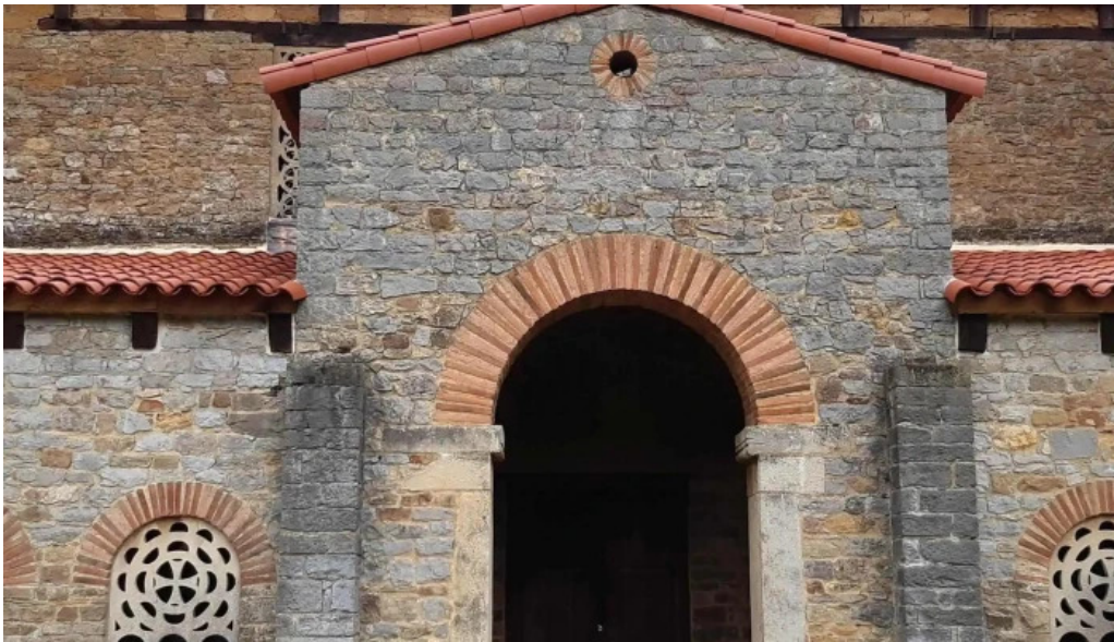
Iglesia de santa maria de bendones direccion