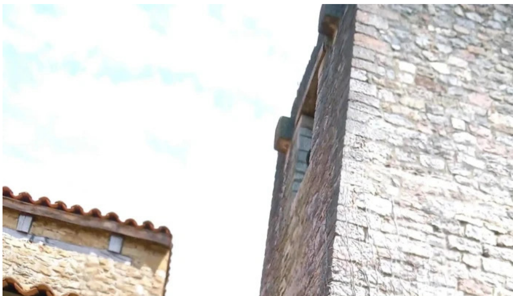
Iglesia de santa maria de bendones descuentos