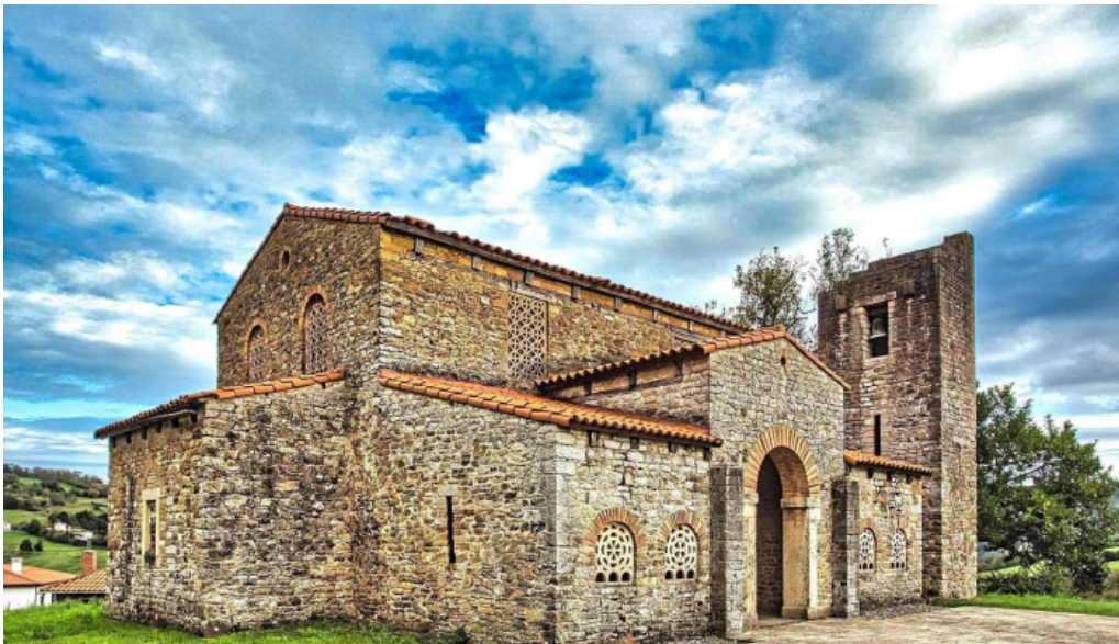
Iglesia de santa maria de bendones iglesia catolica