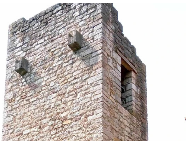
Iglesia de santa maria de bendones abierto ahora