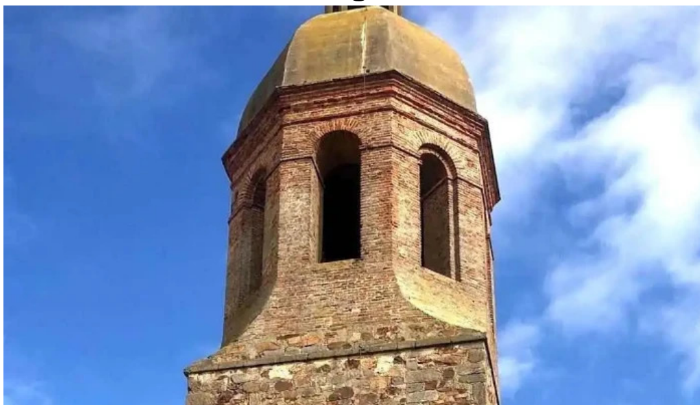
Iglesia de santa cristina santa cristina de la polvorosa