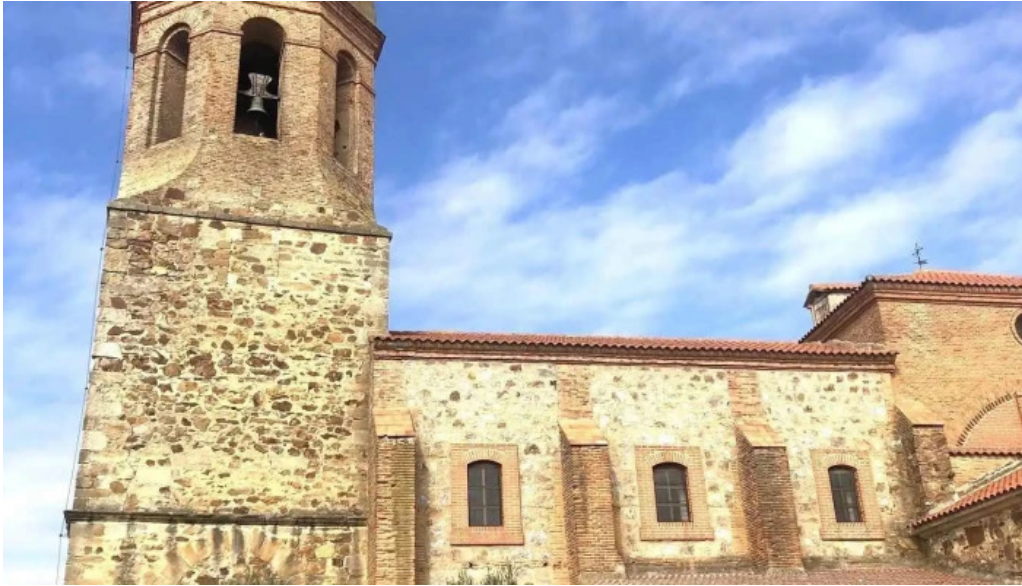
Iglesia de santa cristina iglesia