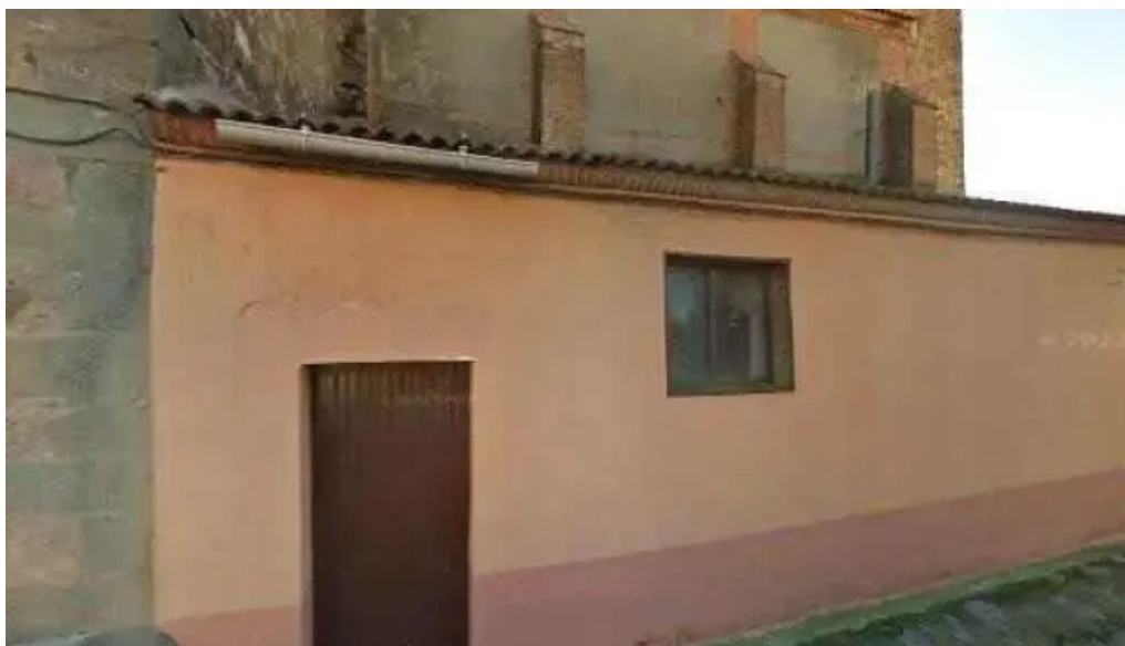
Iglesia de santa cristina horario