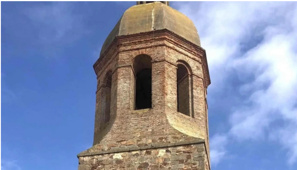
Iglesia de santa cristina iglesia catolica