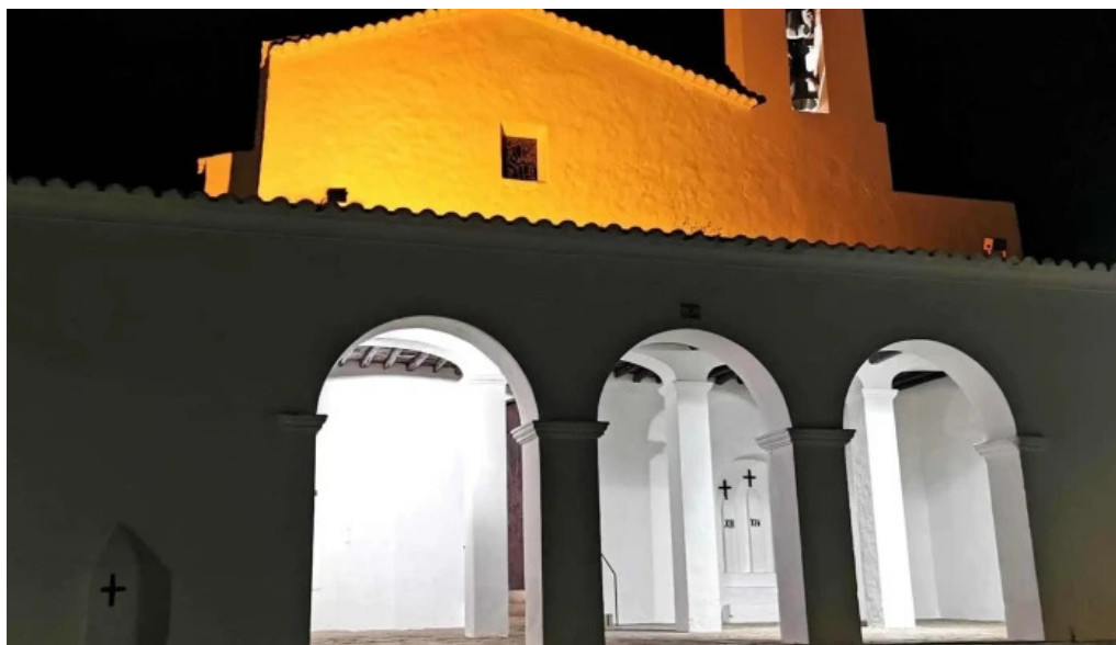
Esglesia de sant mateu dalbarca promocion