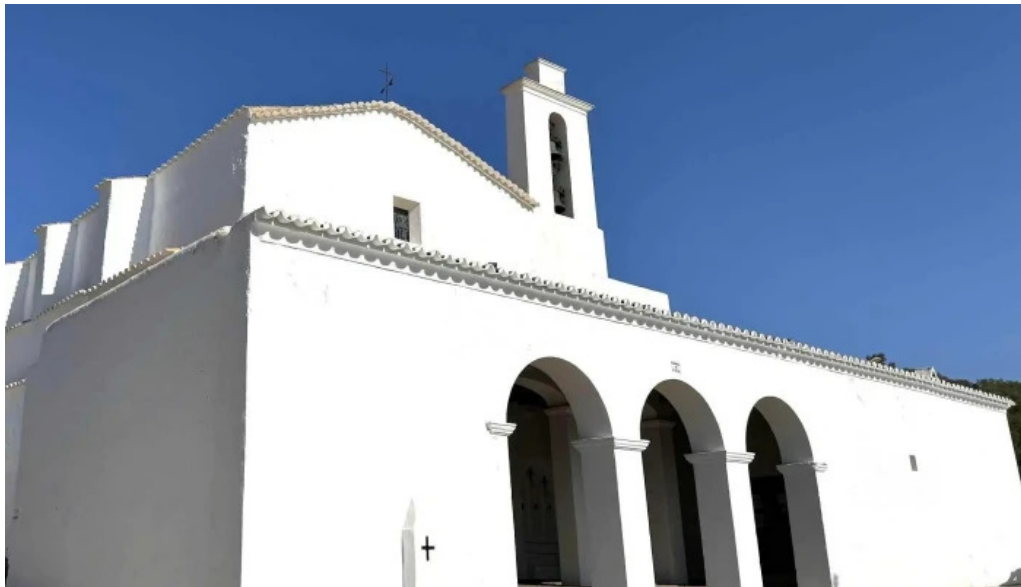
Esglesia de sant mateu dalbarca sant mateu d albarca