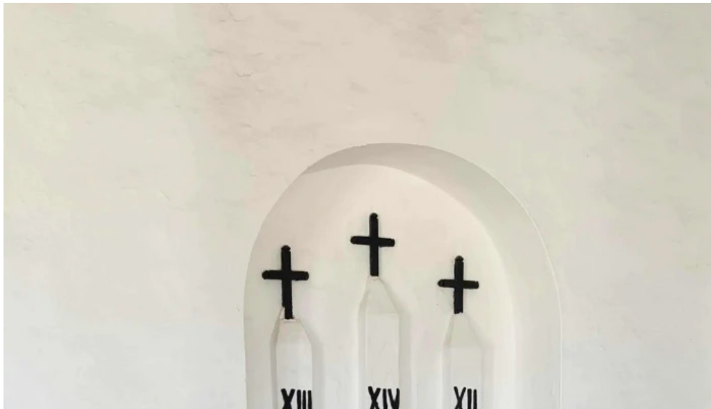
Esglesia de sant mateu dalbarca opiniones