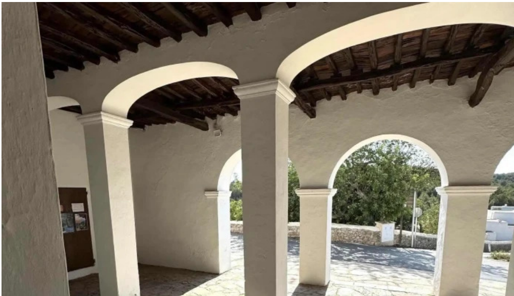
Esglesia de sant mateu dalbarca zona