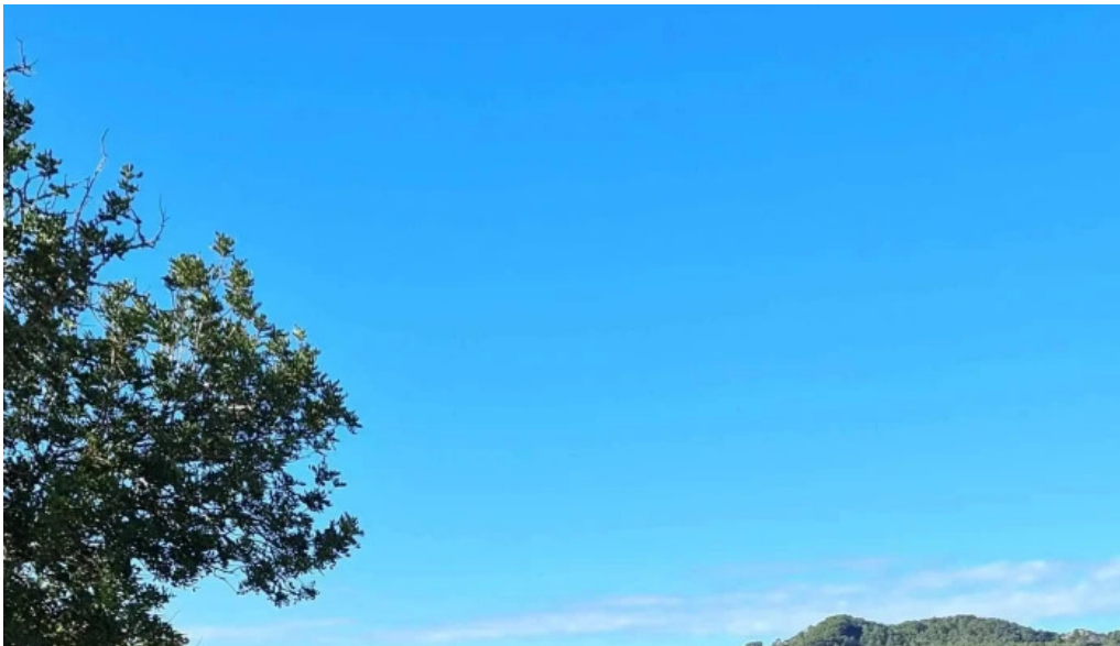
Esglesia de sant mateu dalbarca cerca de mi