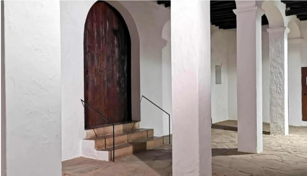
Esglesia de sant mateu dalbarca catalogo