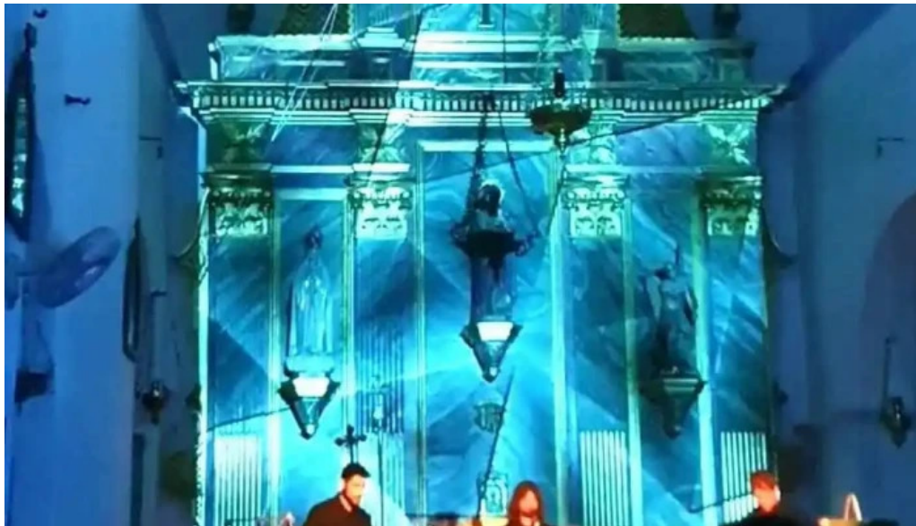
Esglesia de sant mateu dalbarca recientes