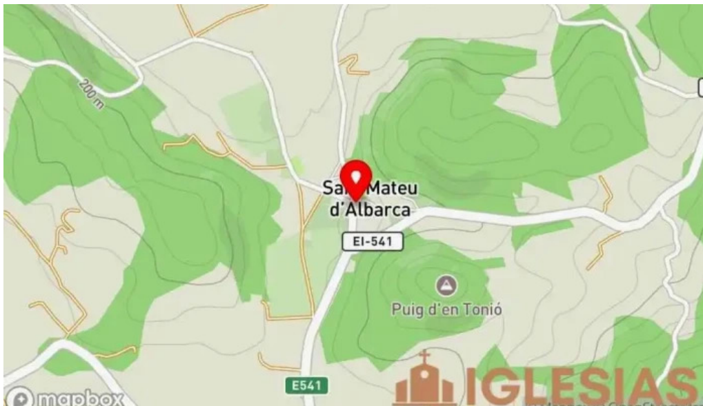
Esglesia de sant mateu dalbarca mapa