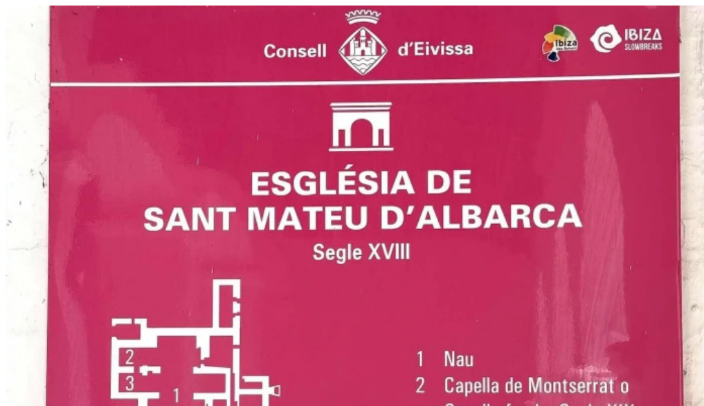
Esglesia de sant mateu dalbarca puntaje