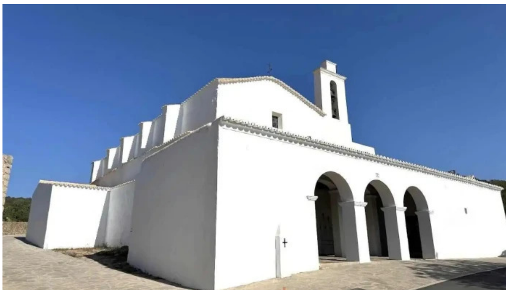
Església de sant mateu d albarca sant mateu d albarca