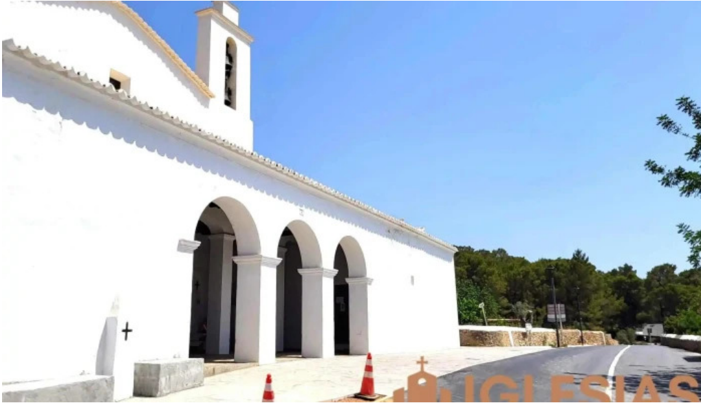
Esglesia de sant mateu dalbarca iglesia