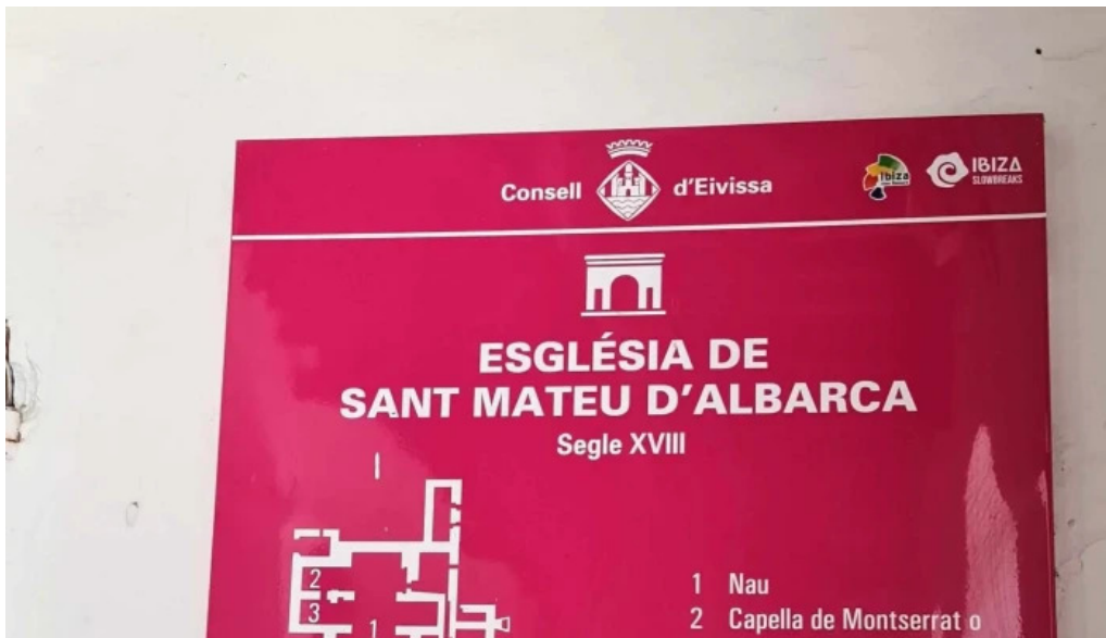
Esglesia de sant mateu dalbarca comentarios