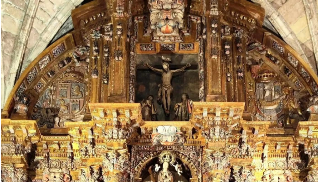
Parroquia de san pedro apostol abierto ahora