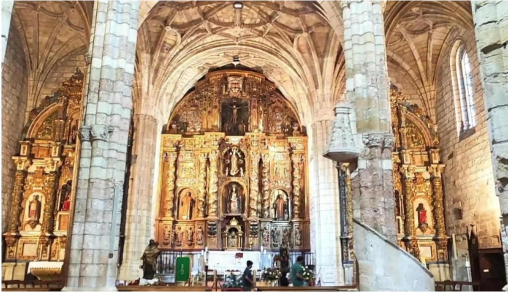
Parroquia de san pedro apostol san vicente de la barquera