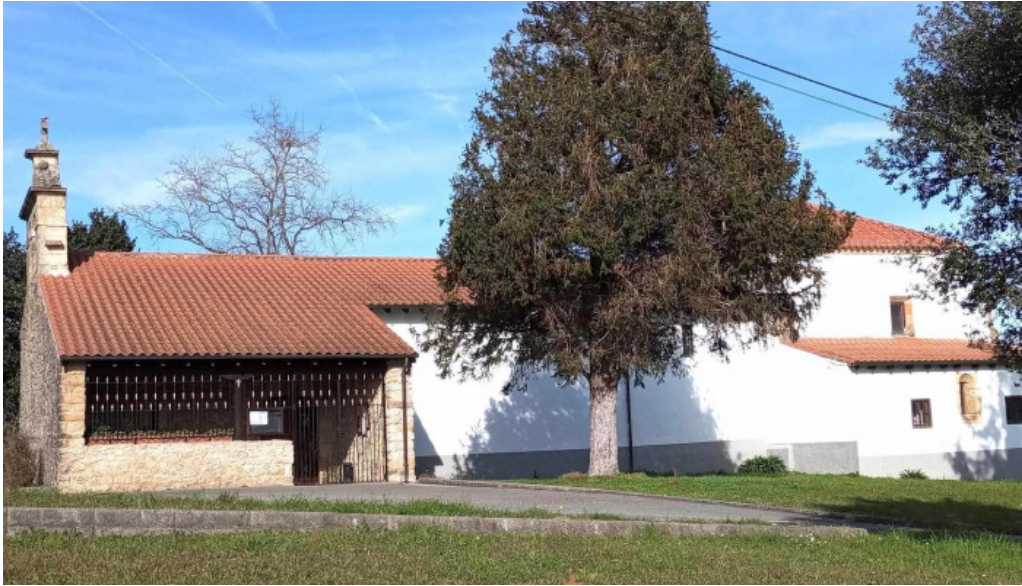
Parroquia de san pedro apostol iglesia