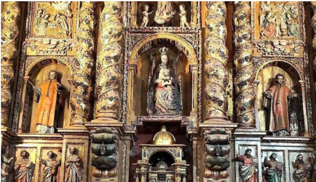
Parroquia de san pedro apostol iglesia catolica