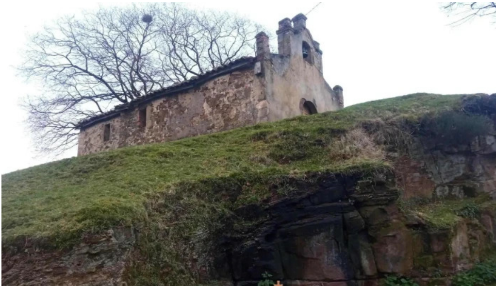
Ermita de san tiso iglesia catolica