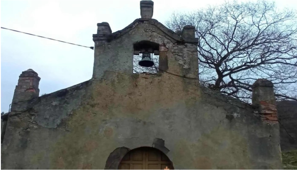
Ermita de san tiso iglesia