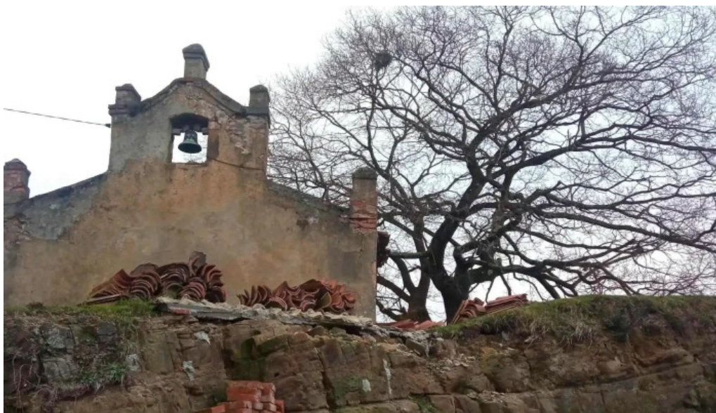
Ermita de san tiso descuentos