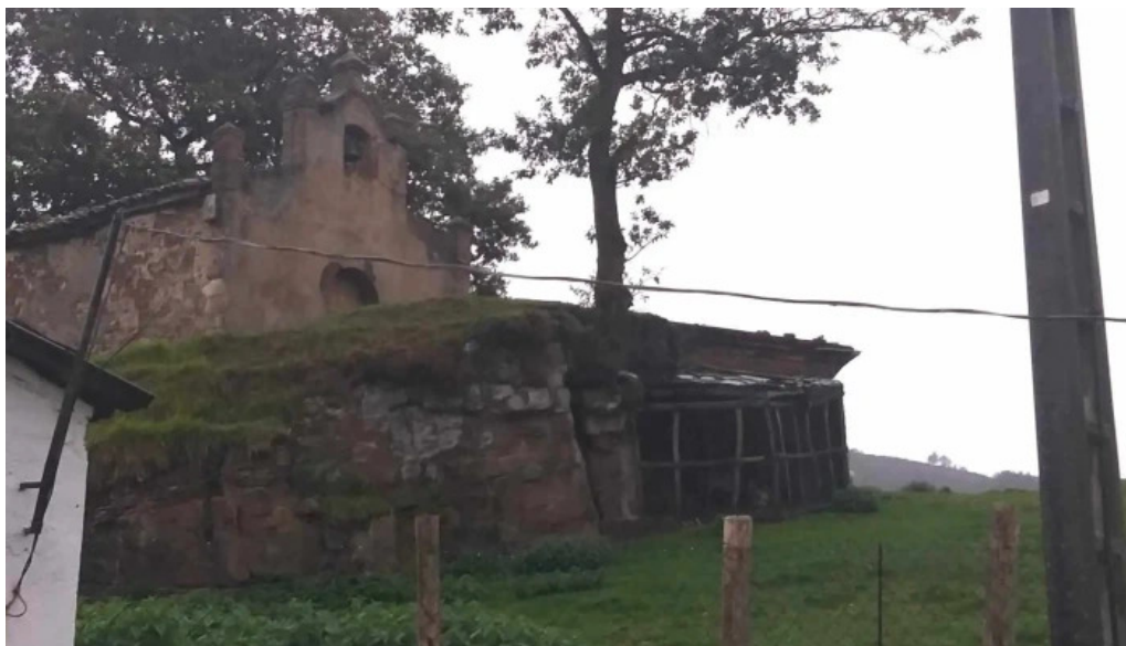
Ermita de san tiso telefono