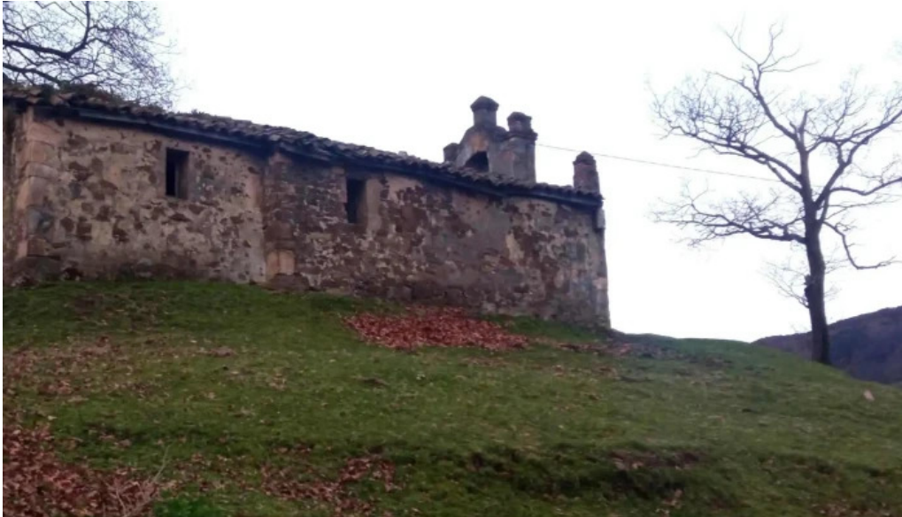
Ermita de san tiso san tirso