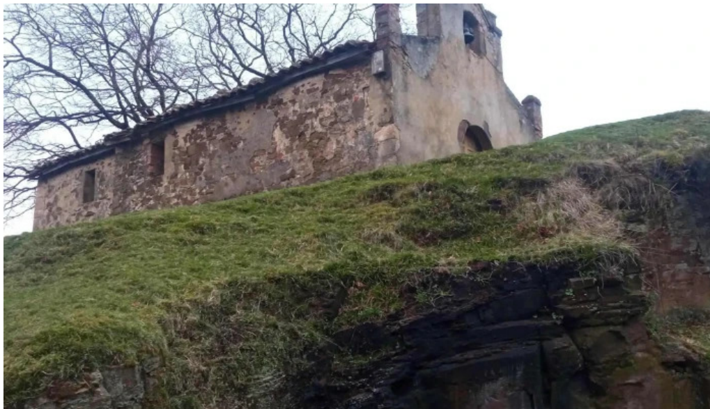
Ermita de san tiso zona