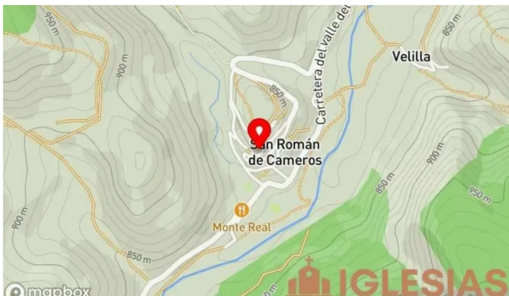
Iglesia de nuestra senora de la asuncion mapa