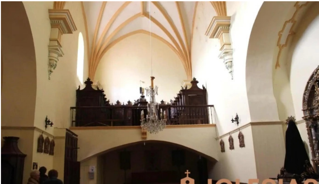
Iglesia de nuestra senora de la asuncion iglesia catolica