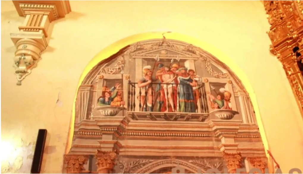
Iglesia de nuestra senora de la asuncion iglesia