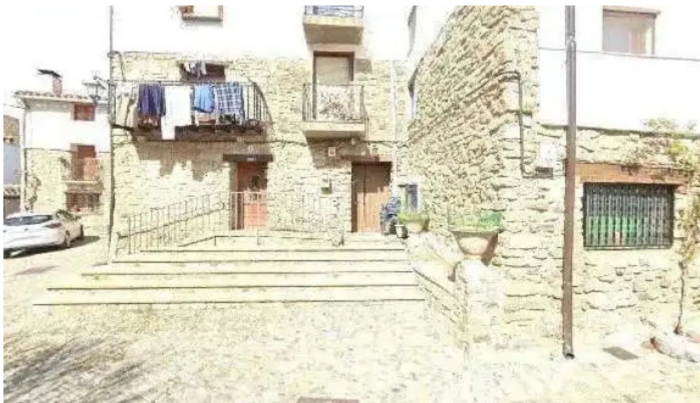
Iglesia de nuestra senora de la asuncion horario