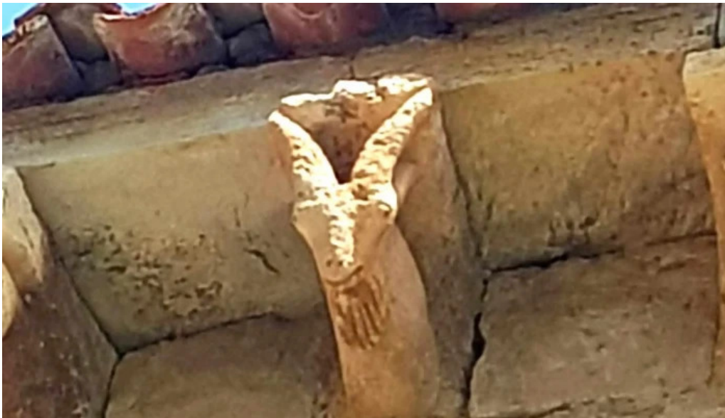
Colegiata de san martin de elines como llegar