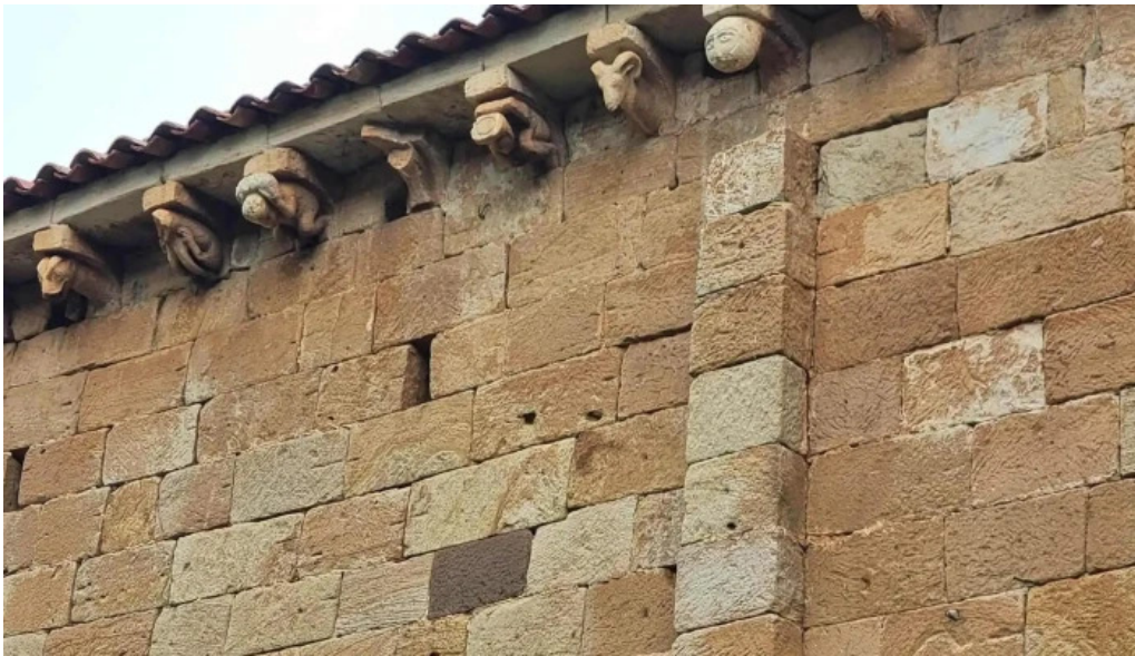
Colegiata de san martin de elines instagram