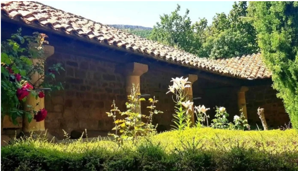
Colegiata de san martin de elines telefono