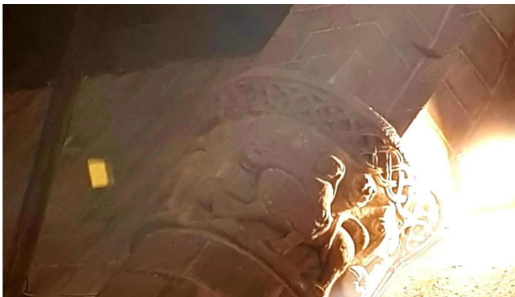
Colegiata de san martin de elines abierto ahora