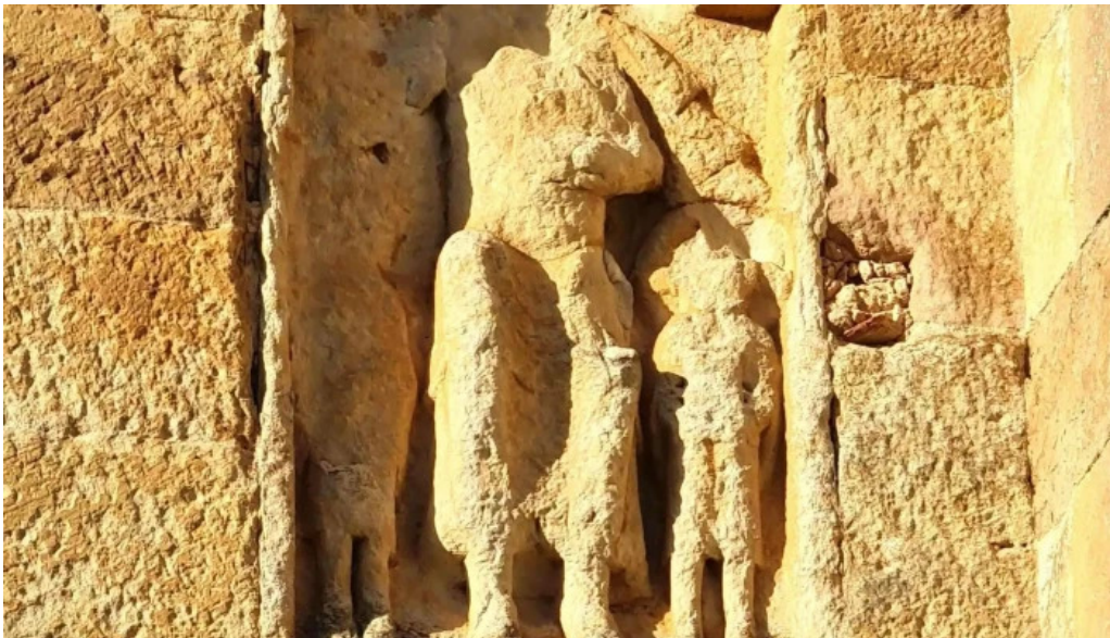
Colegiata de san martin de elines direccion