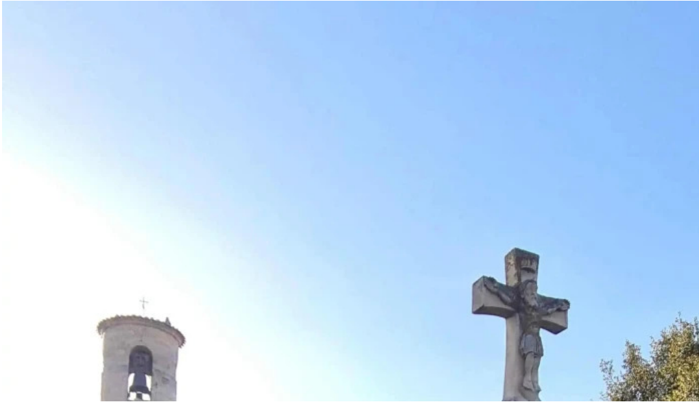
Colegiata de san martin de elines descuertos