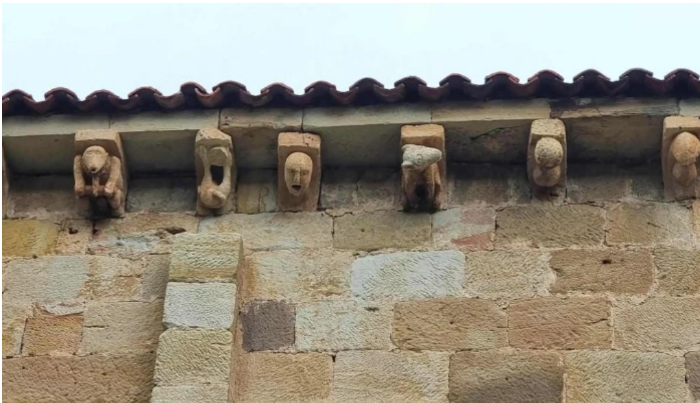
Colegiata de san martin de elines numero