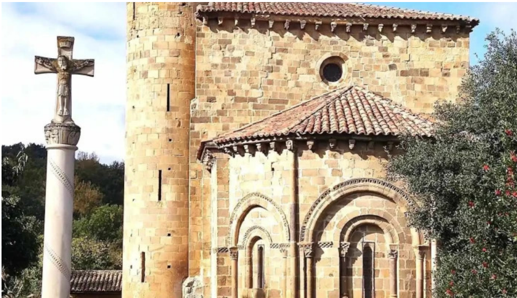
Colegiata de san martin de elines iglesia catolica