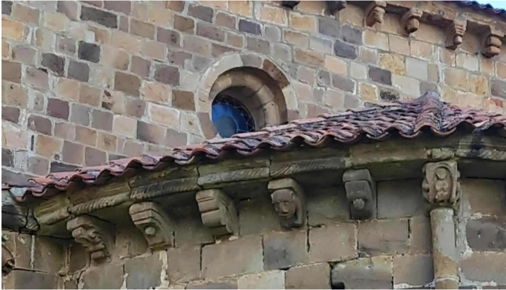
Colegiata de san martin de elines ubicacion