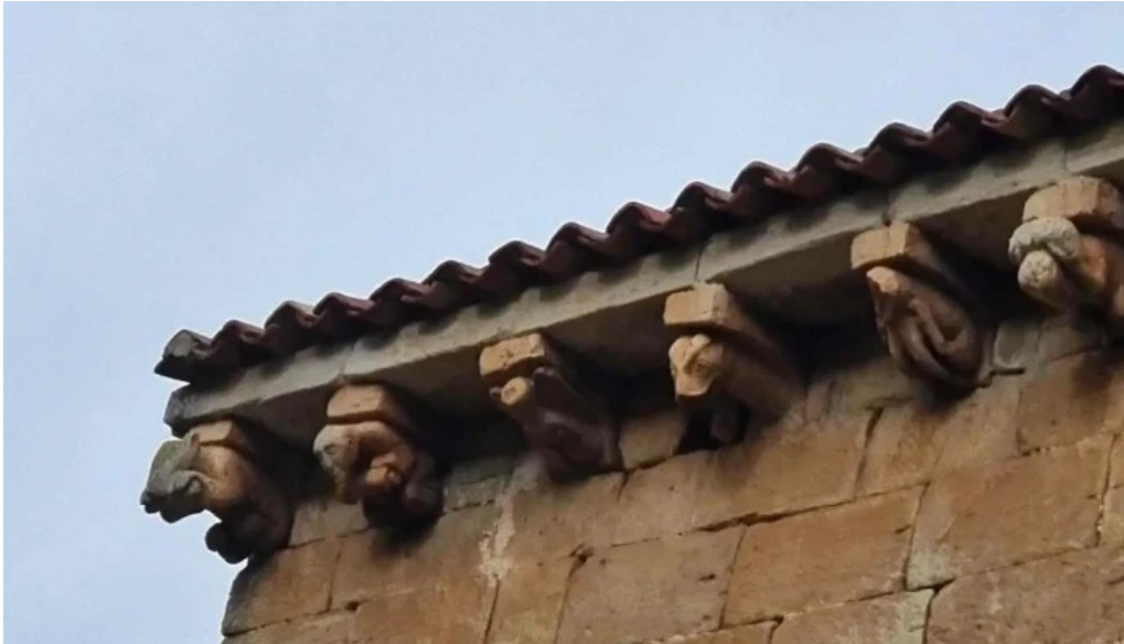
Colegiata de san martin de elines san martin de elines