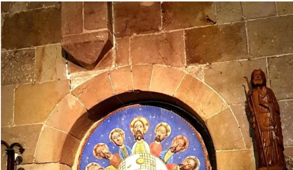
Colegiata de san martin de elines videos