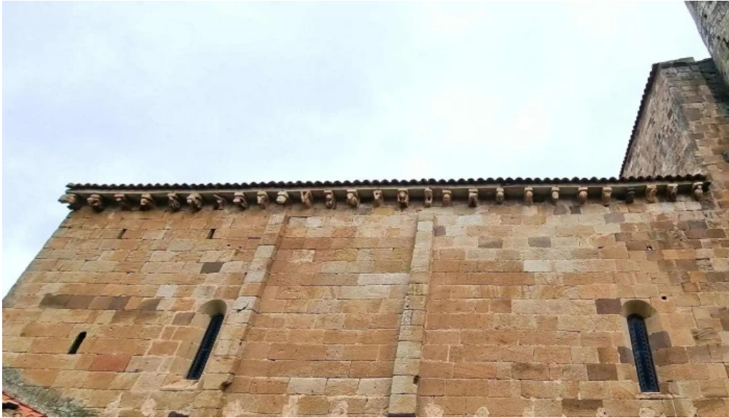
Colegiata de san martin de elines fotos