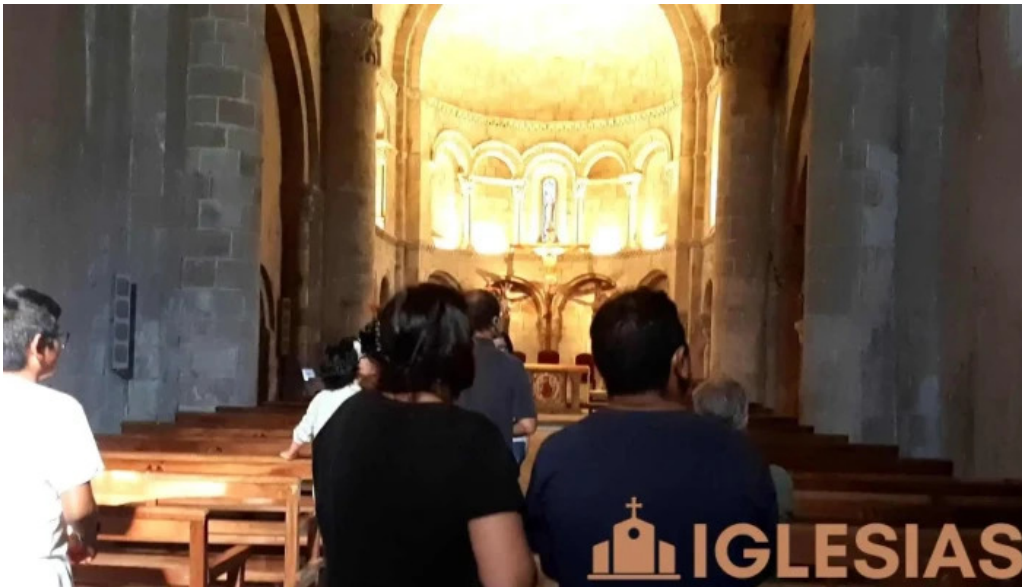
Colegiata de san martin de elines iglesia