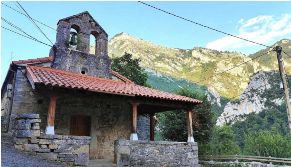
Iglesia de san ignacio de ponga iglesia