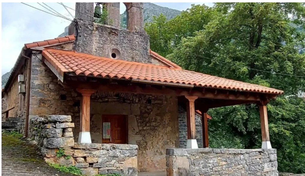
Iglesia de san ignacio de ponga san ignacio