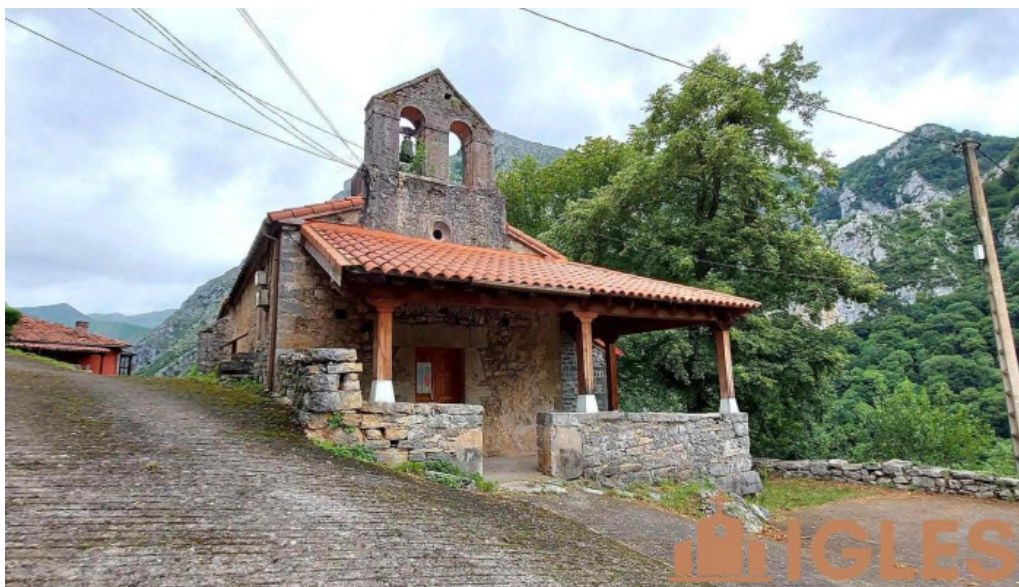
Iglesia de san ignacio de ponga iglesia catolica