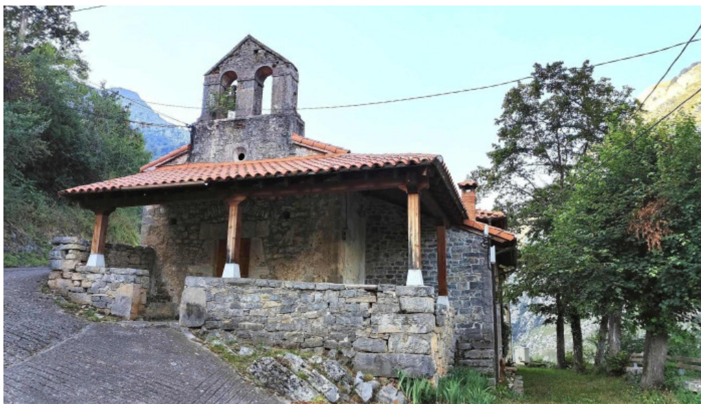
Iglesia de san ignacio de ponga casielles