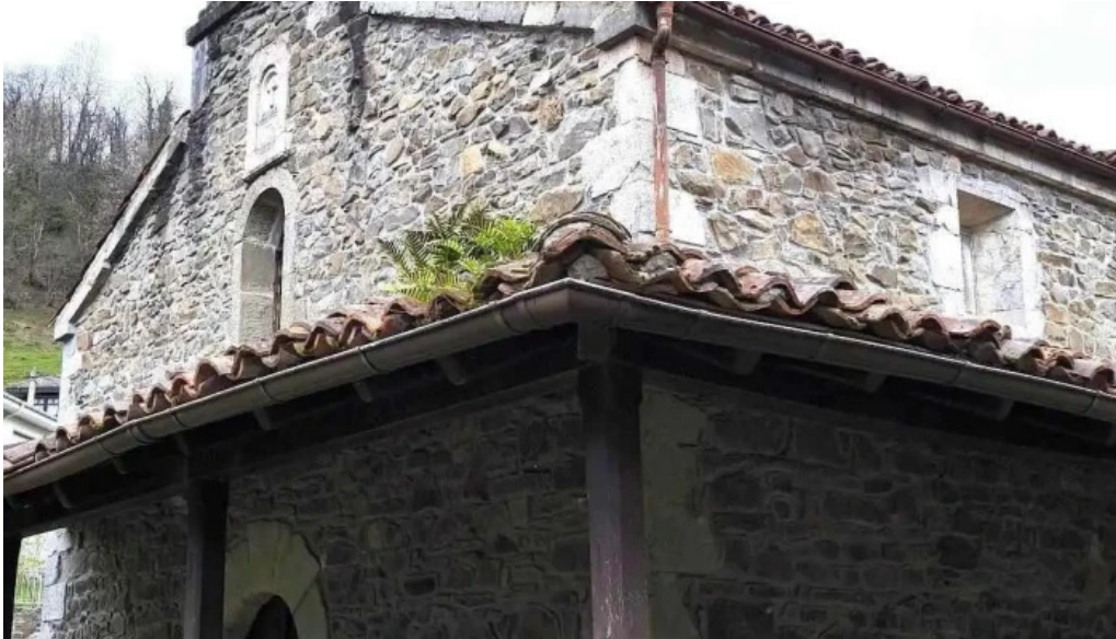
Iglesia de santa maria iglesia catolica