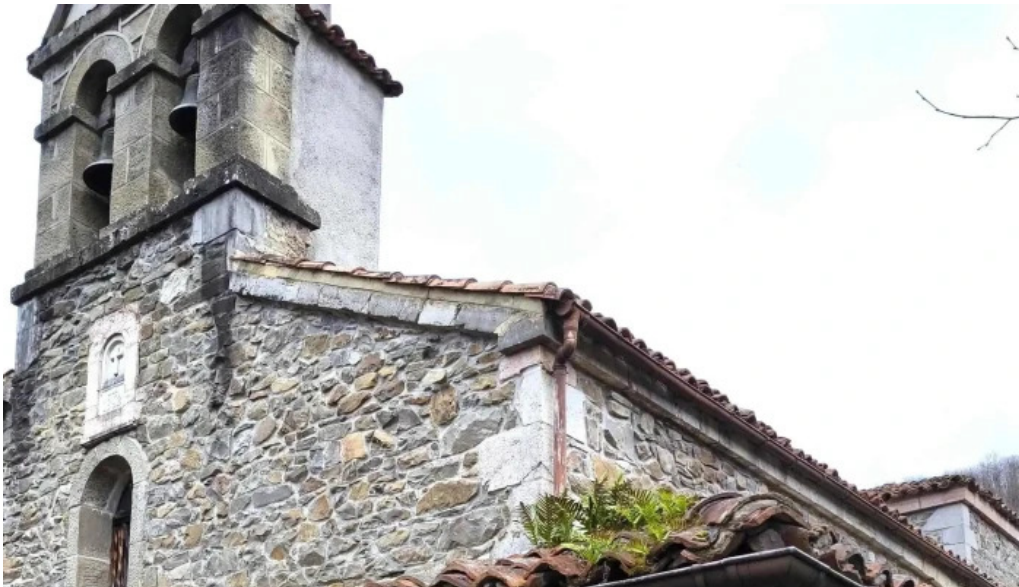
Iglesia de santa maria direccion