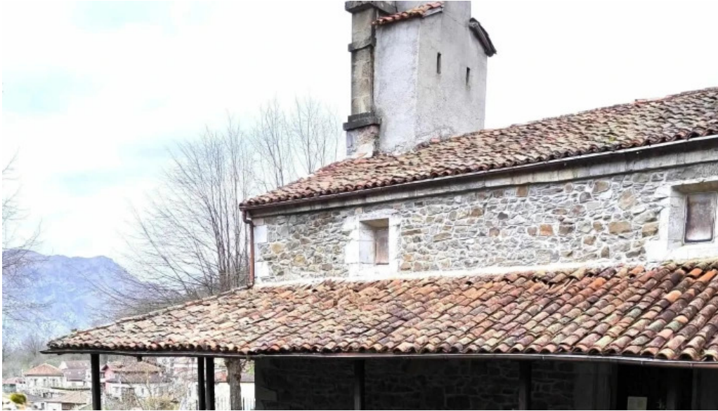
Iglesia de santa maria s juan de beleno