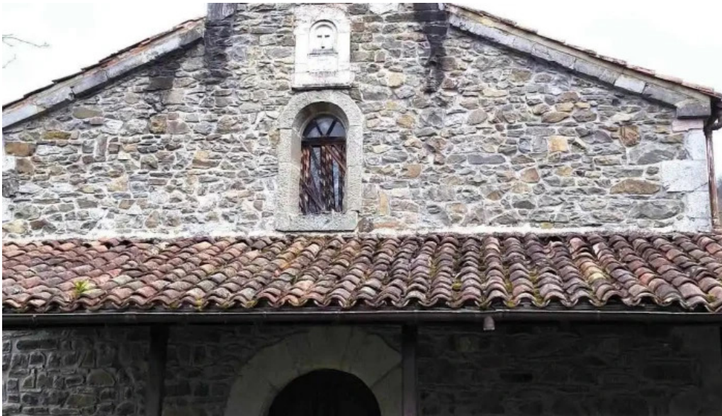
Iglesia de santa maria iglesia