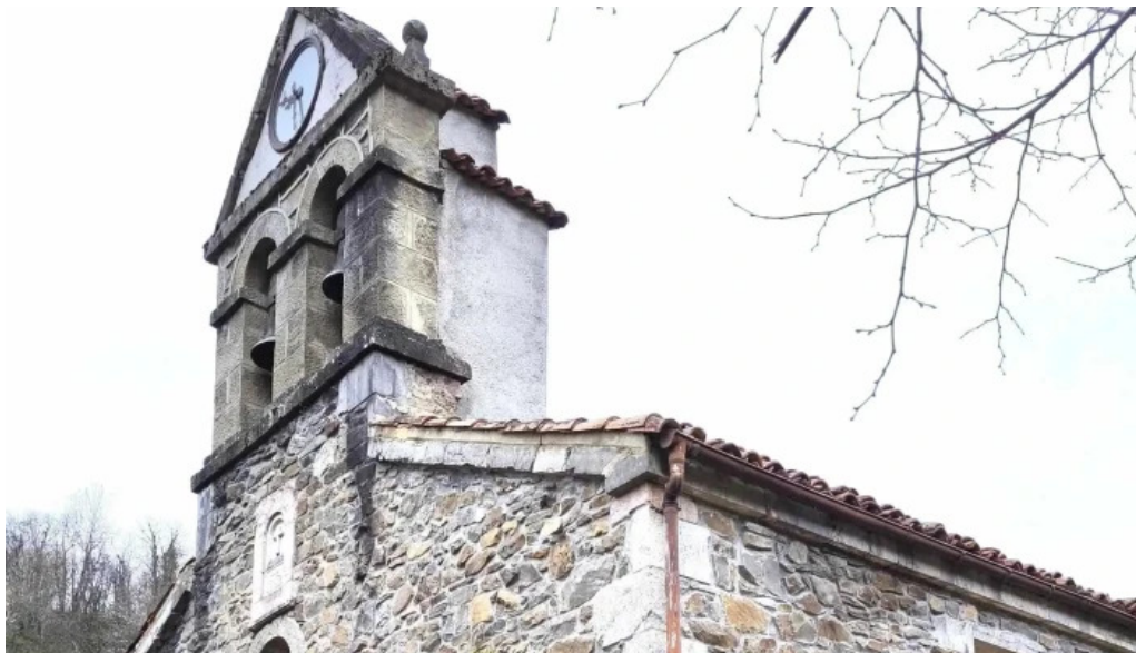
Iglesia de santa maria zona