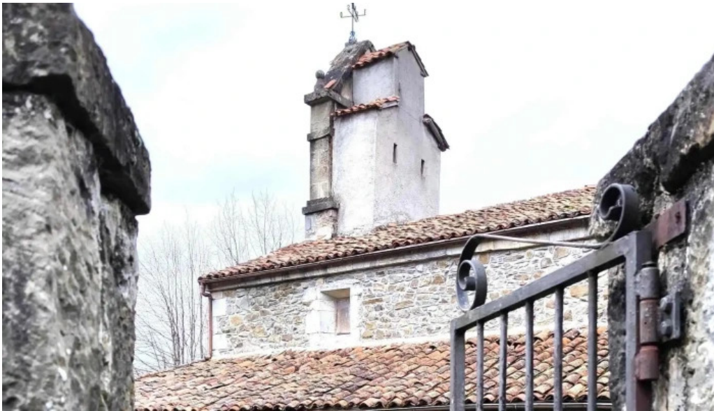
Iglesia de santa maria numero