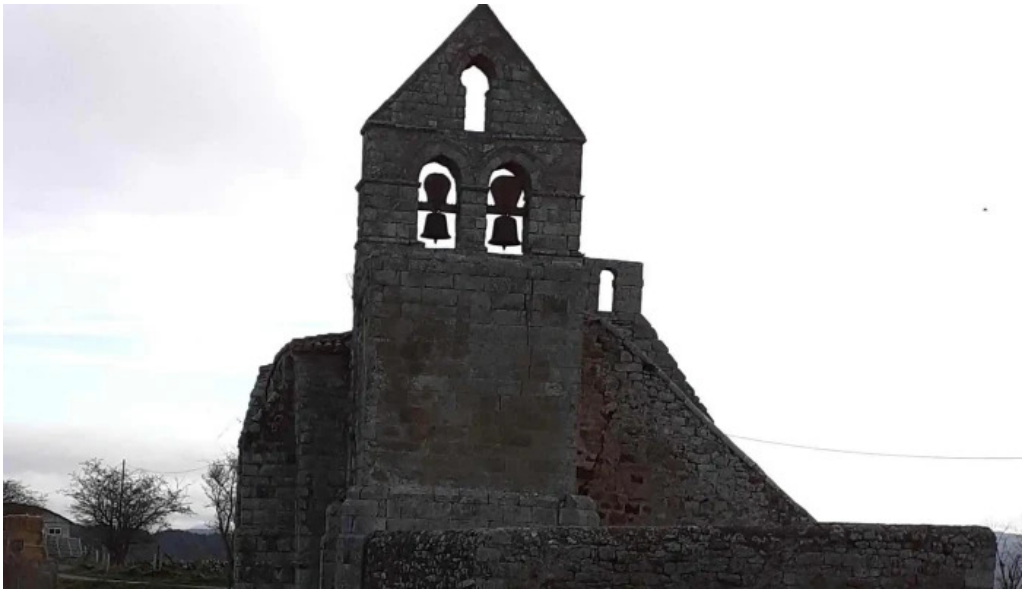
Iglesia de santa maria como llegar