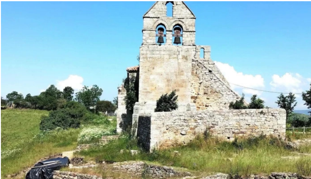
Iglesia de santa maria abierto ahora