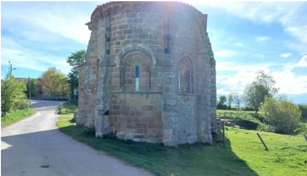
Iglesia de santa maria iglesia catolica