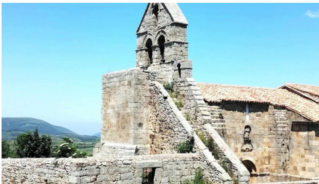
Iglesia de santa maria telefono