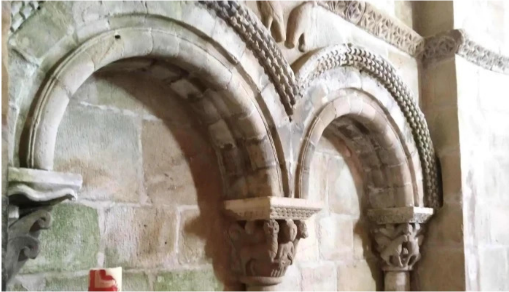
Iglesia de santa maria retortillo