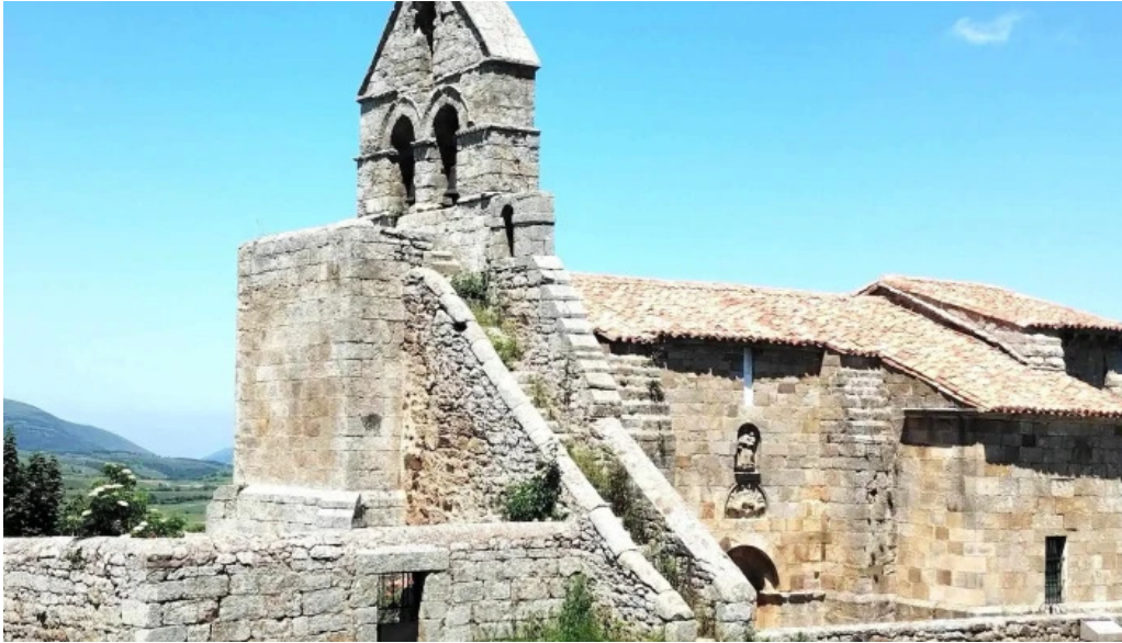
Iglesia de santa maria precios