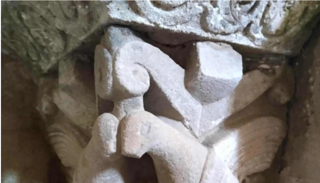
Iglesia de santa maria catalogo