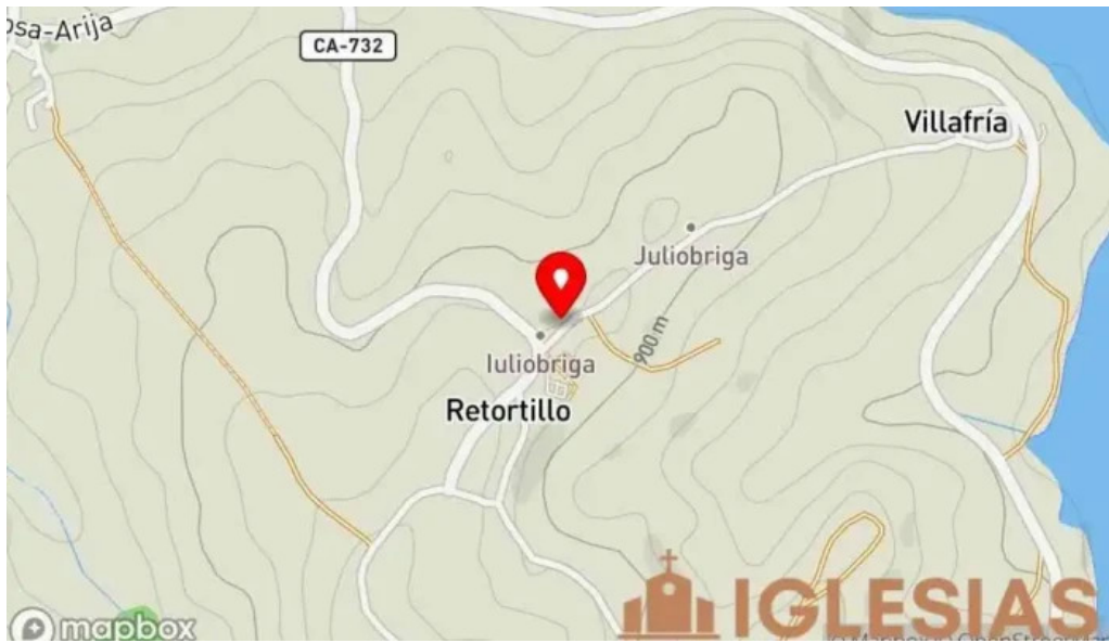
Iglesia de santa maria mapa