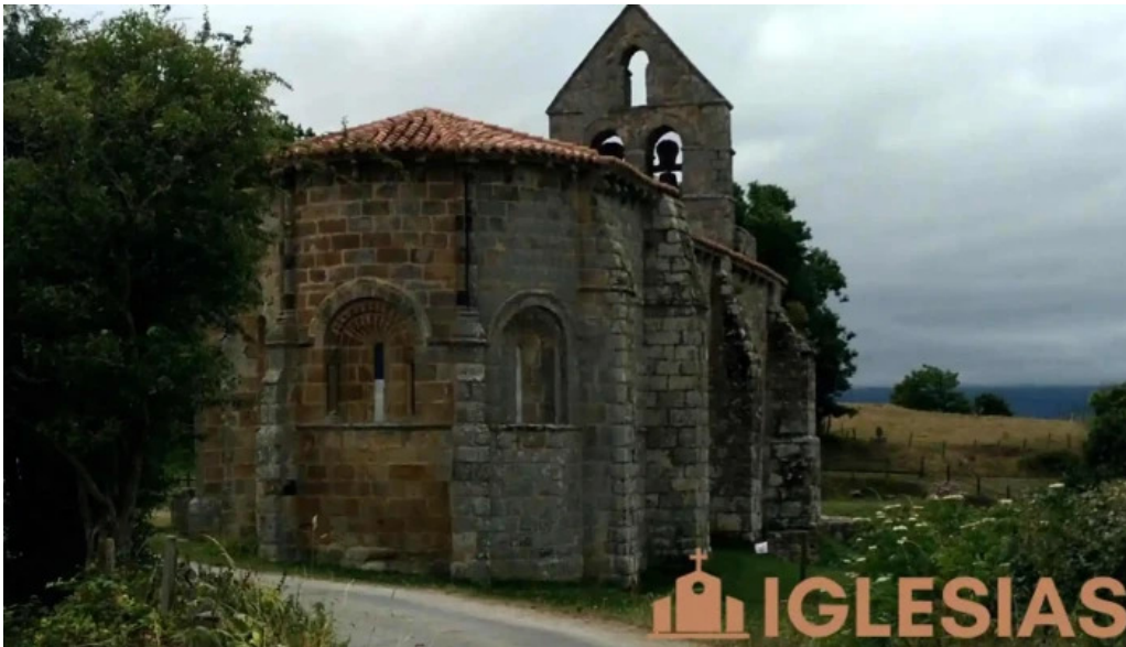
Iglesia de santa maria iglesia