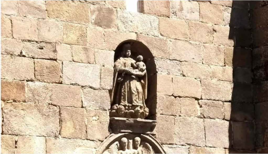
Iglesia de santa maria descuentos