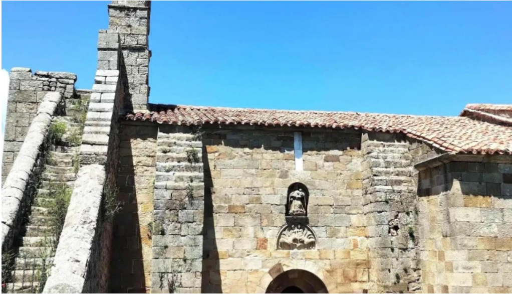
Iglesia de santa maria donde