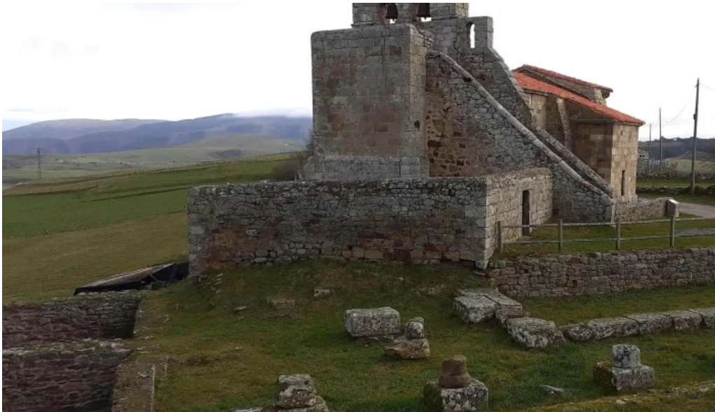
Iglesia de santa maria direccion