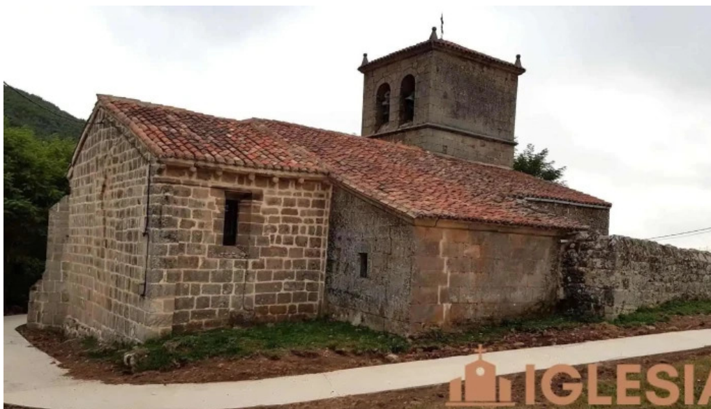
Iglesia de san martin iglesia