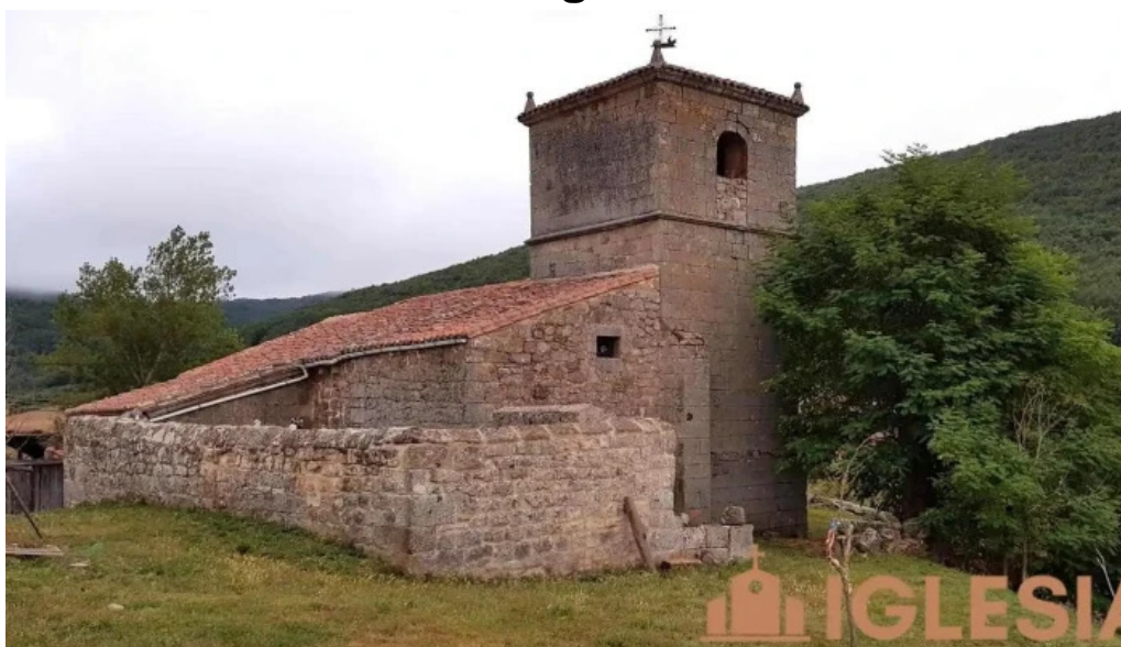
Iglesia de san martin quintanas de hormiguera