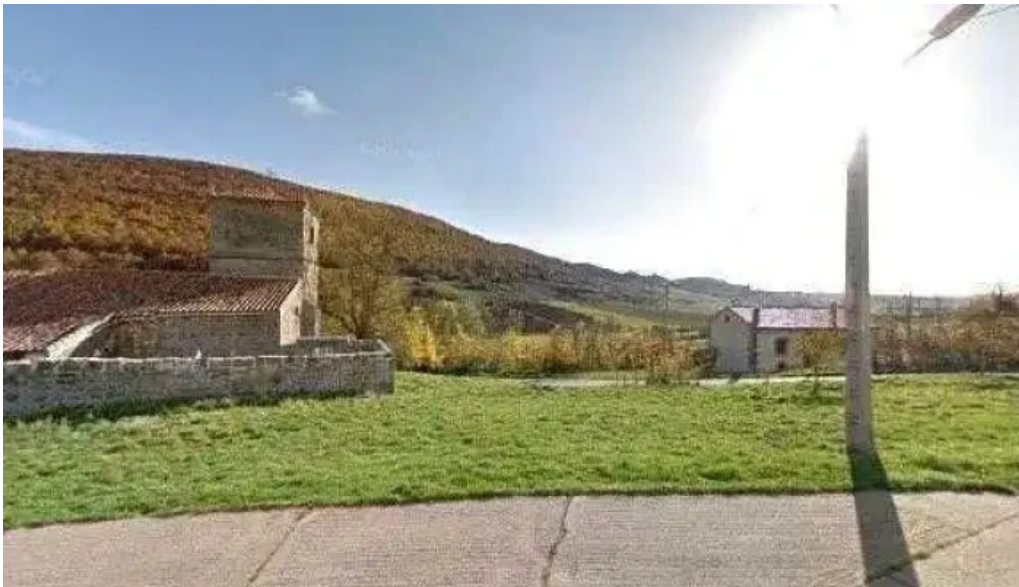
Iglesia de san martin precios