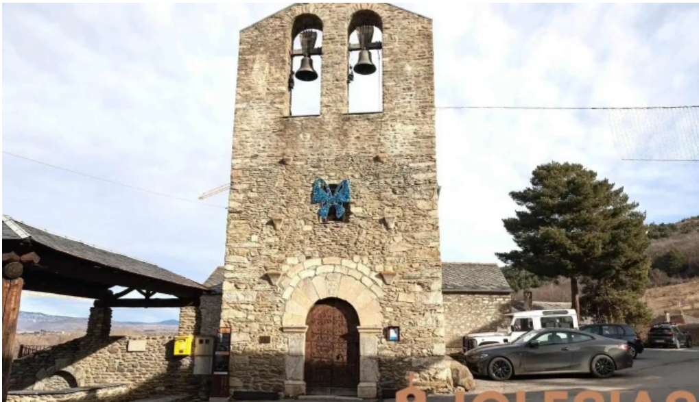
Iglesia san cosme y san damia de queixans iglesia catolica