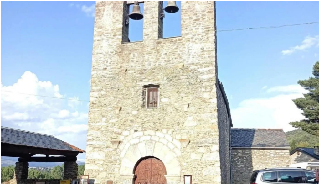
Iglesia san cosme y san damia de queixans queixans