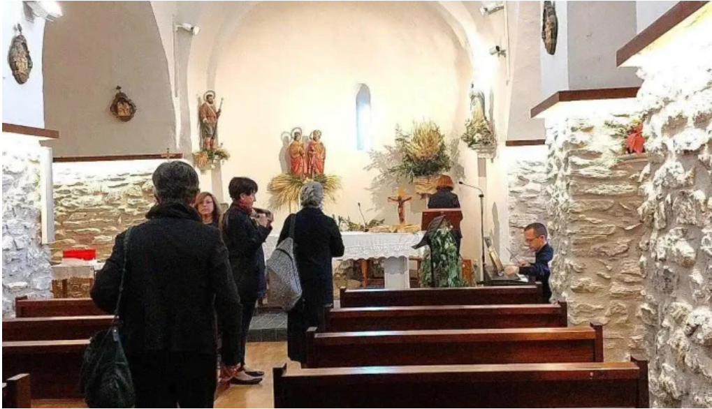
Iglesia san cosme y san damia de queixans iglesia