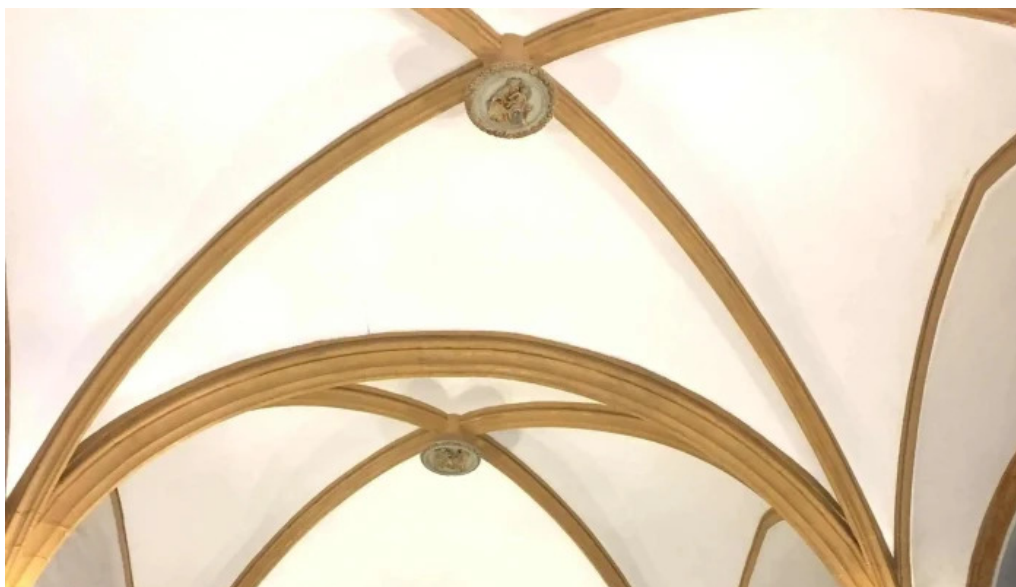
Iglesia de los santos juanes abierto ahora