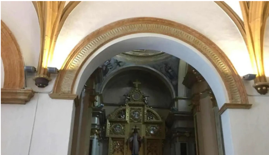
Iglesia de los santos juanes iglesia