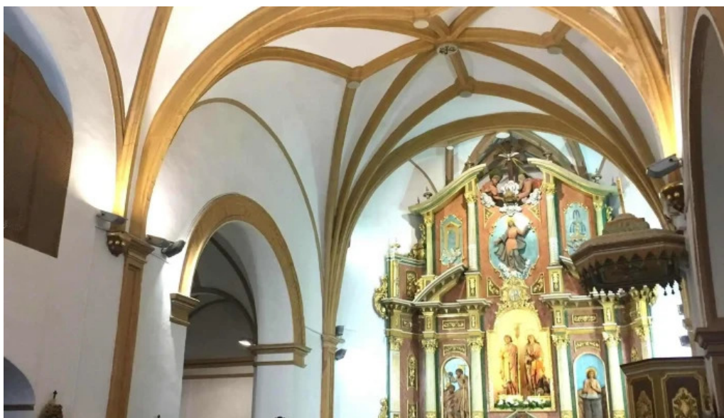
Iglesia de los santos juanes quatretonda