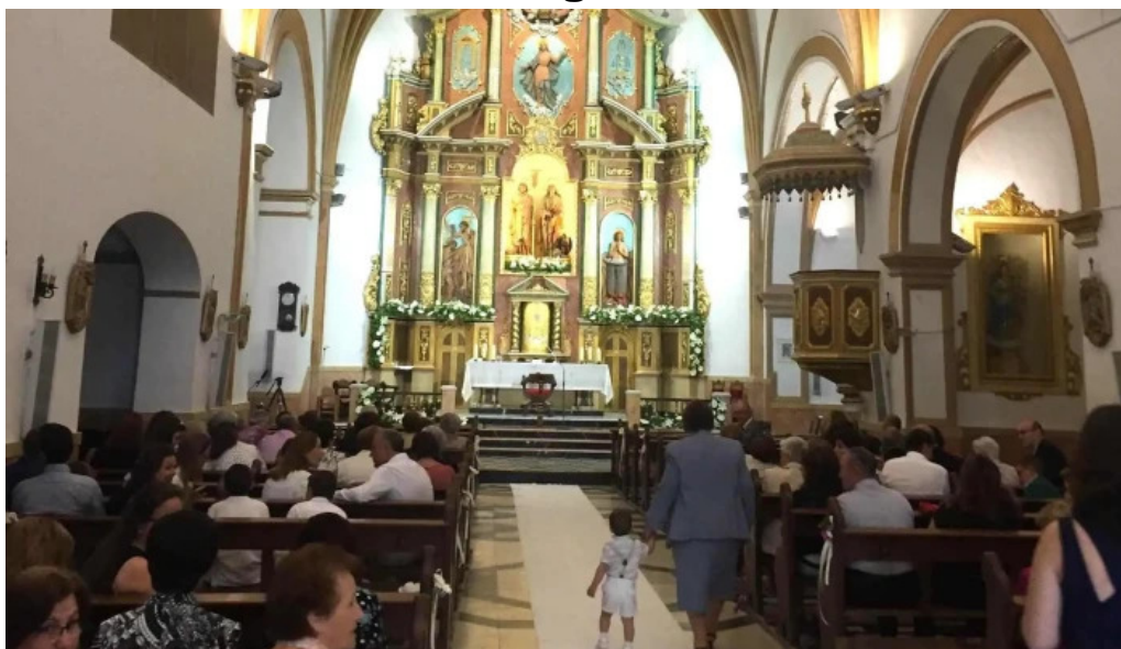
Iglesia de los santos juanes videos