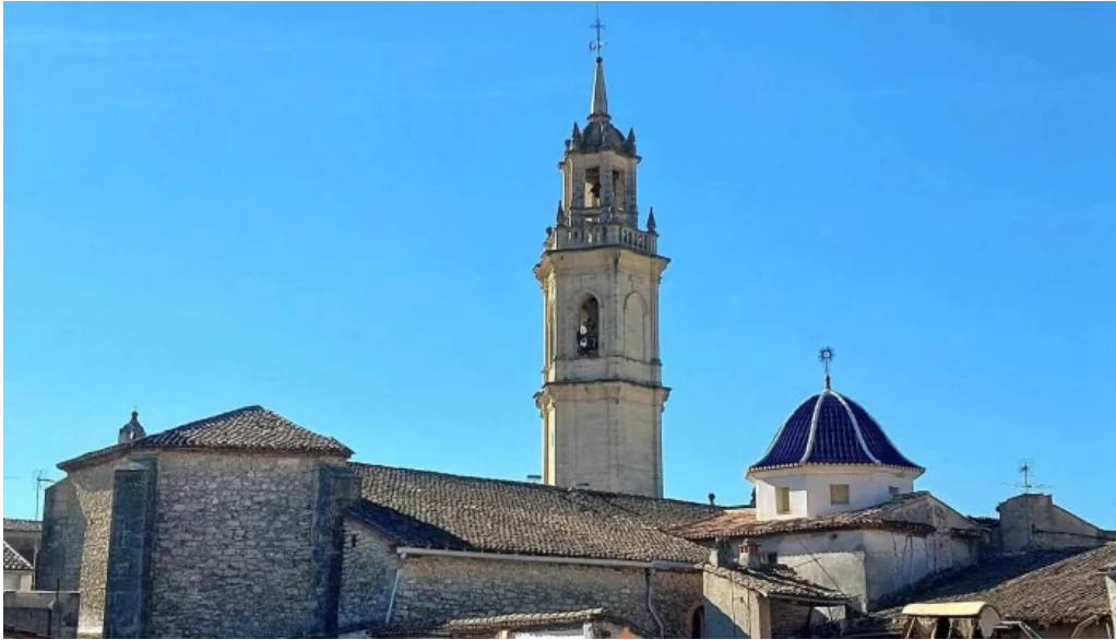
Iglesia de los santos juanes iglesia catolica