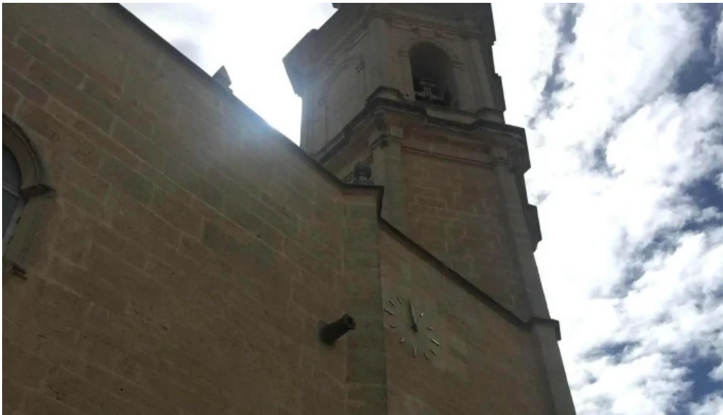
Iglesia de los santos juanes cerca de mi