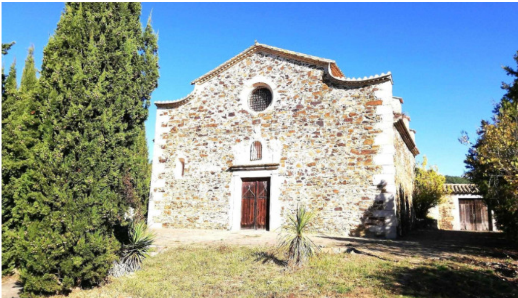
Sant marti de castellar de la selva iglesia