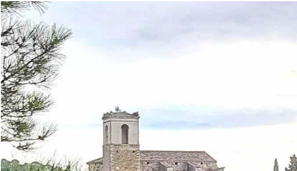
Sant marti de castellar de la selva quart