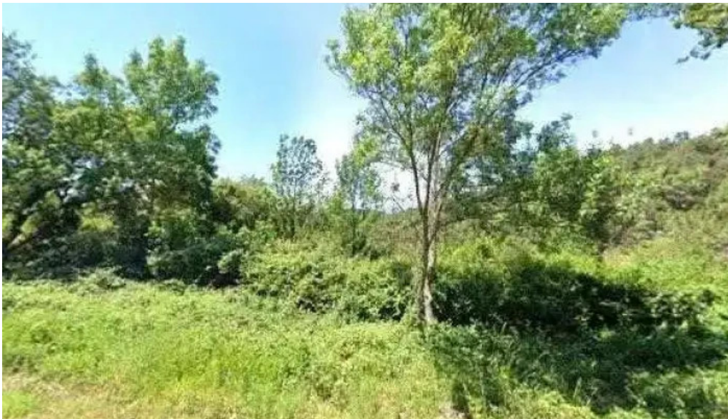
Sant marti de castellar de la selva numero