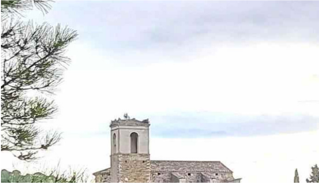
Sant marti de castellar de la selva iglesia catolica