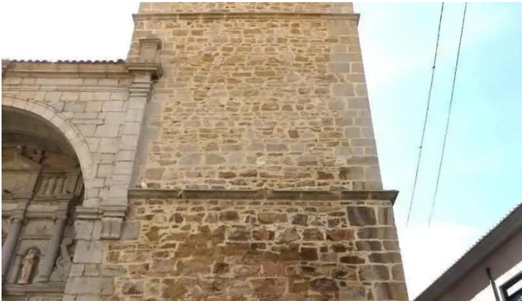
Iglesia de santa emerenciana pueblo de valverde la