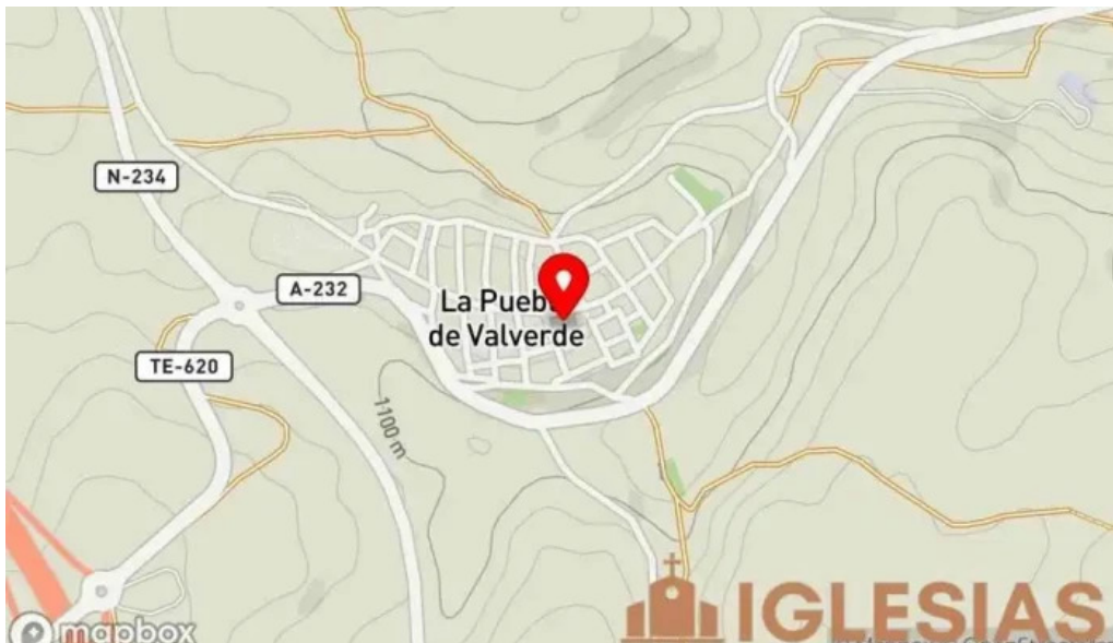
Iglesia de santa emerenciana mapa