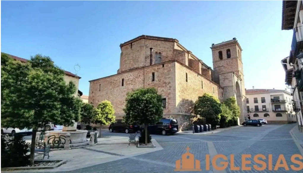
Iglesia de santa emerenciana videos