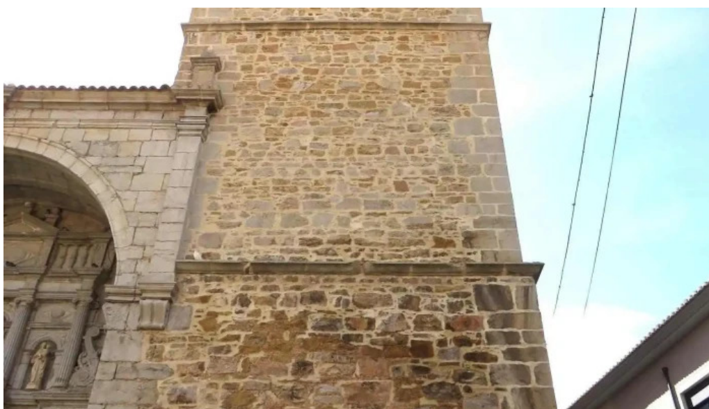
Iglesia de santa emerenciana iglesia catolica