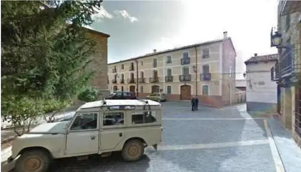
Iglesia de santa emerenciana precios