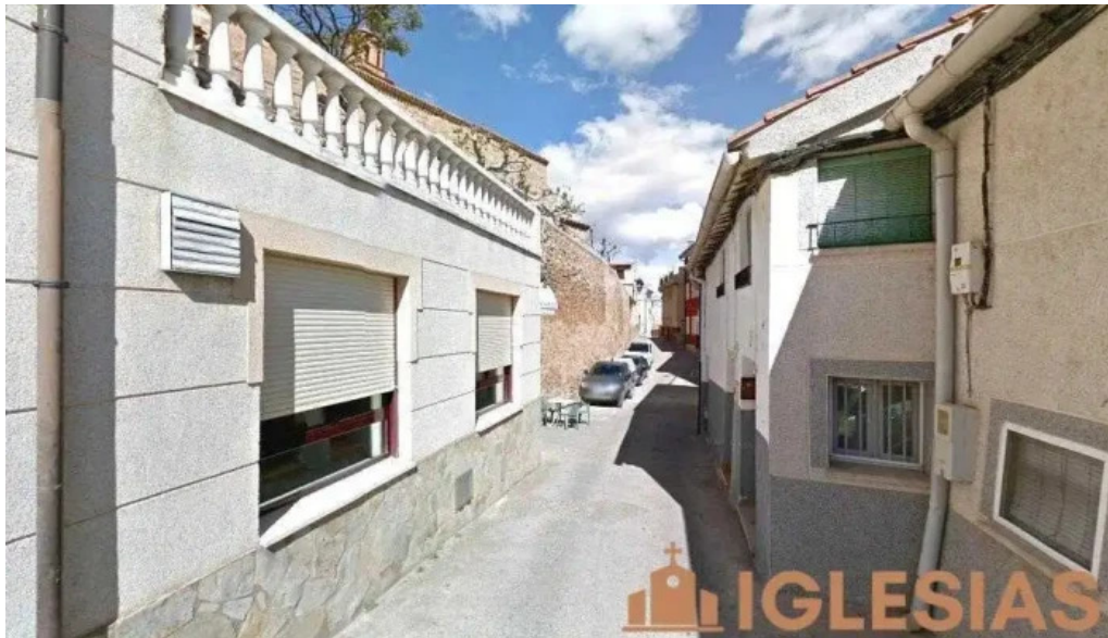
Iglesia de prejano prejano