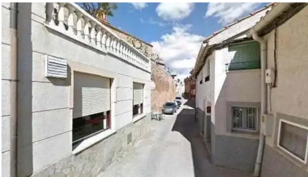
Iglesia de premano iglesia catolica