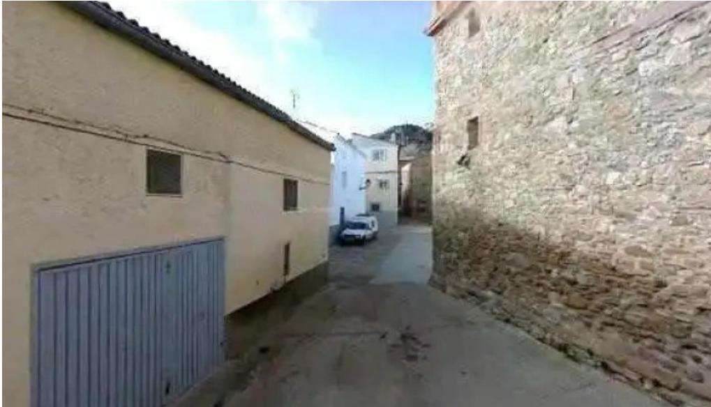
Iglesia de nuestra senora de la asuncion como llegar