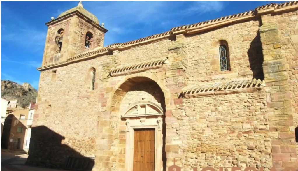
Iglesia de nuestra senora de la asuncion iglesia catolica