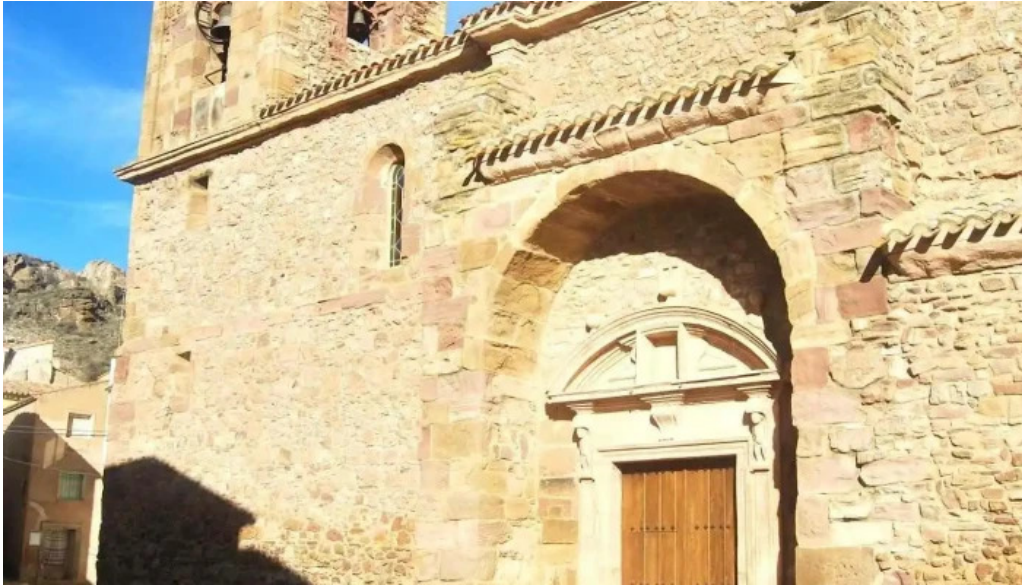
Iglesia de nuestra senora de la asuncion iglesia