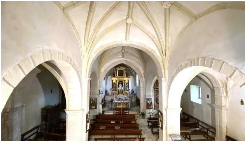
Iglesia de nuestra senora de las nieves iglesia