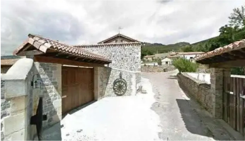
Iglesia de nuestra señora de las nieves puntaje