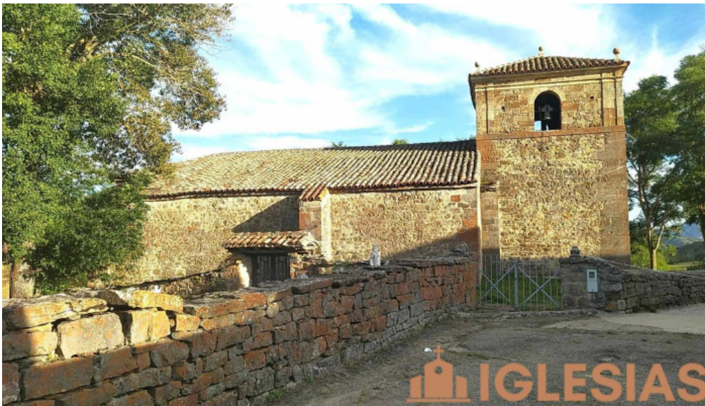
Iglesia de nuestra señora de las nieves polentinos