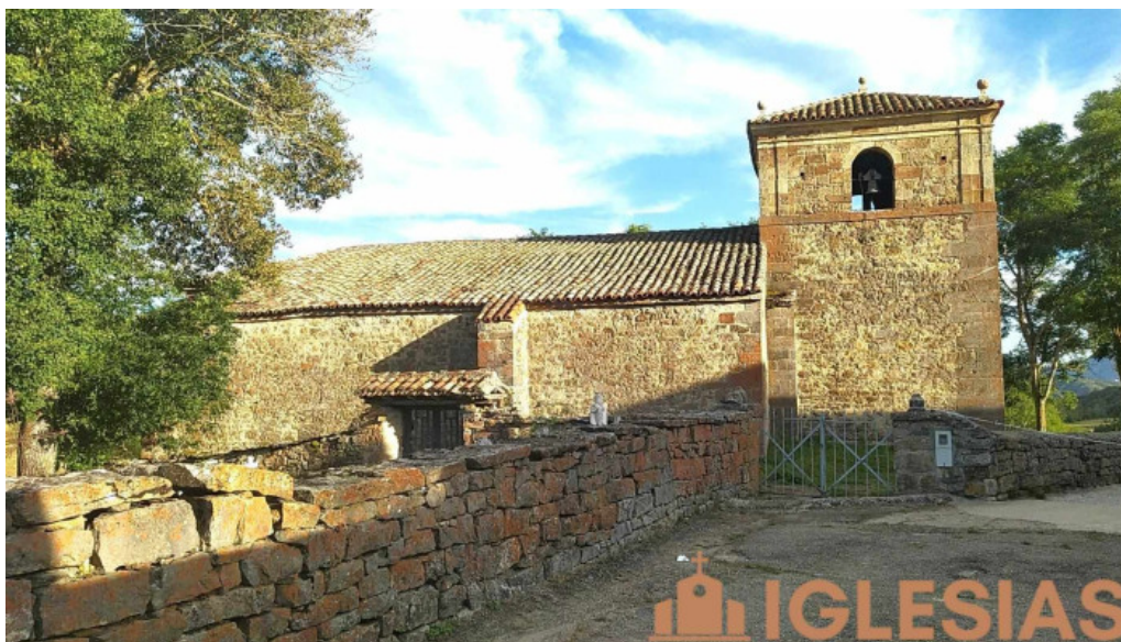
Iglesia de nuestra senora de las nieves iglesia catolica