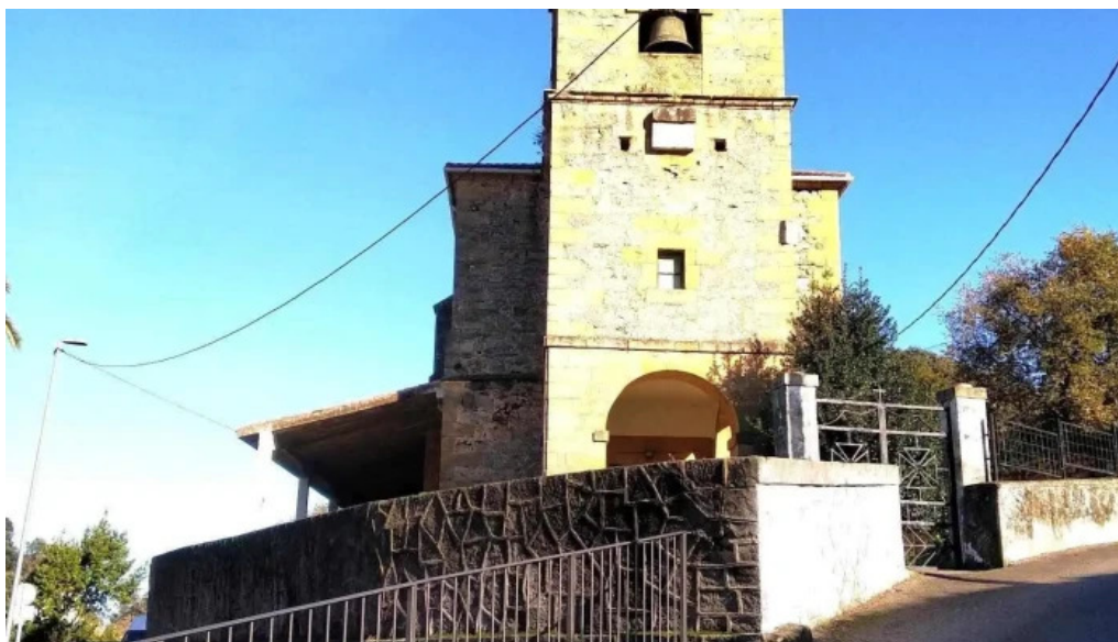
Iglesia de san nicolas de bari iglesia catolica