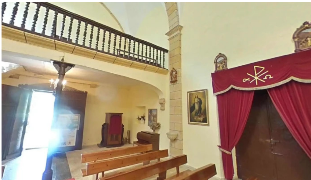
Iglesia de san nicolas de bari iglesia