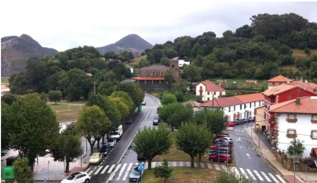
Iglesia de san nicolas de bari pobena