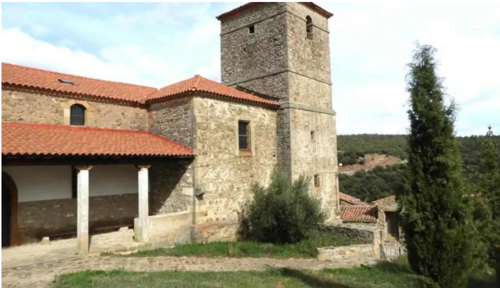
Iglesia de san esteban protomartir pobar