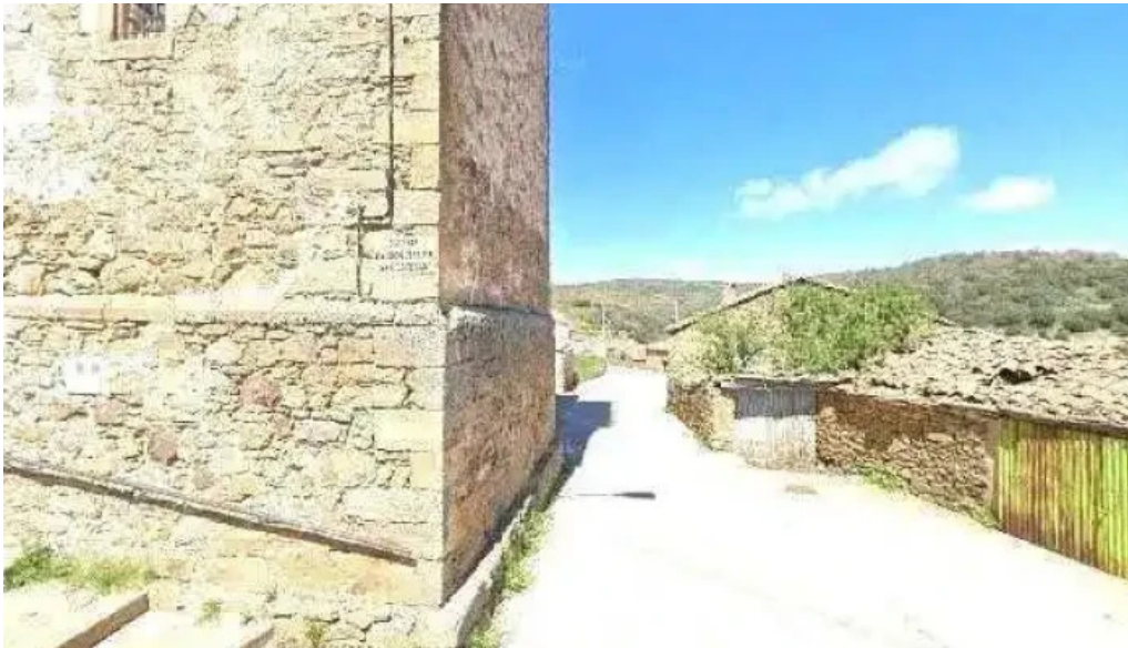
Iglesia de san esteban protomartir sitio web