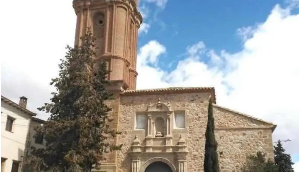
Iglesia nuestra senora de la piedad plenas