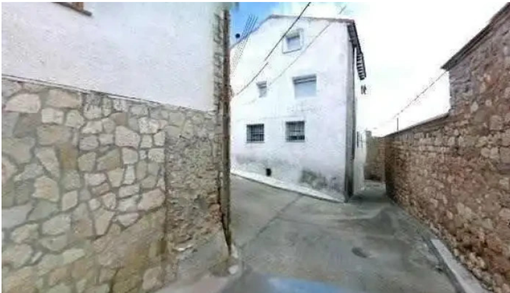
Iglesia nuestra senora de la piedad numero