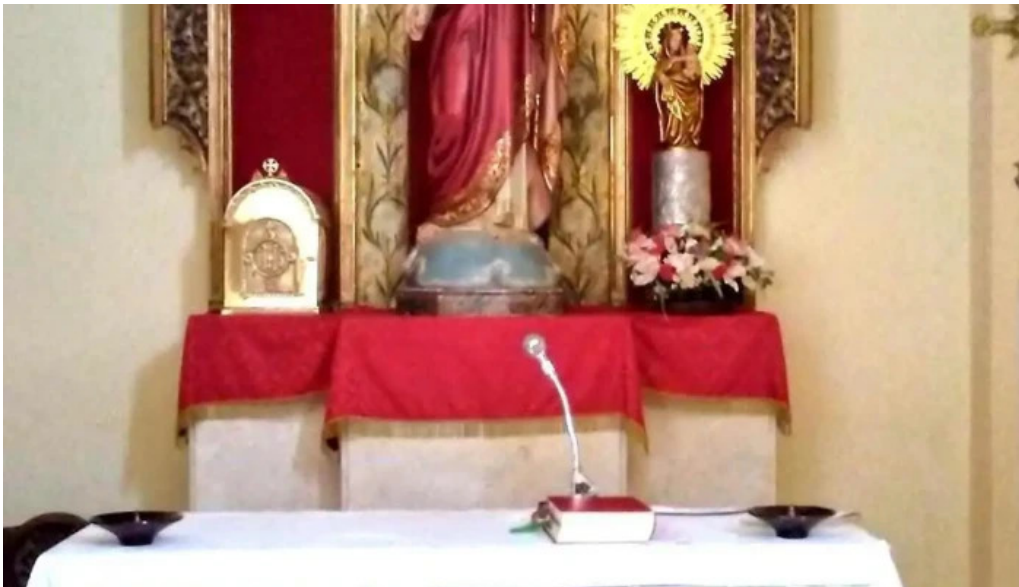
Iglesia nuestra senora de la piedad iglesia