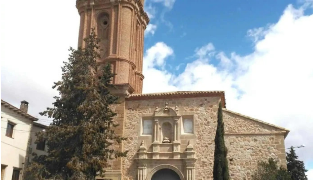
Iglesia nuestra senora de la piedad iglesia catolica