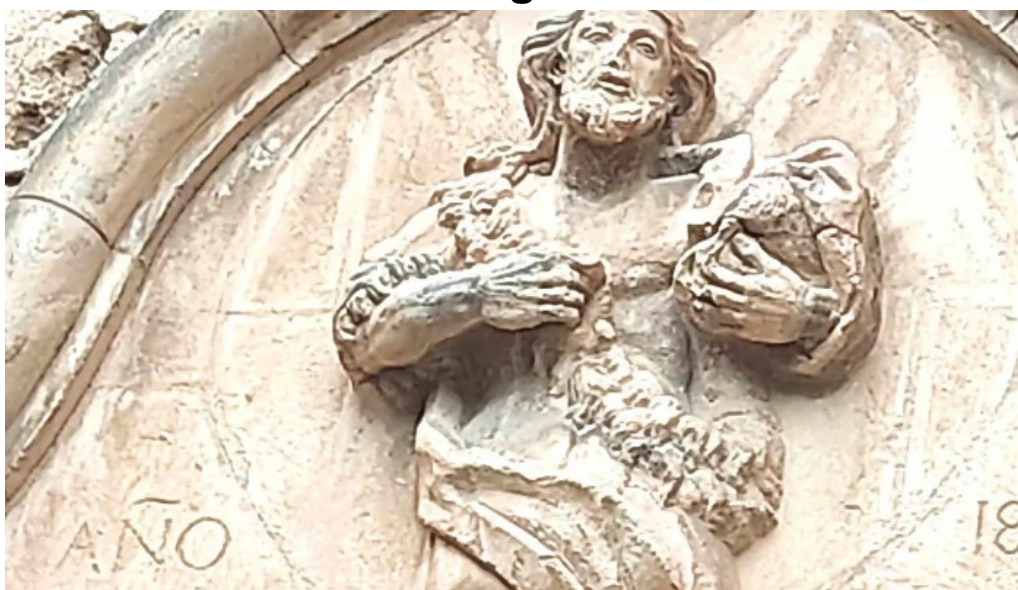
Iglesia santa maria la mayor pitarque sitio web