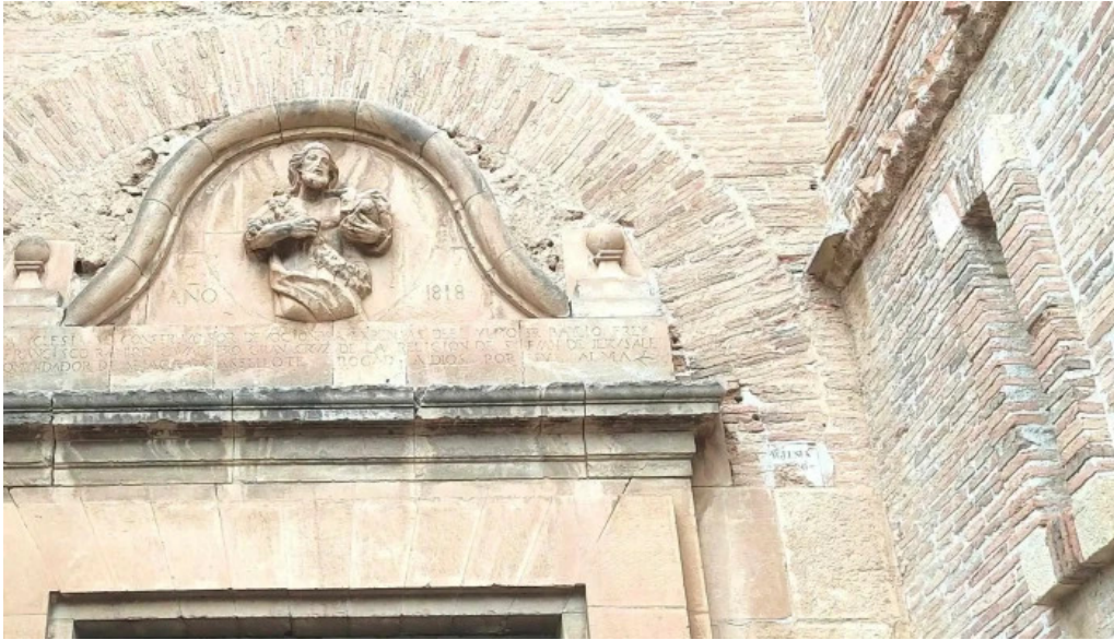
Iglesia santa maria la mayor pitarque opiniones