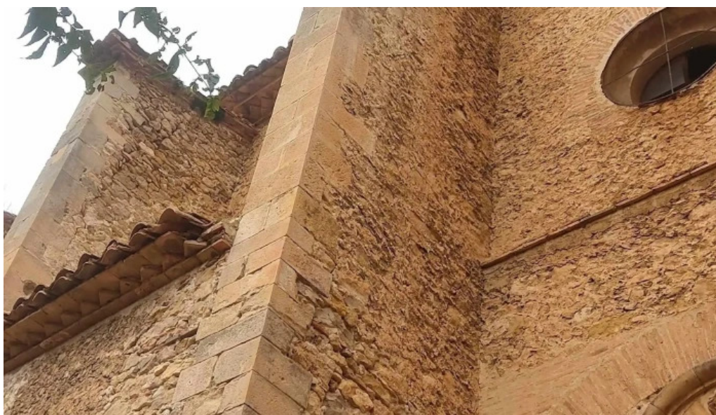
Iglesia santa maria la mayor pitarque pitarque