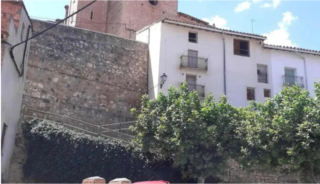
Iglesia santa maria la mayor pitarque iglesia