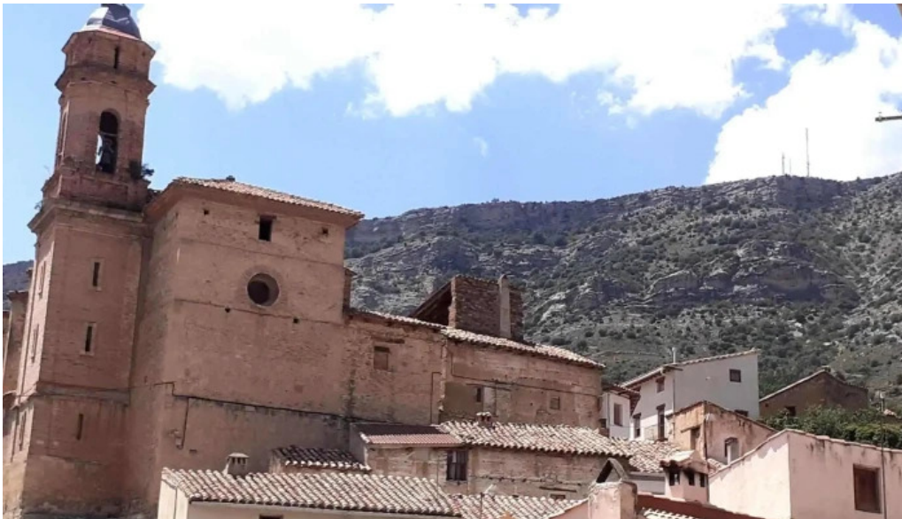
Iglesia santa maria la mayor pitarque iglesia catolica