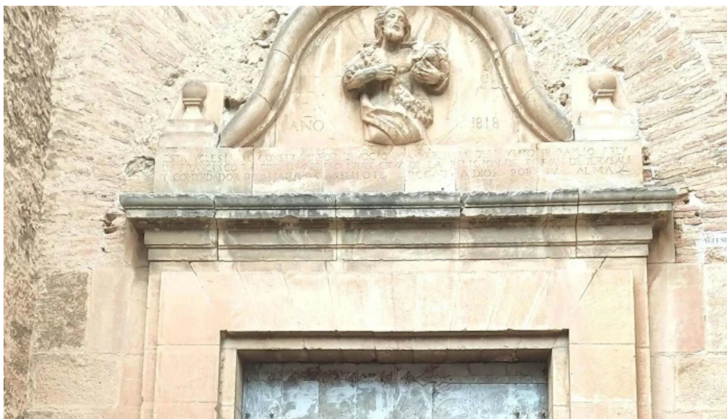
Iglesia santa maria la mayor pitarque cerca de mi