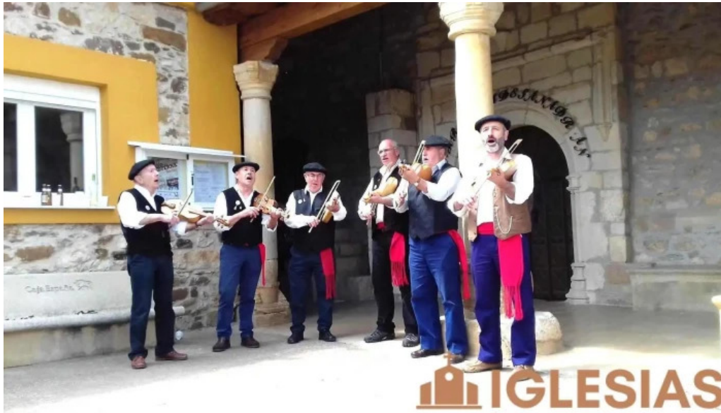
Iglesia de san adrian pino de viduerna