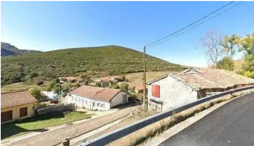
Iglesia santa ana catalogo