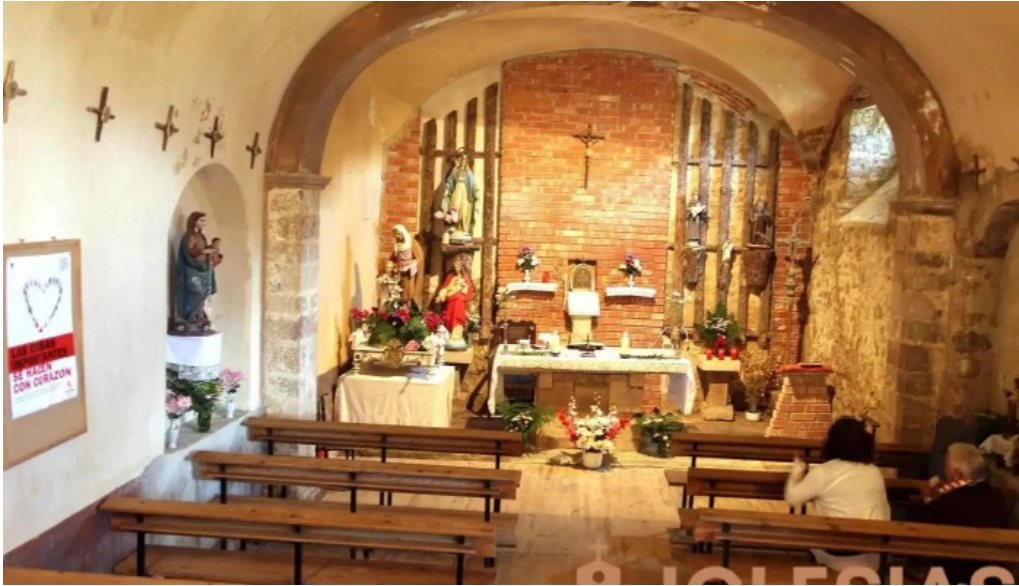
Iglesia santa ana iglesia