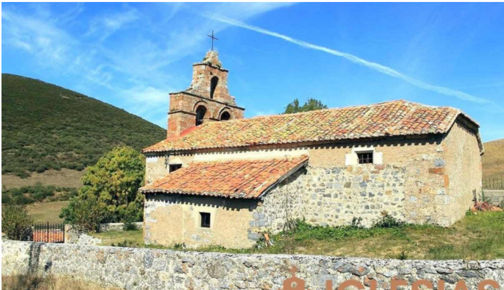
Iglesia santa ana iglesia catolica