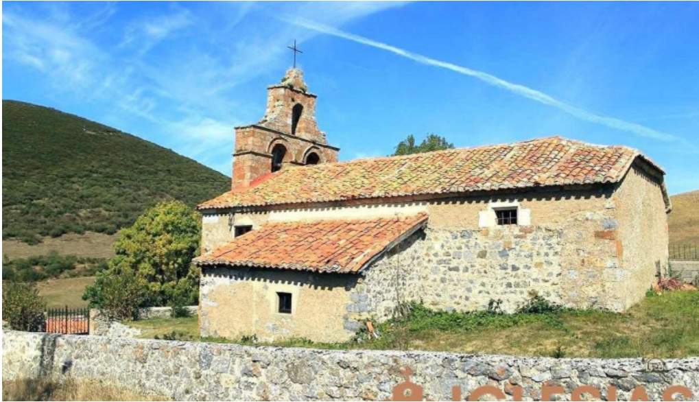
Iglesia santa ana piedrasluengas