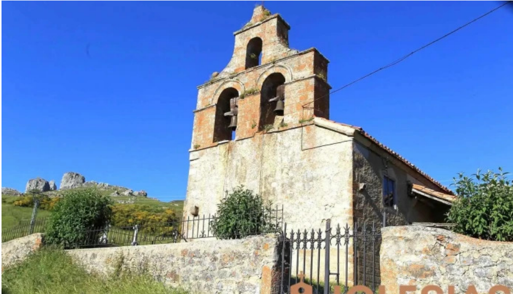
Iglesia santa ana herreruela de castilleria