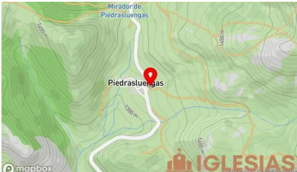
Iglesia santa ana mapa