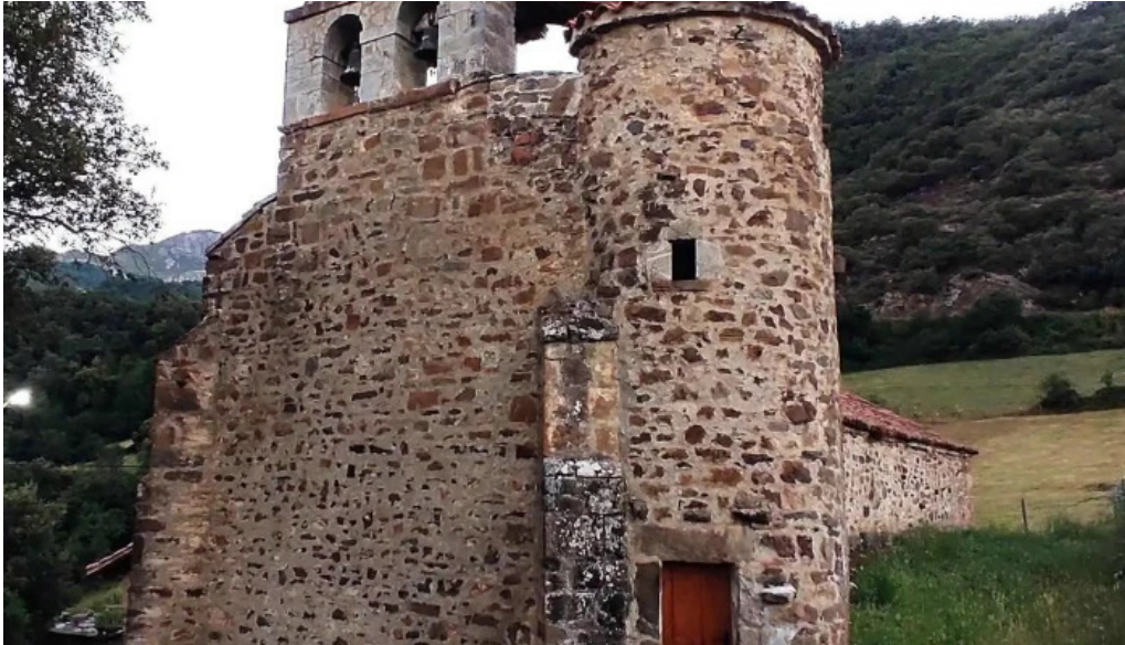
Iglesia de san juan degollado iglesia catolica