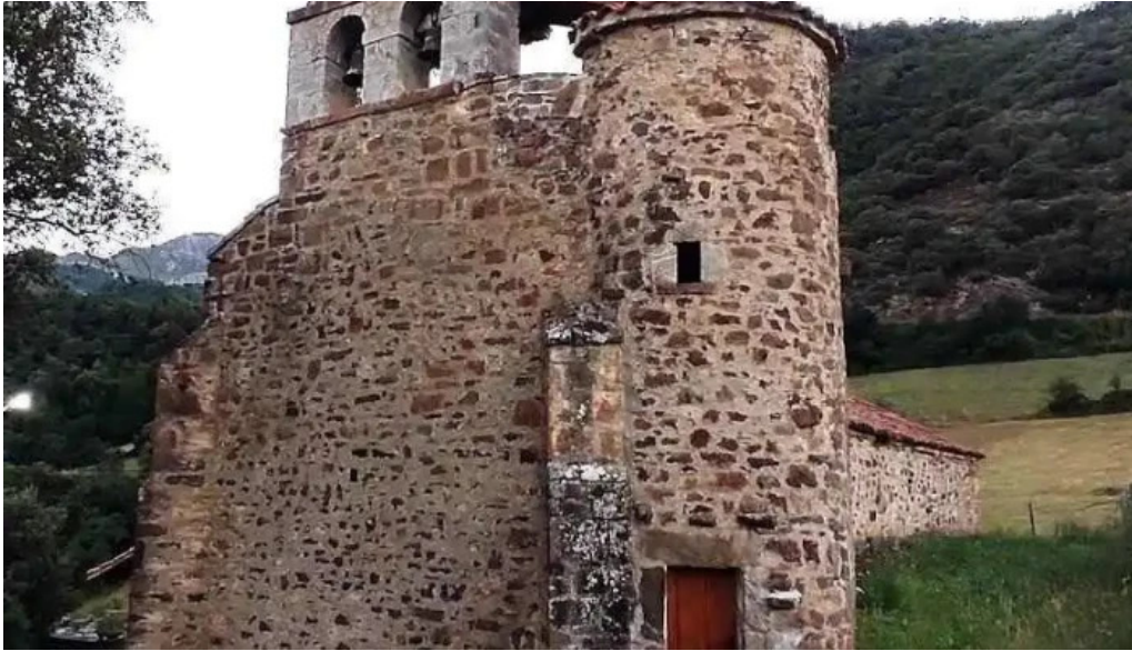
Iglesia de san juan degollado pesaguero la parte