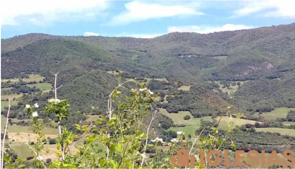
Iglesia de san juan degollado videos