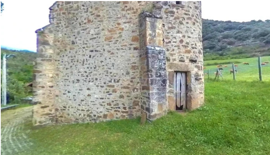
Iglesia de san juan degollado promocion