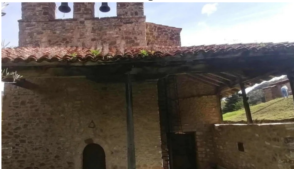
Ermita de la asuncion ubicacion