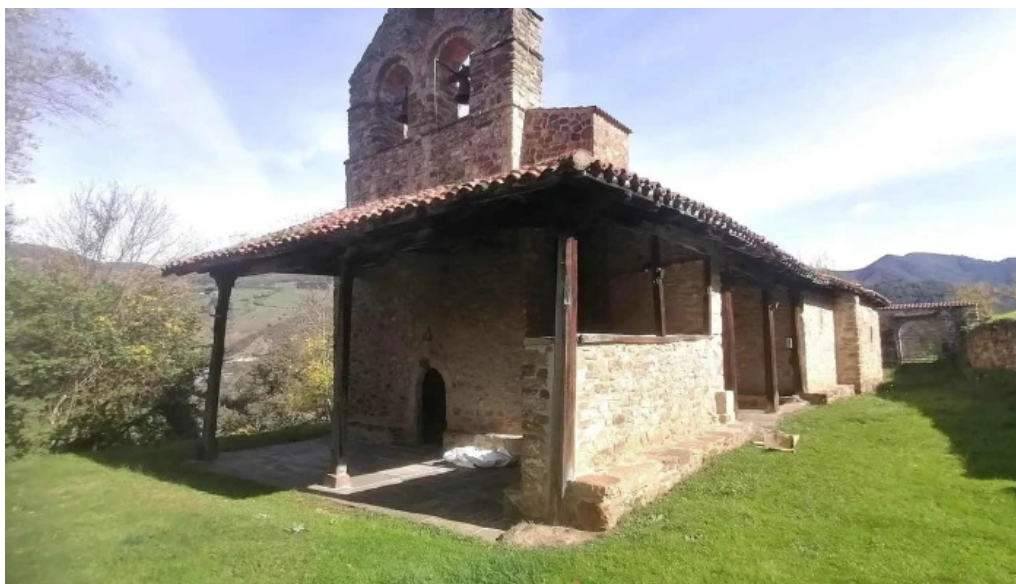
Ermita de la asuncion iglesia catolica