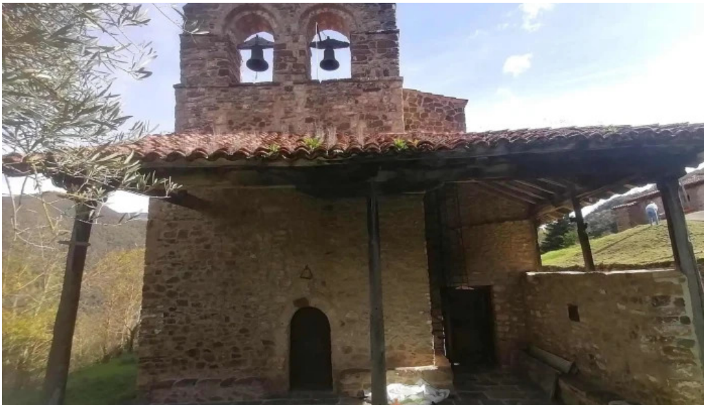
Ermita de la asuncion iglesia