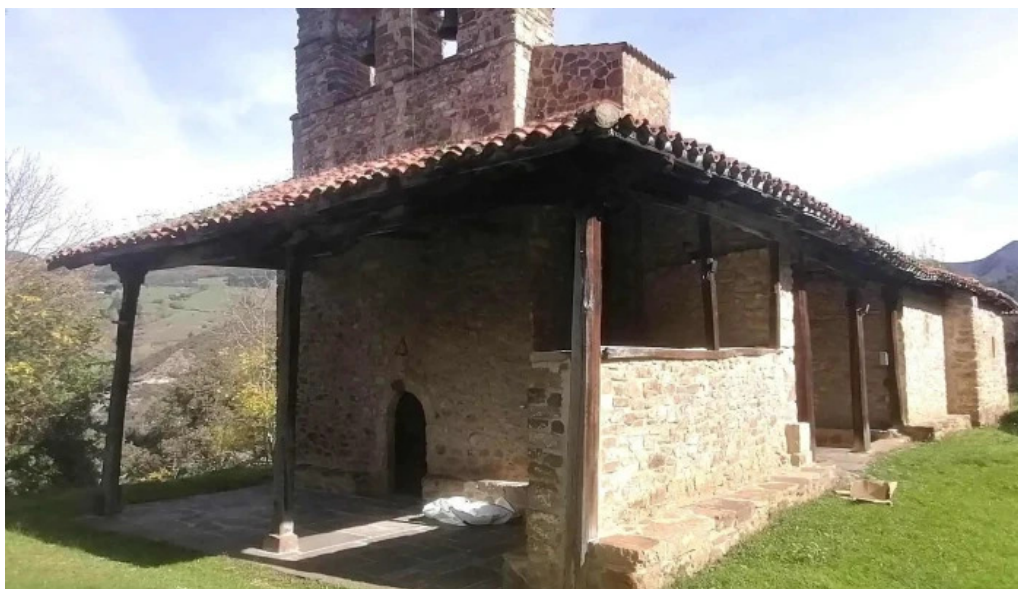
Ermita de la asuncion perrozo