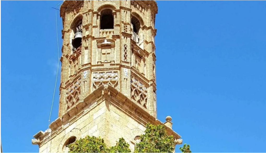
Iglesia de san bartolome apostol sitio web