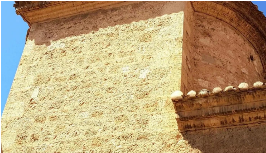
Iglesia de san bartolome apostol fotos