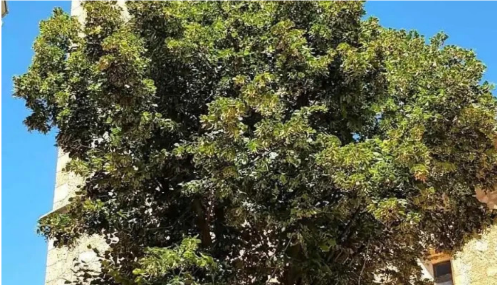
Iglesia de san bartolome apostol iglesia catolica