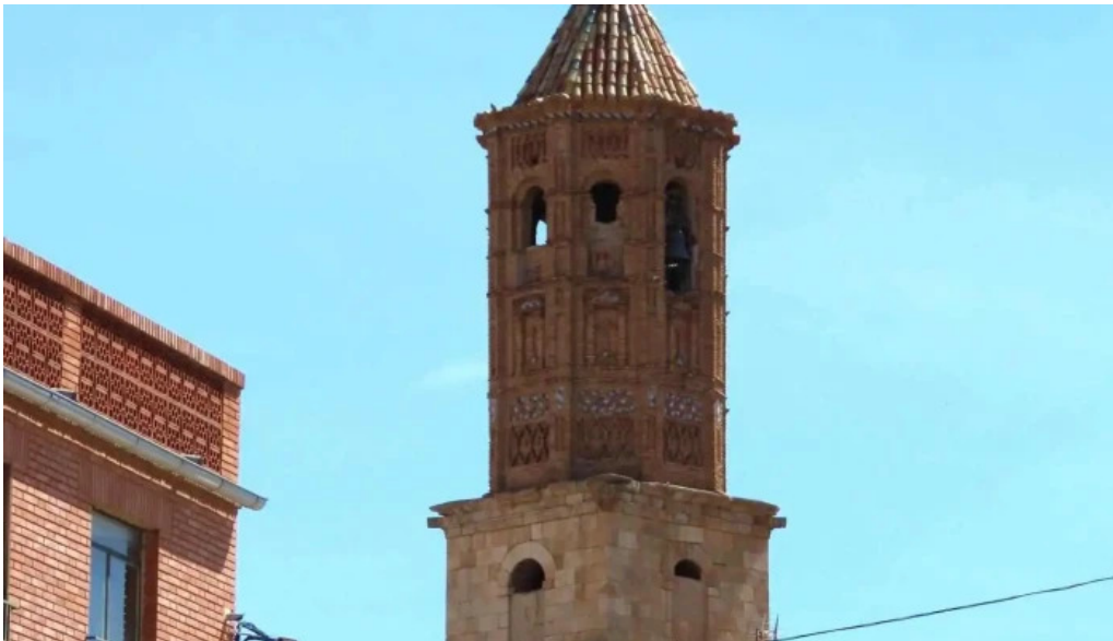
Iglesia de san bartolome apostol iglesia