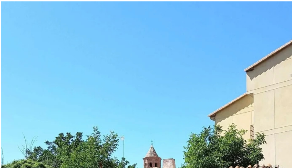
Iglesia de san bartolome apostol zona