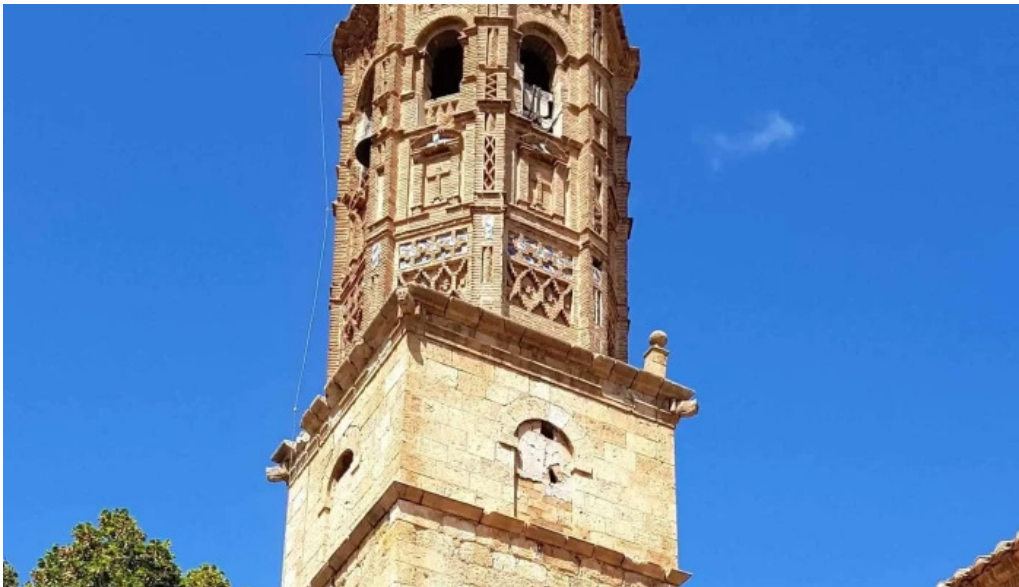
Iglesia de san bartolome apostol peralejos