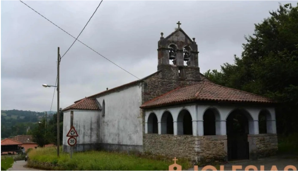
Iglesia san juan bautista de caces iglesia