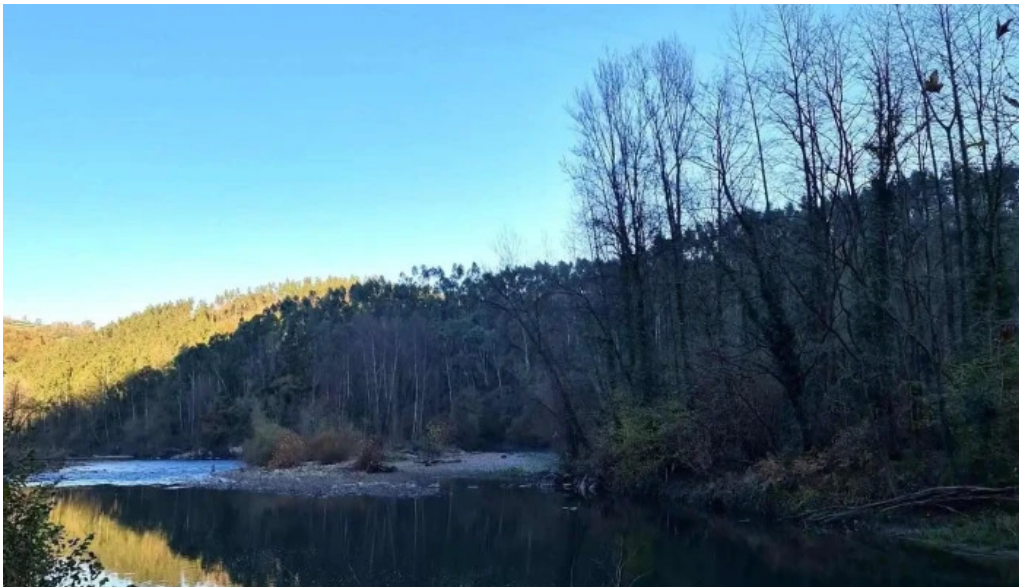
Iglesia san juan bautista de caces iglesia catolica