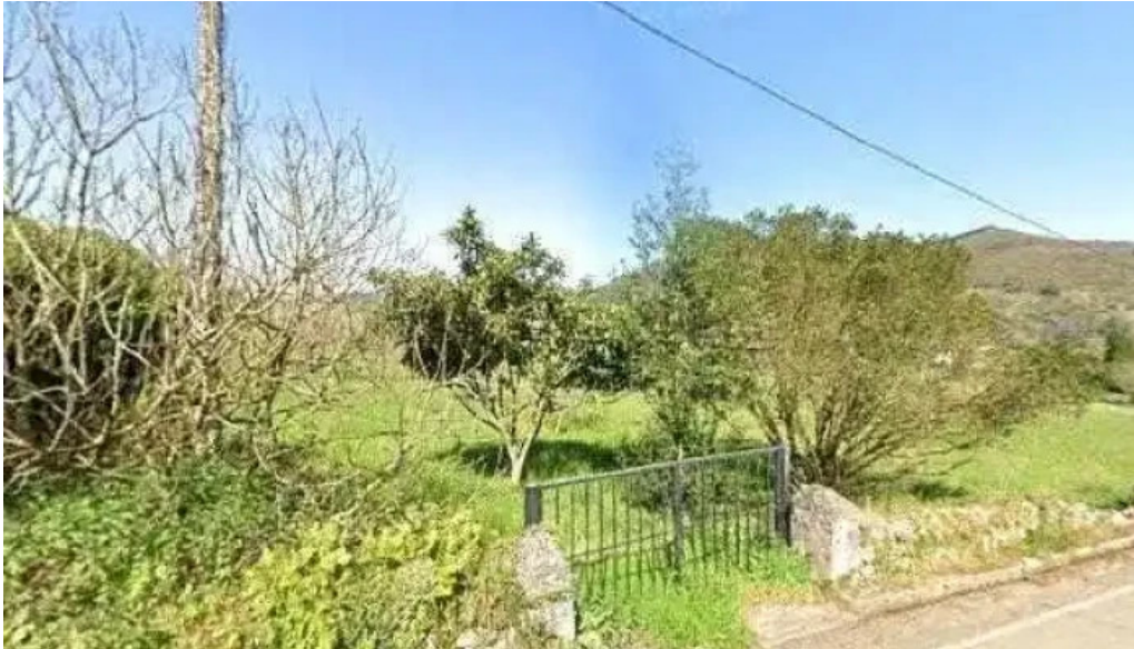
Iglesia san juan bautista de caces cerca de mi