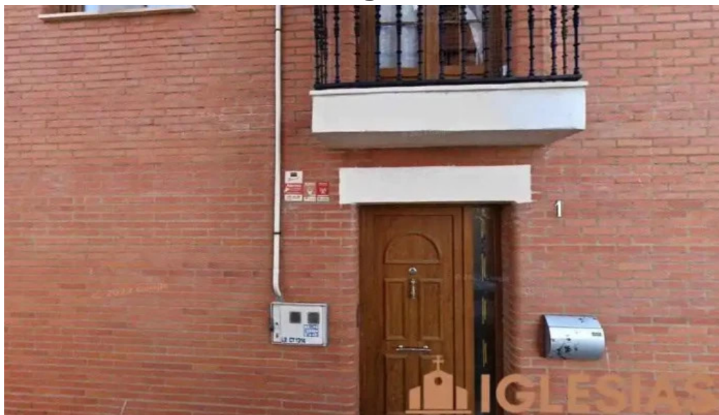
Iglesia parroquial san miguel arcangel oteruelo de la valdoncina