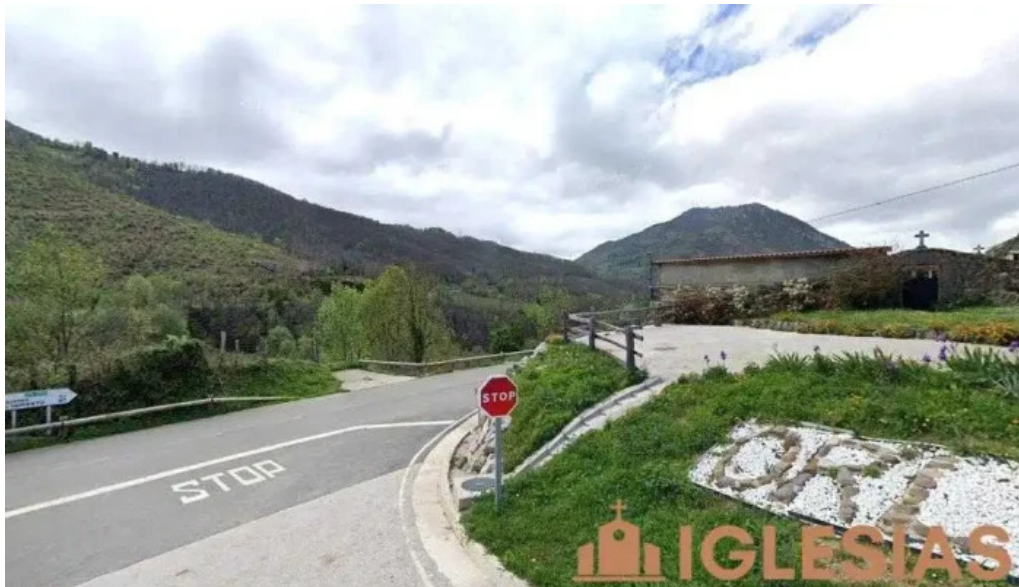
Iglesia de san bartolome orle