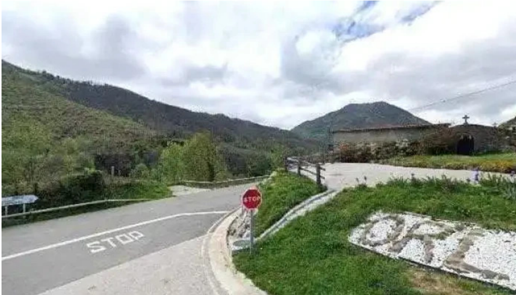
Iglesia de san bartolome iglesia catolica