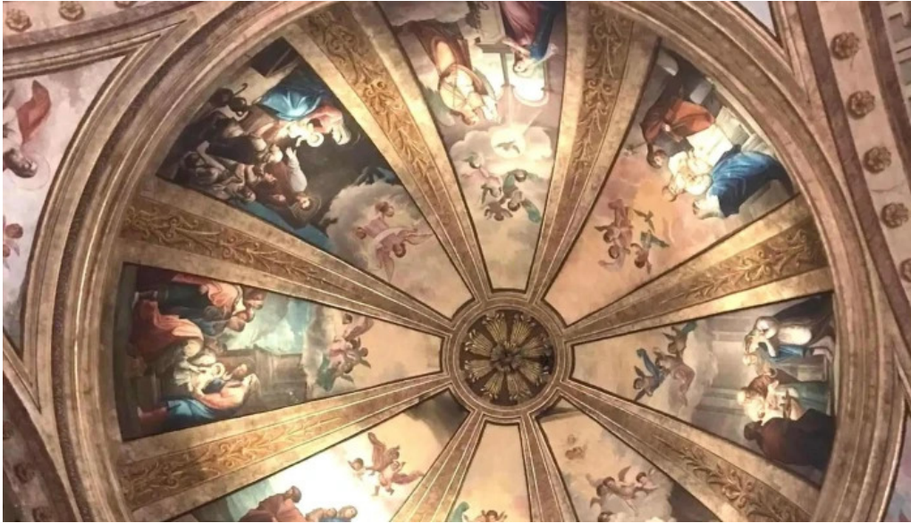
Antzinako birjinaren santutegia santuario de la virgen de la antigua comentarios