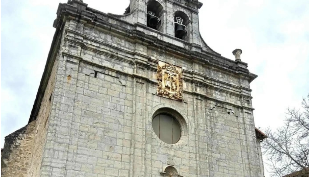
Antzinako birjinaren santutegia santuario de la virgen de la antigua numero