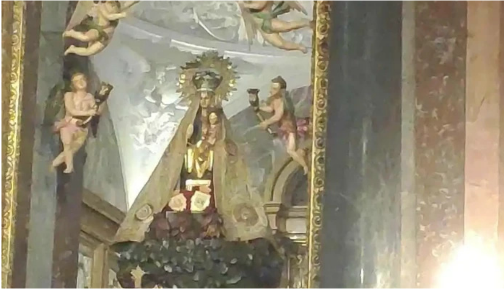
Antzinako birjinaren santutegia santuario de la virgen de la antigua iglesia