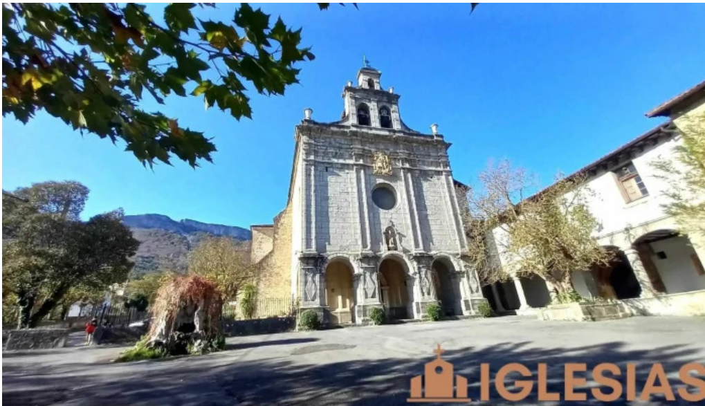
Antzinako birjinaren santutegia santuario de la virgen de la antigua iglesia catolica