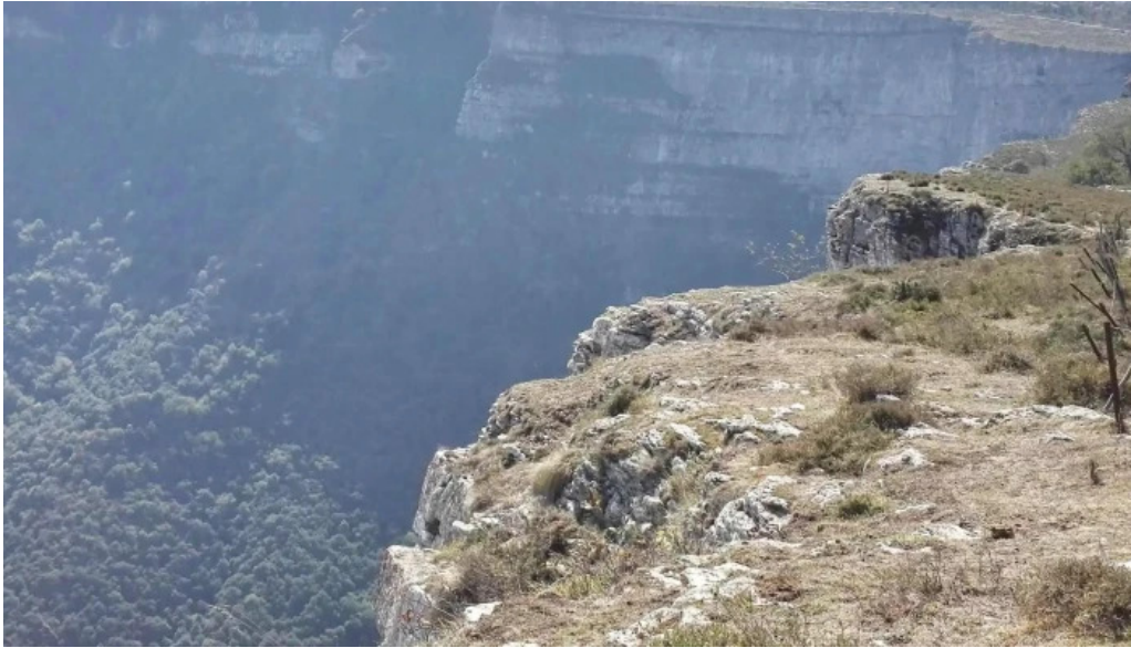
Antzinako birjinaren santutegia santuario de la virgen de la antigua telefono