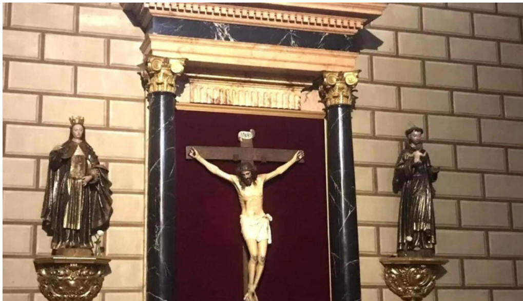
Antzinako birjinaren santutegia santuario de la virgen de la antigua videos