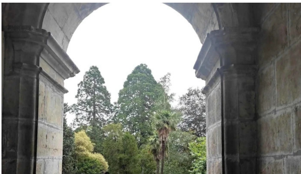
Antzinako birjinaren santutegia santuario de la virgen de la antigua ubicacion