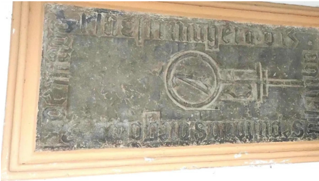
Antzinako birjinaren santutegia santuario de la virgen de la antigua sitio web