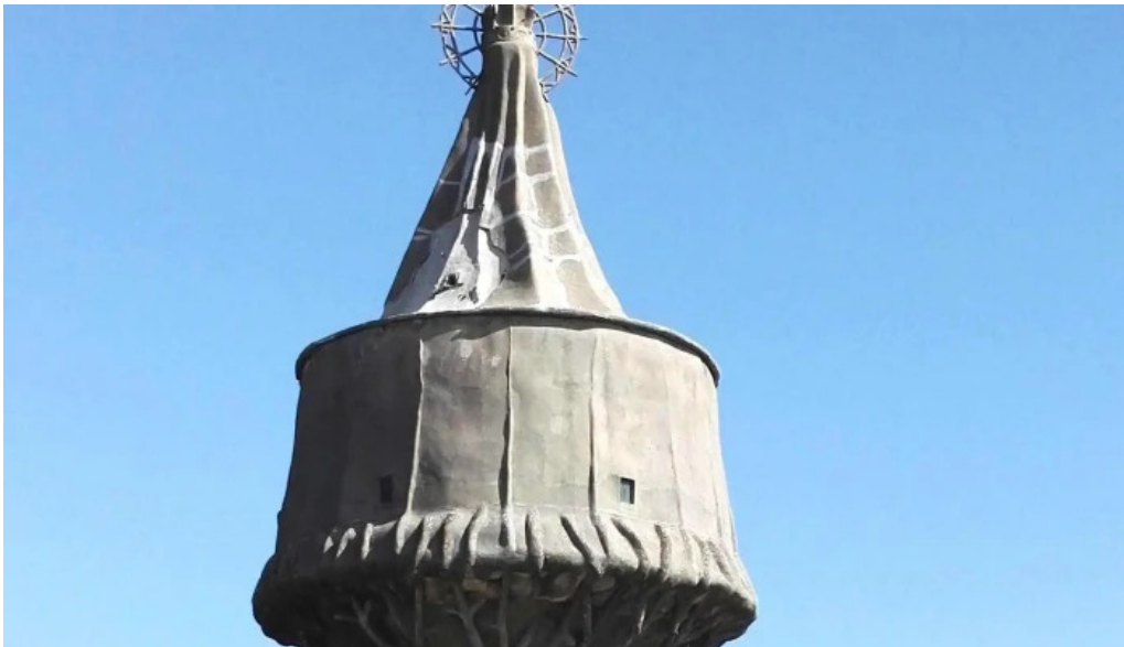
Antzinako birjinaren santutegia santuario de la virgen de la antigua opiniones