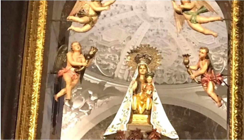
Antzinako birjinaren santutegia santuario de la virgen de la antigua orduna urduna