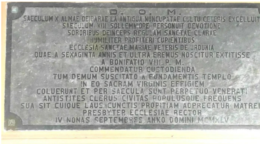
Antzinako birjinaren santutegia santuario de la virgen de la antigua como llegar