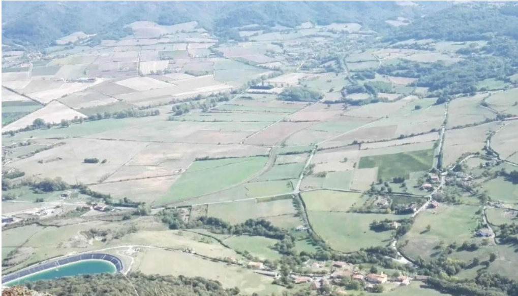
Antzinako birjinaren santutegia santuario de la virgen de la antigua descuentos