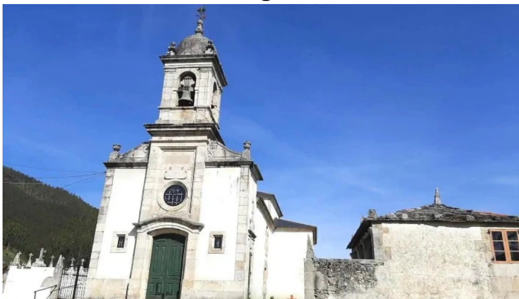
Iglesia de santo tomas de recare o valadouro