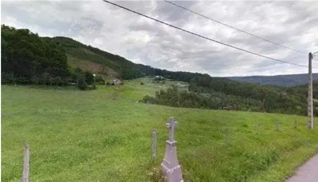
Iglesia de santo tomas de recare catalogo