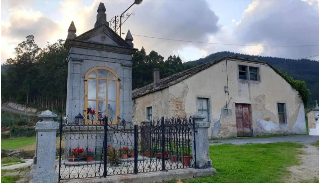
Iglesia de santo tomas de recare iglesia