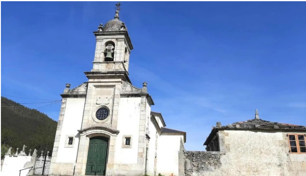
Iglesia de santo tomas de recare iglesia catolica