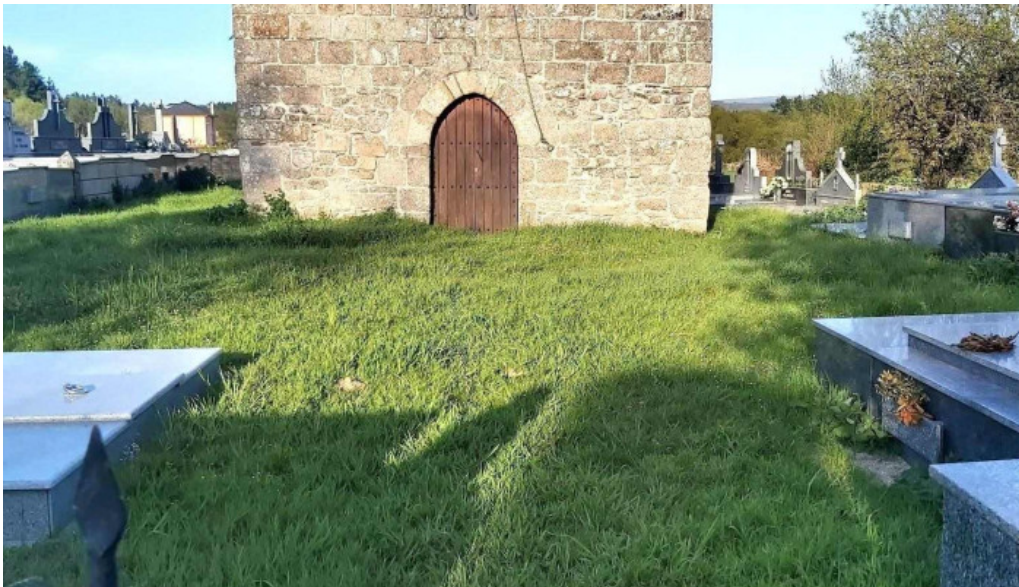
Iglesia de san julian de campelo iglesia