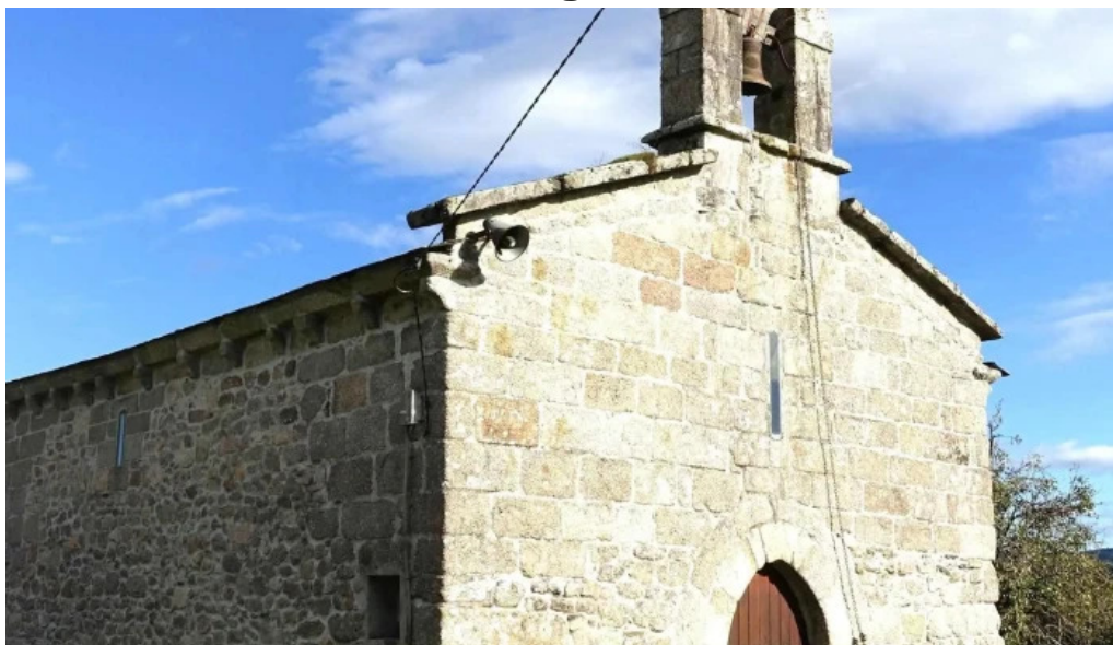
Iglesia de san julian de campelo zona