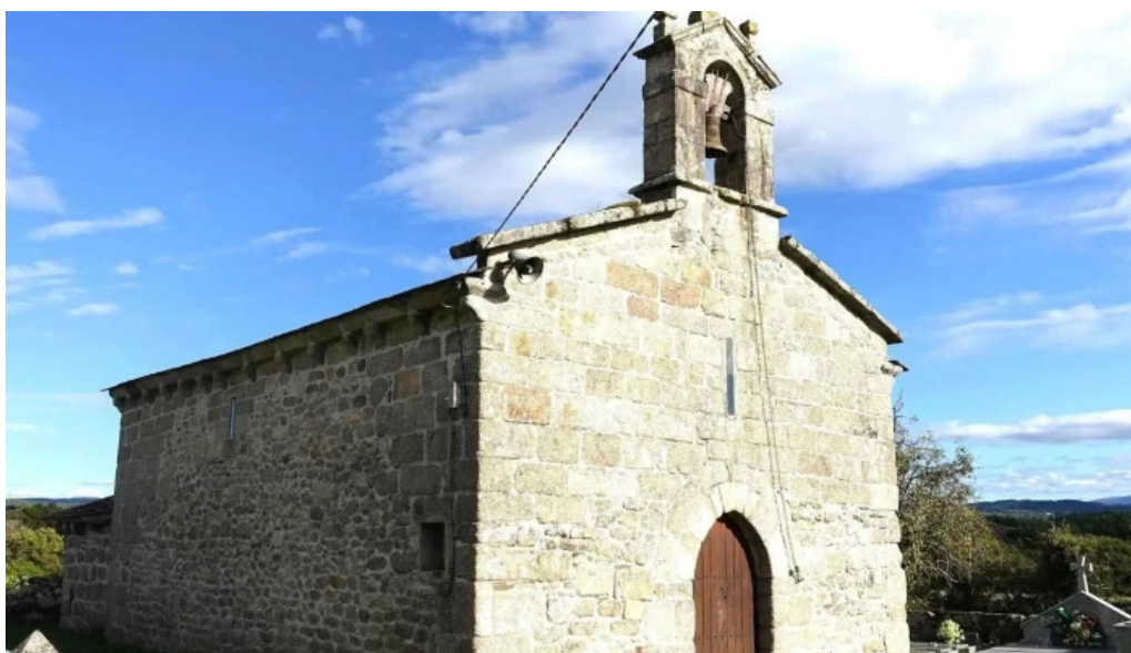
Iglesia de san julian de campelo iglesia catolica