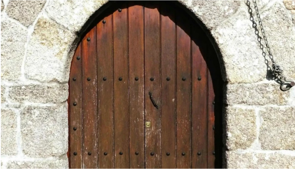
Iglesia de san julian de campelo opiniones