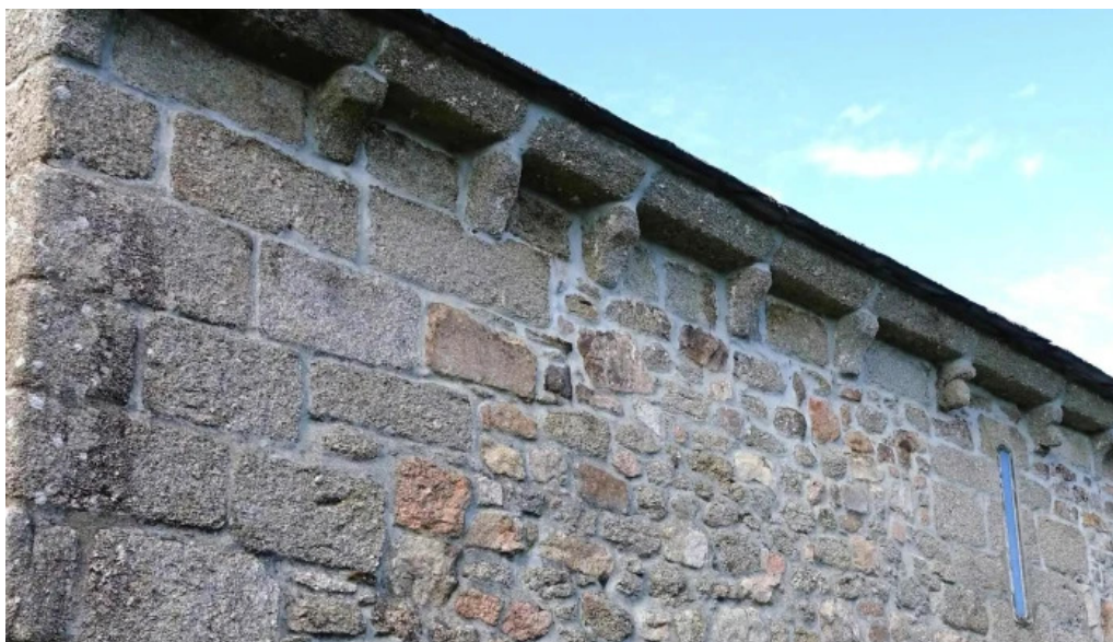
Iglesia de san julian de campelo promocion