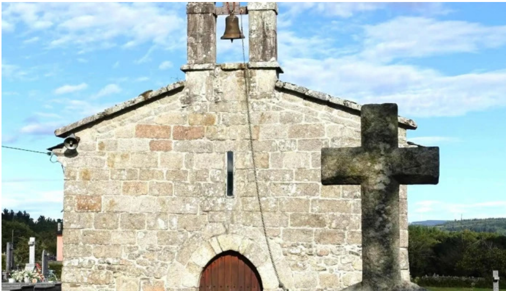
Iglesia de san julian de campelo o corgo