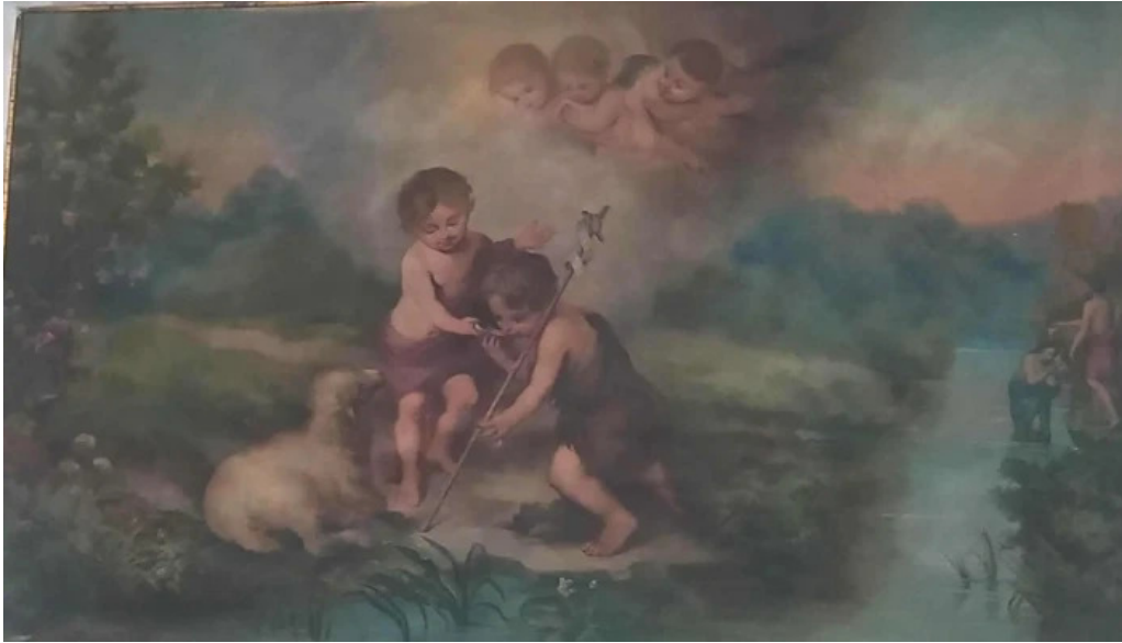
Iglesia de san julian como llegar