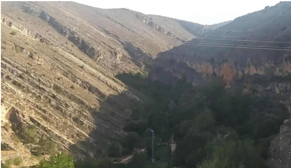
Iglesia de san julian cerca de mi