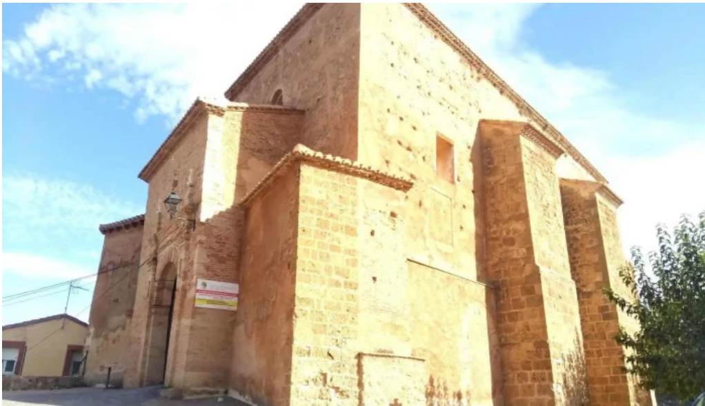
Iglesia de san julian iglesia catolica