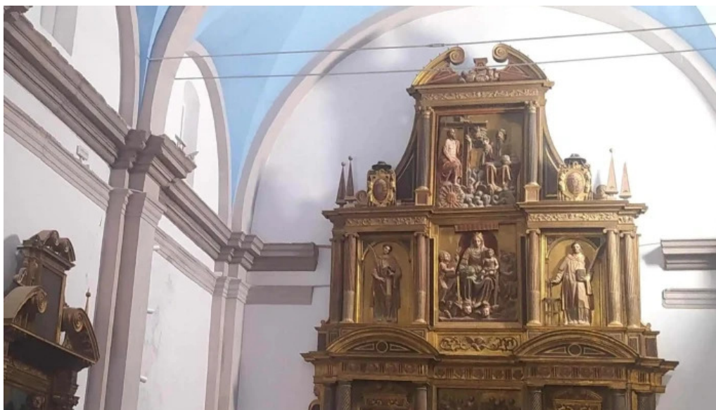
Iglesia de san julian catalogo