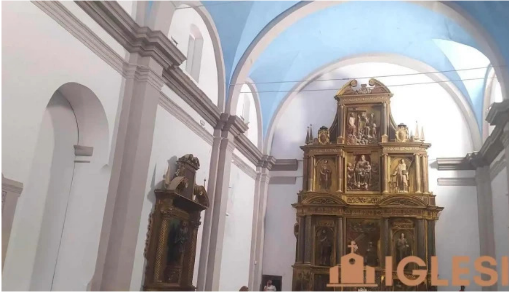
Iglesia de san julian iglesia