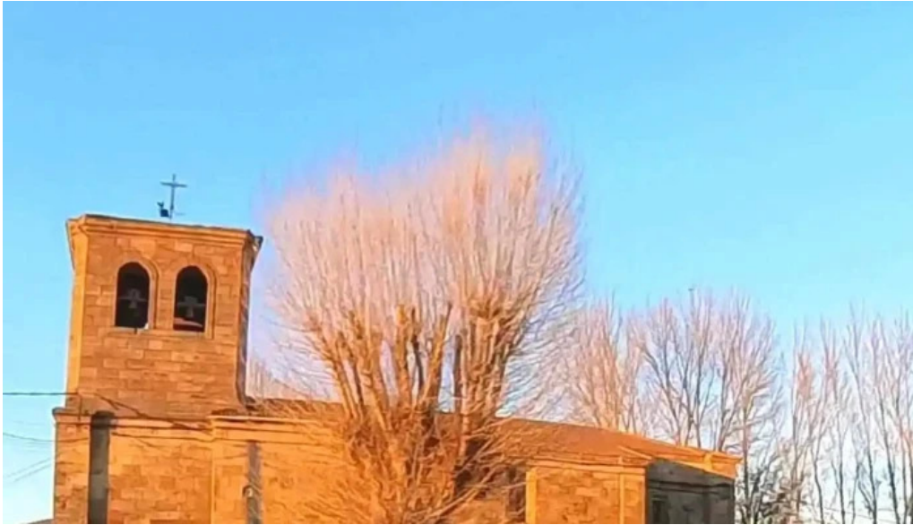
Iglesia de san martin de tours iglesia