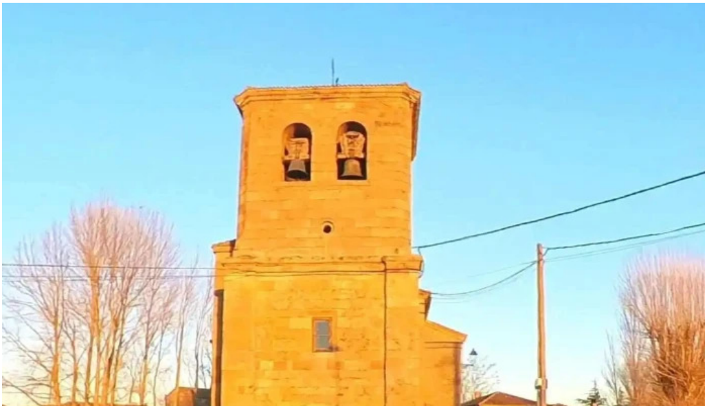
Iglesia de san martin de tours iglesia catolica