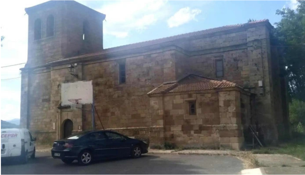
Iglesia de san martin de tours puntaje