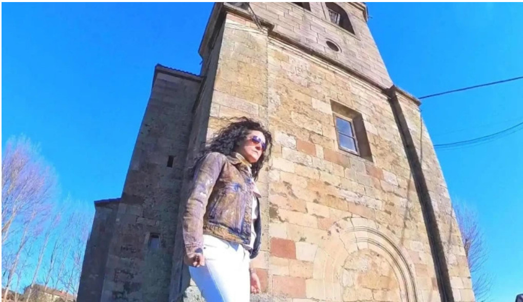
Iglesia de san martin de tours nestar