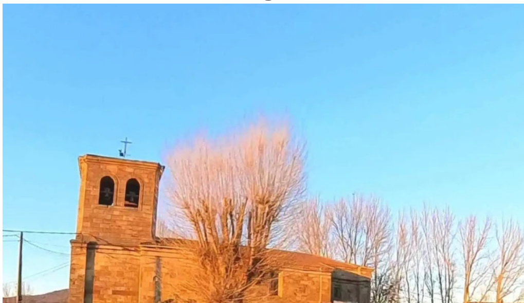
Iglesia de san martin de tours sitio web