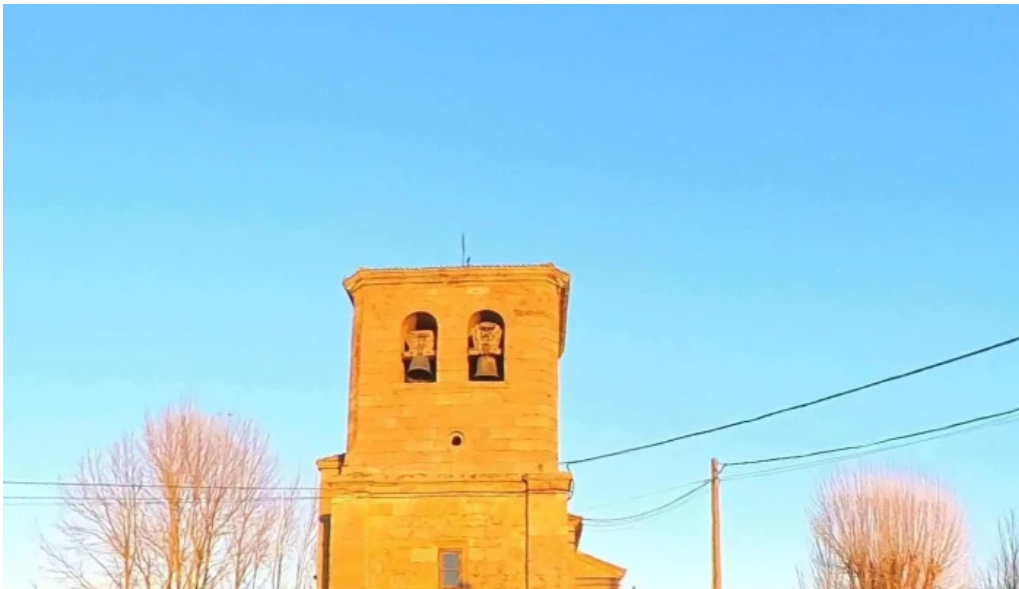
Iglesia de san martin de tours instagram