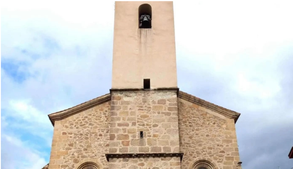
Iglesia de san andres zona