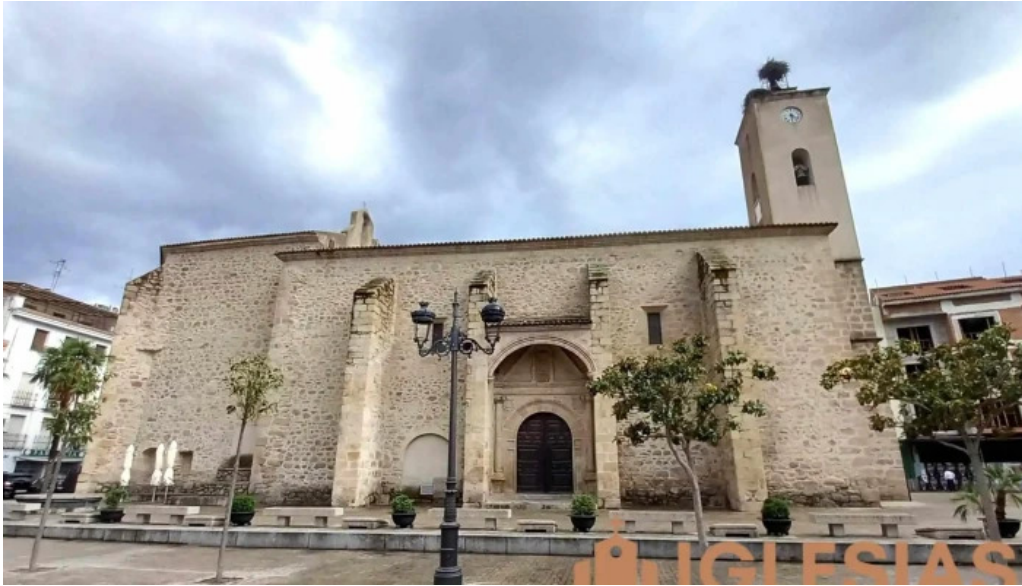
Iglesia de san andres iglesia