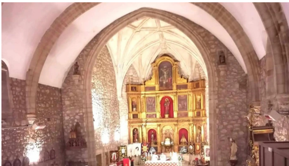
Iglesia de san andres abierto ahora