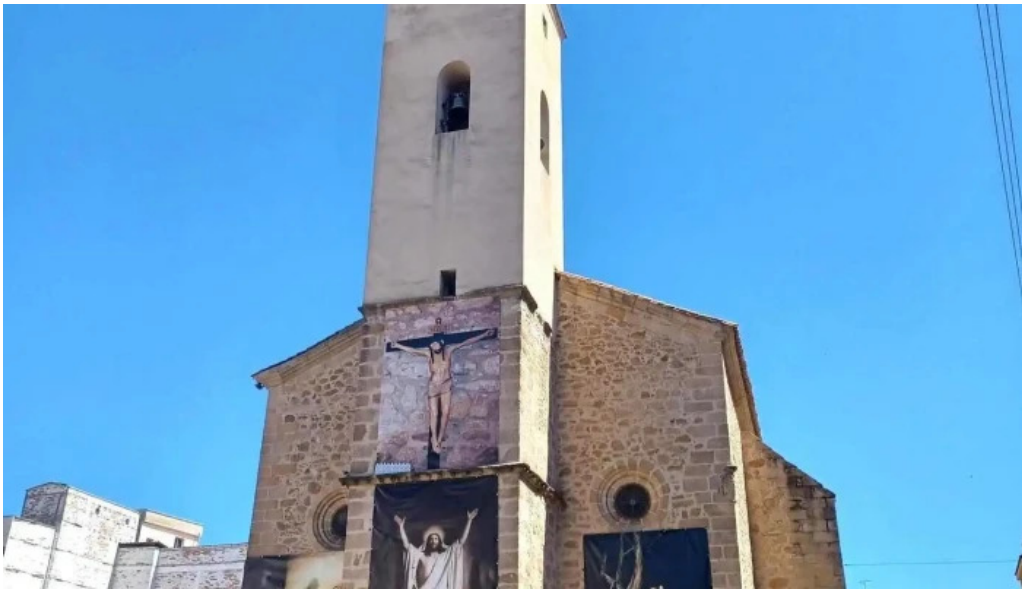
Iglesia de san andres iglesia catolica