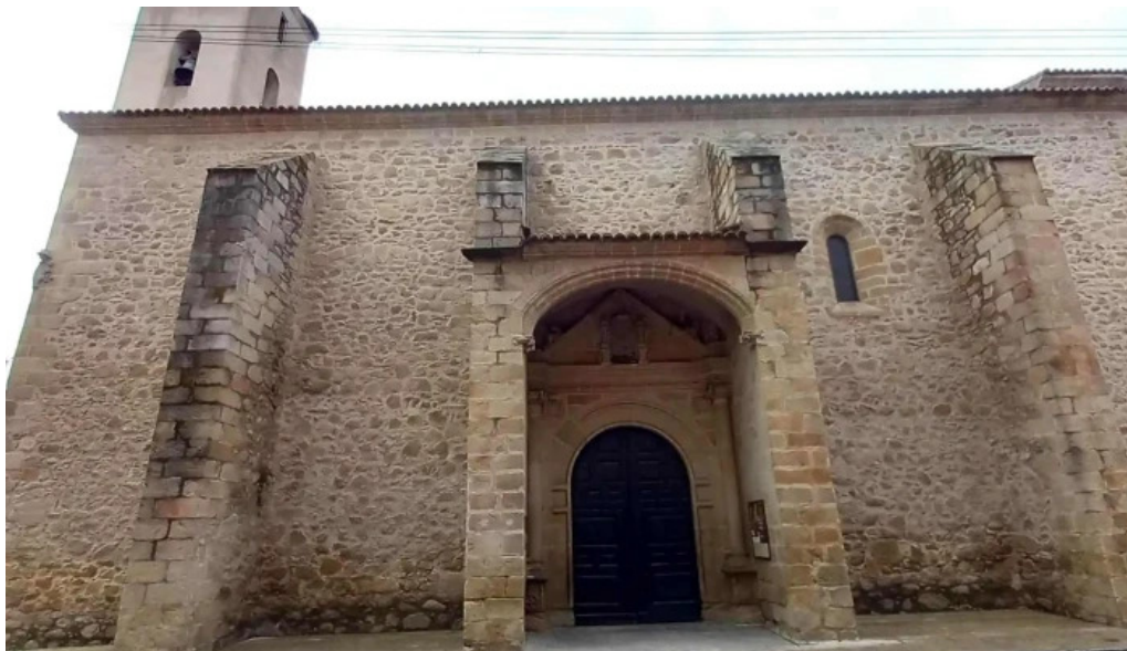
Iglesia de san andres instagram