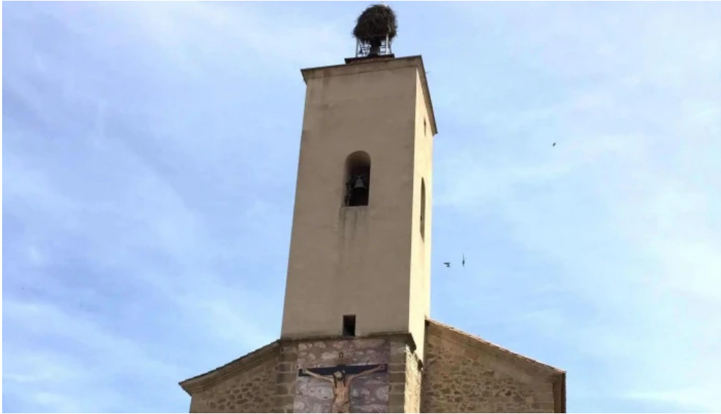
Iglesia de san andres direccion