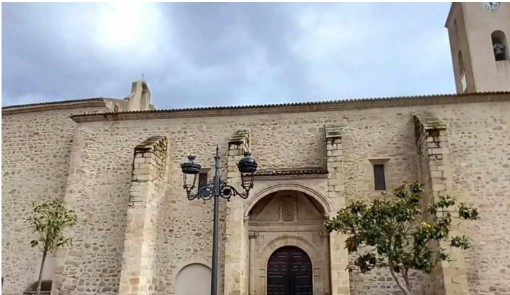
Iglesia de san andres catalogo