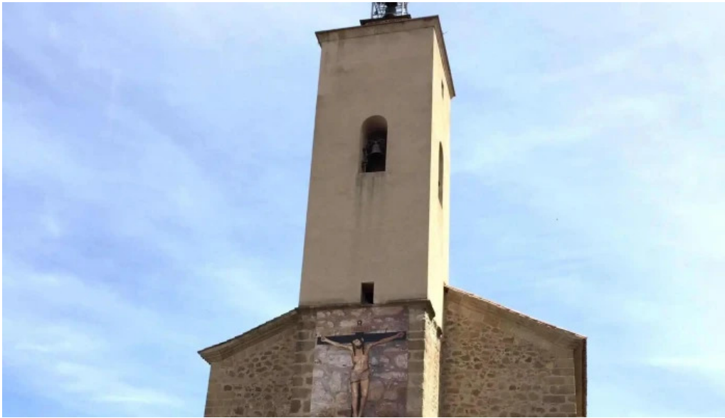
Iglesia de san andres numero