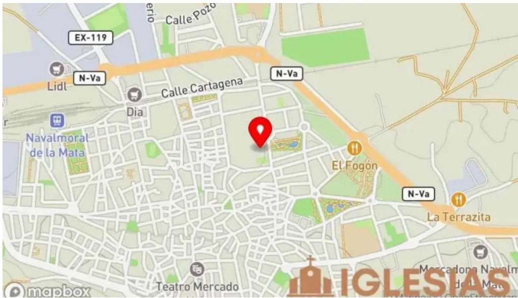
Ermita de san isidro mapa