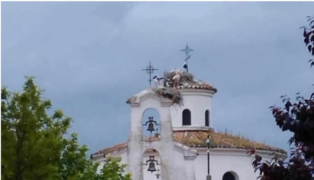
Ermita de san isidro iglesia