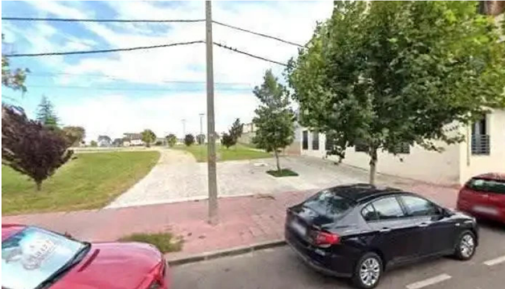
Ermita de san isidro iglesia catolica