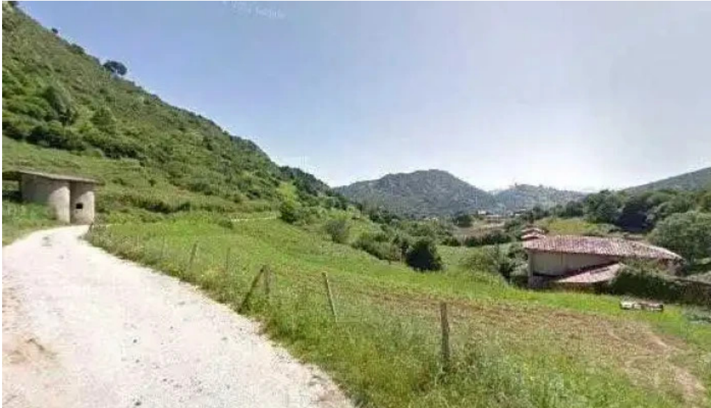
Iglesia de los stos cosme y damian iglesia catolica