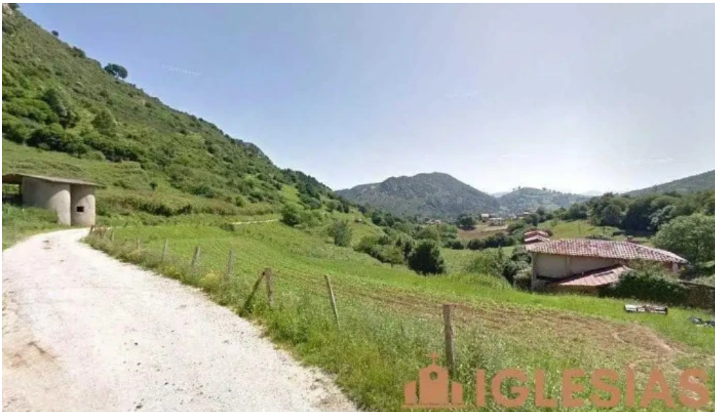
Iglesia de los stos cosme y damian narganes