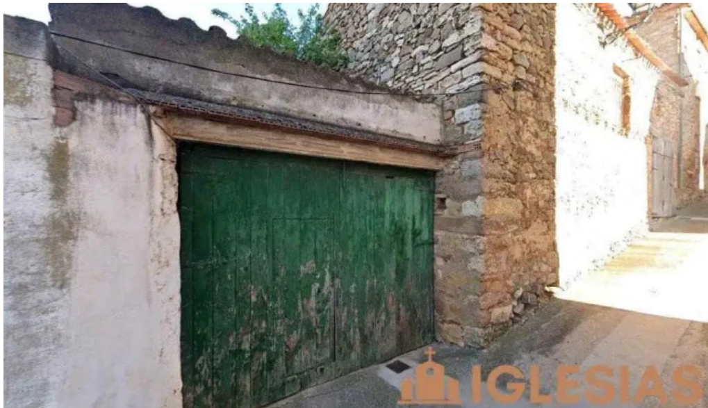
Iglesia de san pedro muro